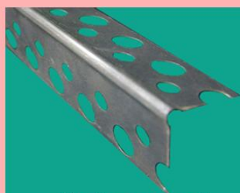
Профиль угловой перфорированный