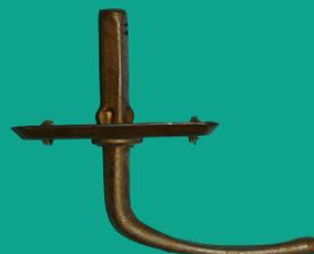
Ручка металлическая ЗР-2-1