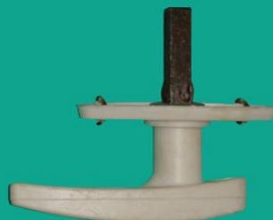
Ручка пластмассовая ЗР-2-1