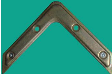
Угольник - 100