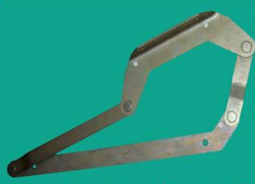
Механизм трансформации ДУ-130000