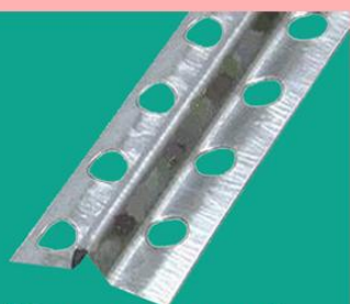
Маяк штукатурный перфорированный