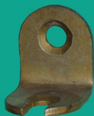
Стяжка угловая УС-2830