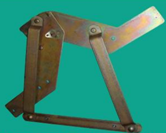
Механизм трансформации МТ-10