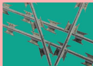
Лента колючая армированная (АКЛ-20)