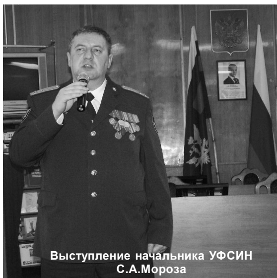
Выступление начальника УФСИН С.А.Мороза

12 марта в нашей стране отмечался профессиональный праздник работников уголовно-исполнительной системы (УИС) России. В далеком 1879 году Император Александр III издал Указ о создании тюремного департамента, положивший начало единой государственной системе исполнения наказаний в России.