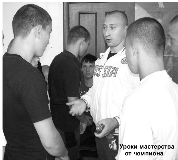
Уроки мастерства от чемпиона