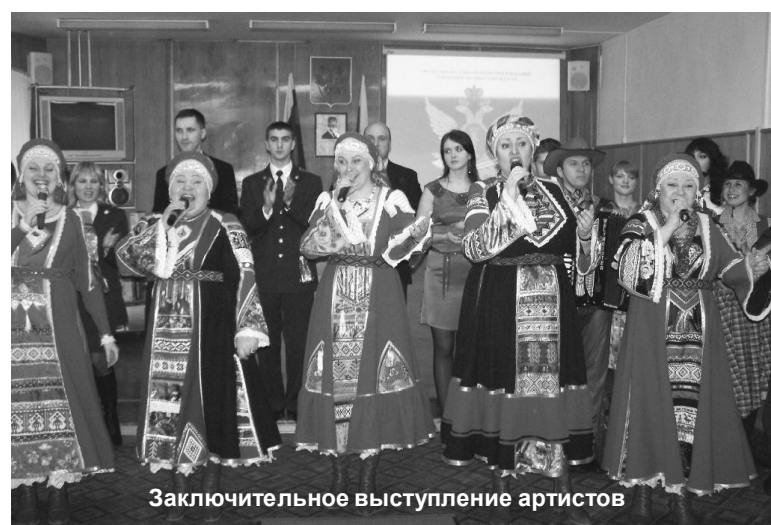
Заключительное выступление артистов