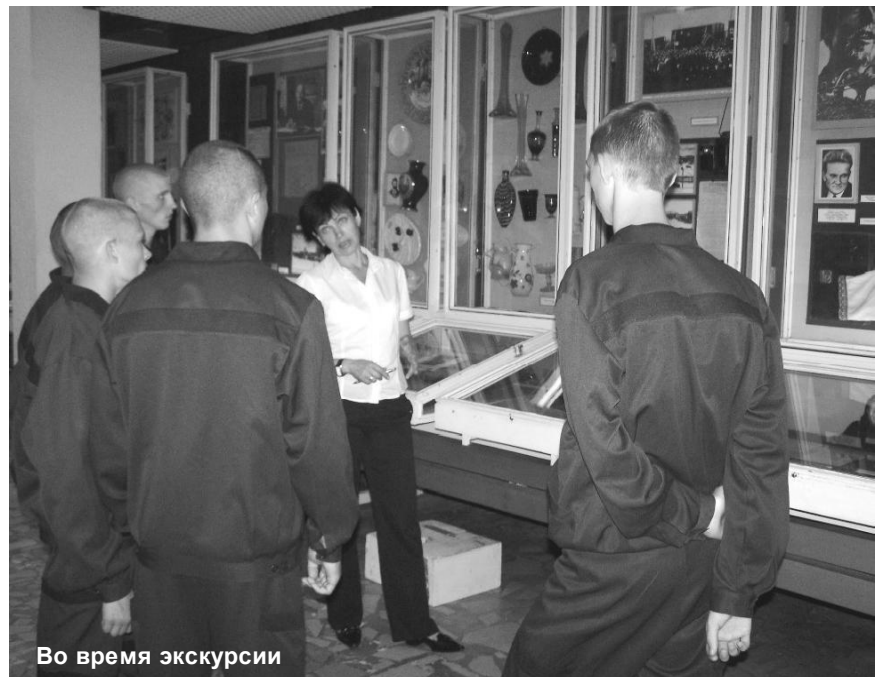
Во время экскурсии