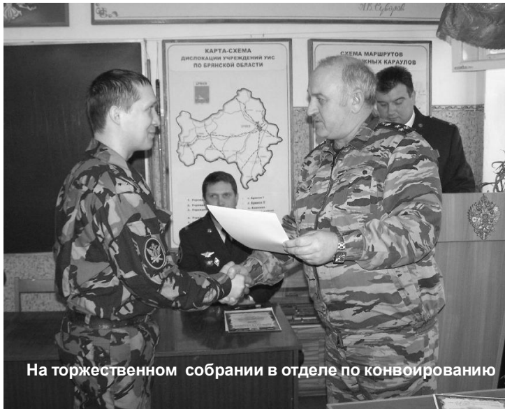
На торжественном собрании в отделе по конвоированию

По завершении приёма функций конвоирования территориальными органами УИС Минюста Рос-