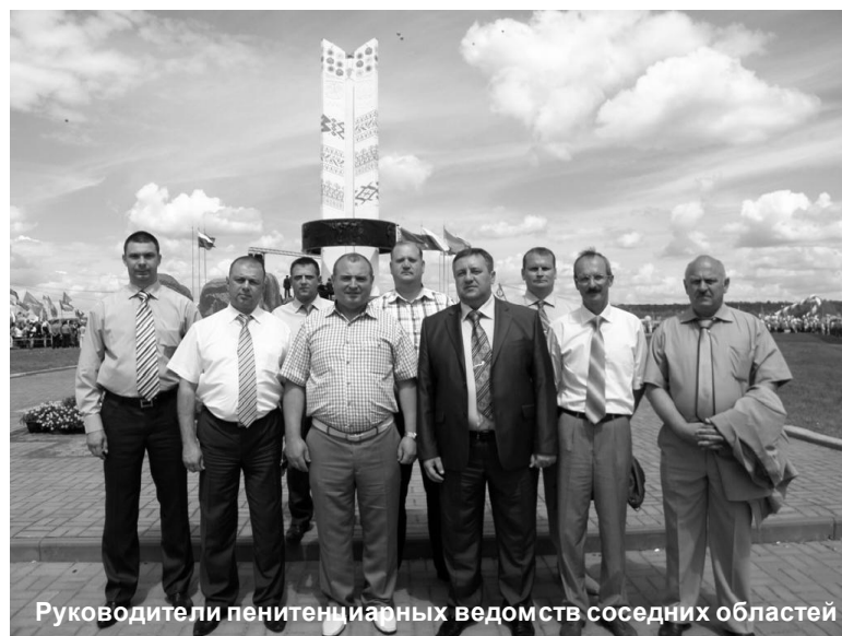
Руководители пенитенциарных ведомств соседних областей

С приветствием к участникам фестиваля обратился Патриарх Московский и Всея Руси Кирилл - «Сегодня три независимых государства, суверенно определяющие пути своего развития, принадлежат друг другу через общность братских народов. Эта общность сформирована всей тысячелетней историей, она поддержана и вдохновлена единой православной верой, одной культурой, общими духовными и нравственными ценностями. Дай Бог, чтобы дальнейшее суверенное развитие братских государств сопровождалось сохранением той общности, без которой мы не будем иметь успеха в будущем, потому что от общего корня и происходит наша сила».