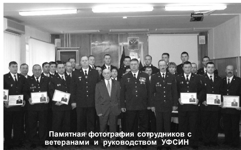
Памятная фотография сотрудников с ветеранами и руководством УФСИН

В день праздника ряд сотрудников были отмечены ведомственными наградами «За усердие в службе», Почетными грамотами, благодарственными письмами и ценными подарками. В столь знаменательный день особое внимание было уде-