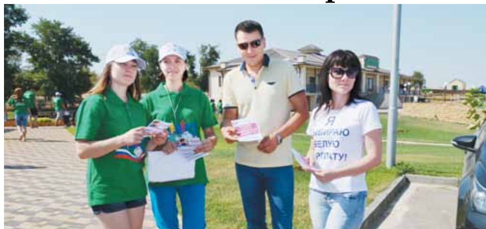
Участники форума раздавали молодежи листовки-памятки «Скажи «нет» зарплате в конверте».