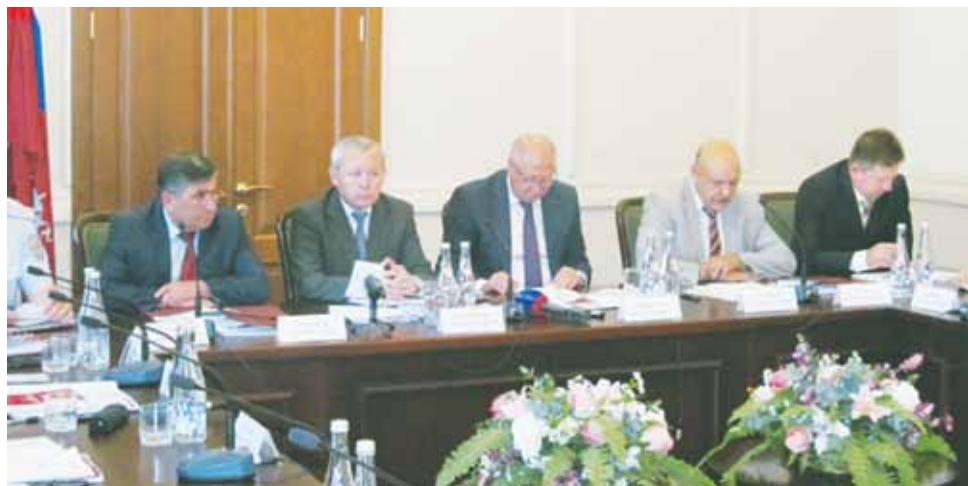
Совещание начальников территориальных органов ФМС России, расположенных в СКФО.

Об уровне взаимодействия свидетельствует и тот факт, что за семь месяцев текущего года в органы дознания направлено 116 материалов по нарушениям миграционного законодательства, возбуждено 39 уголовных дел, 5 лиц привлечены к уголовной ответственности. Вместе с тем, как неоднократно подчеркивалось на совещании, нельзя успокаиваться на достигнутом. Заведомо нерешаемых проблем по линии взаимодействия ГУ МВД и УФМС нет, но есть вопросы, требующие незамедлительного решения. Необходимо, скажем, качественно (через использование компьютерных технологий) улучшить межведомственный информационный обмен, особое внимание уделять антикоррупционной работе, активизировать сотрудничество в отдаленных районах и селах, наладить совместную учебу сотрудников двух ведомств на местах. Важно не забывать, говорилось на совещании, что процессы внешней и внутренней миграции влияют не только на ситуацию в экономике и социальной сфере. Без контроля над этими процессами, без обеспечения неукоснительного выполнения миграционного законодательства и иностранцами, и россиянами невозможно обеспечить и надлежащий правопорядок в крае. А соответственно, не обойтись без результативного межведомственного взаимодействия, для дальнейшего развития которого есть все возможности.