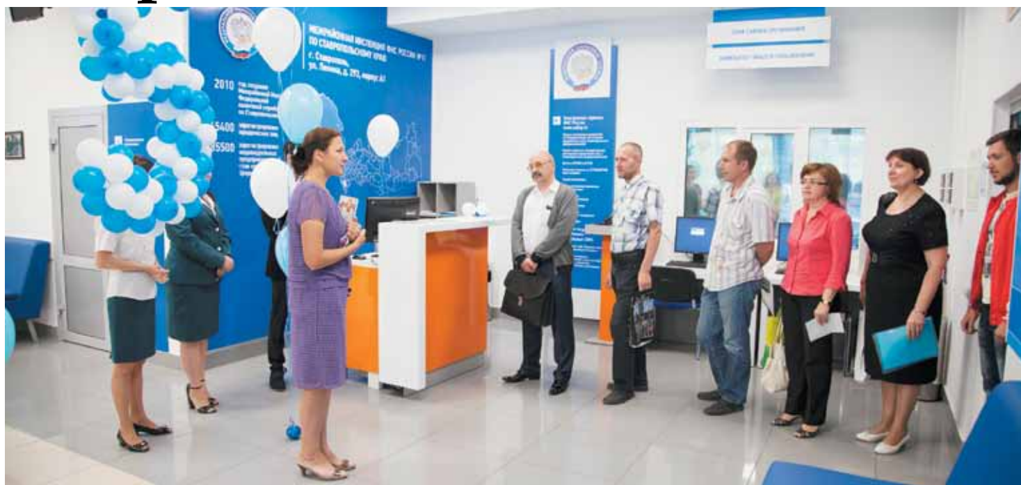
Межрайонная ИФНС России № 11 по Ставропольскому краю принимает первых посетителей в свой пятилетний юбилей.

Пять лет назад 1 сентября в Ставрополе была создана специализированная налоговая инспекция. С этого дня все регистрационные действия, связанные с государственной регистрацией юридических лиц и индивидуальных предпринимателей, а также предоставление сведений в виде копии документа на территории Ставропольского края осуществляются этой инспекцией. Создание Единого регистрационного центра, которым, по сути, является Межрайонная ИФНС России № 11 по Ставропольскому краю, стало первым шагом на пути обеспечения принципа экстерриториальности налоговых услуг.