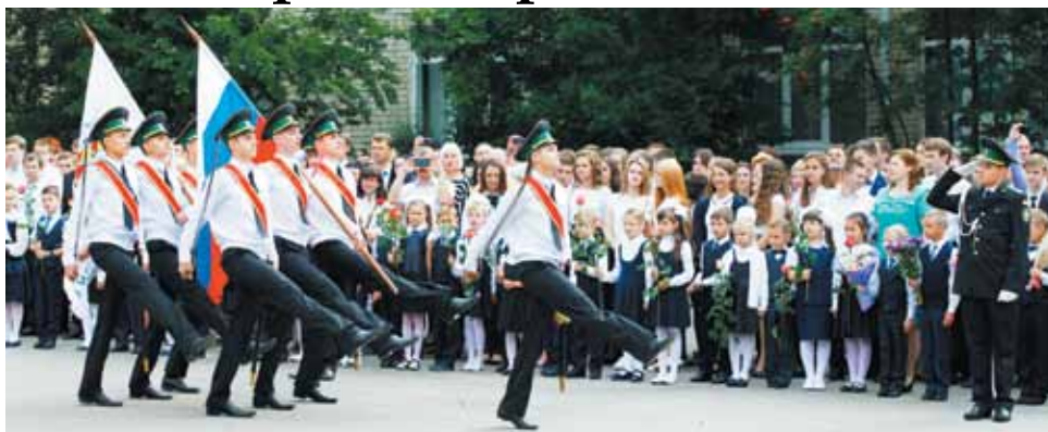
Кадеты выносят государственный флаг Российской Федерации и флаг гимназии

На линейке выступили учащиеся кадетских классов. Состоялся торжественный вынос государственного флага Российской Федерации и флага гимназии. После этого торжество продолжилось в учебных кабинетах тематическим уроком «Урок Мира», который был посвящен истории войн и крупных вооруженных конфликтов, произошедших на территории нашего государства в XX веке и на современном этапе.