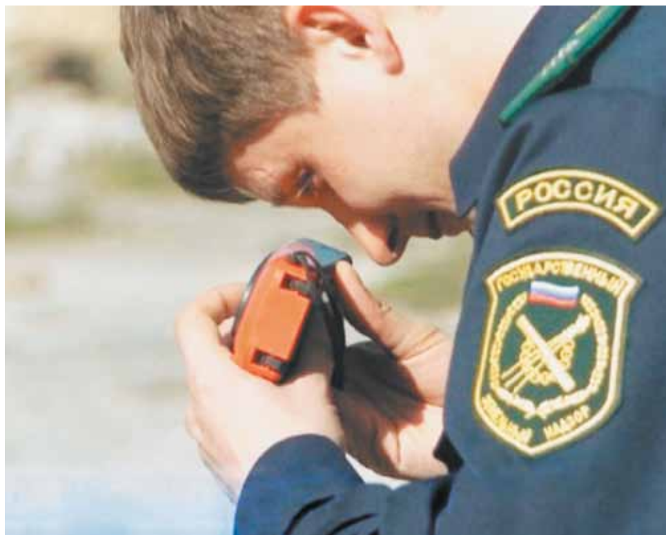
За семь месяцев 2015 года проведено 2119 проверок соблюдения земельного законодательства.