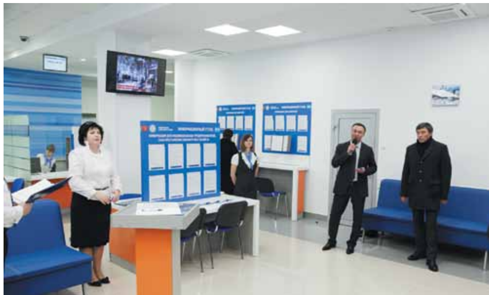
28 ноября 2014 года Межрайонная ИФНС России № 11 по Ставропольскому краю открылась после ремонта в фирменном стиле.

Электронные сервисы можно использовать для получения сведений из реестров, а не обращаться в инспекцию за выпиской на бумаге. При этом выписка из реестров или справка об отсутствии запрашиваемой информации, сформированная с сайта Федеральной налоговой службы России, в форме электронного документа, подписанного усиленной квалифицированной электронной подписью, равнозначна выписке (справке) на бумаж-