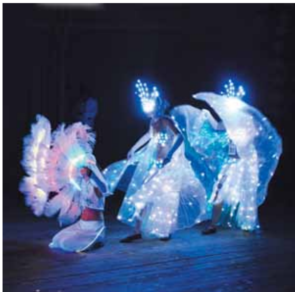
Световое шоу УПФР по городу Ставрополю.

Соревнования проходили весь день, музыкальные выступления участников