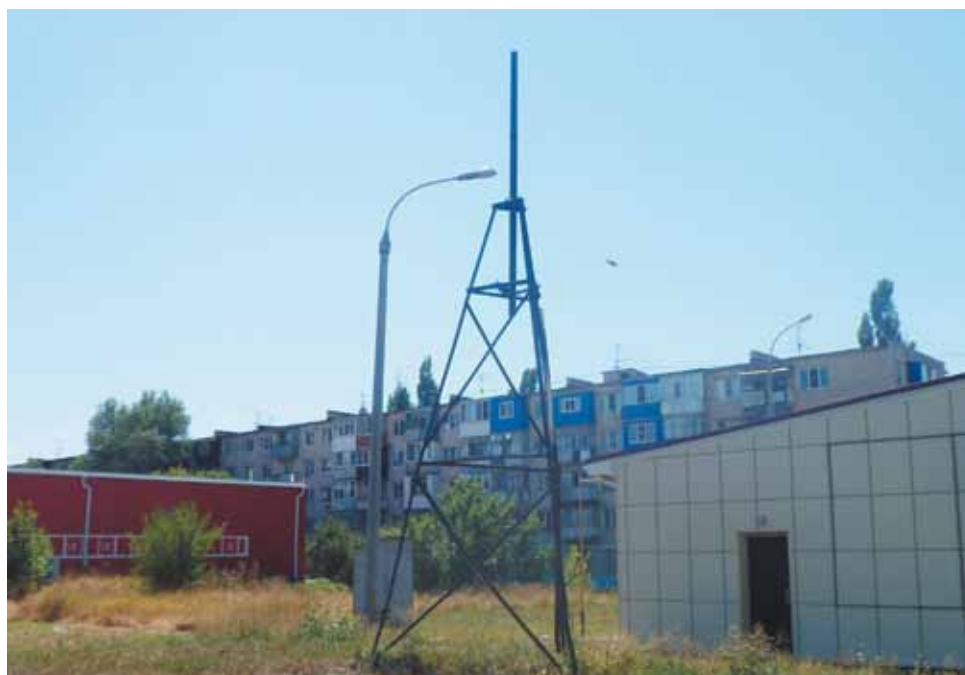
Пункт государственной геодезической сети.

Также рассмотрено 347 заявок на предостав-