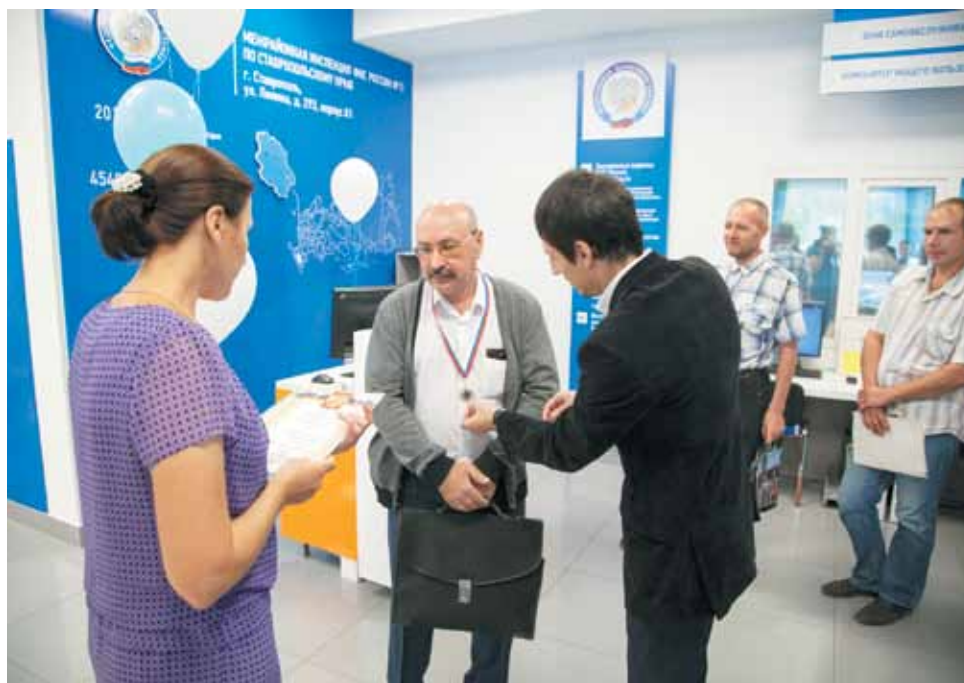
Первый посетитель в пятилетний юбилей инспекции был награжден сувенирной медалью и получил памятный подарок.

ном носителе, подписанной собственноручной подписью должностного лица налогового органа и заверенной печатью.