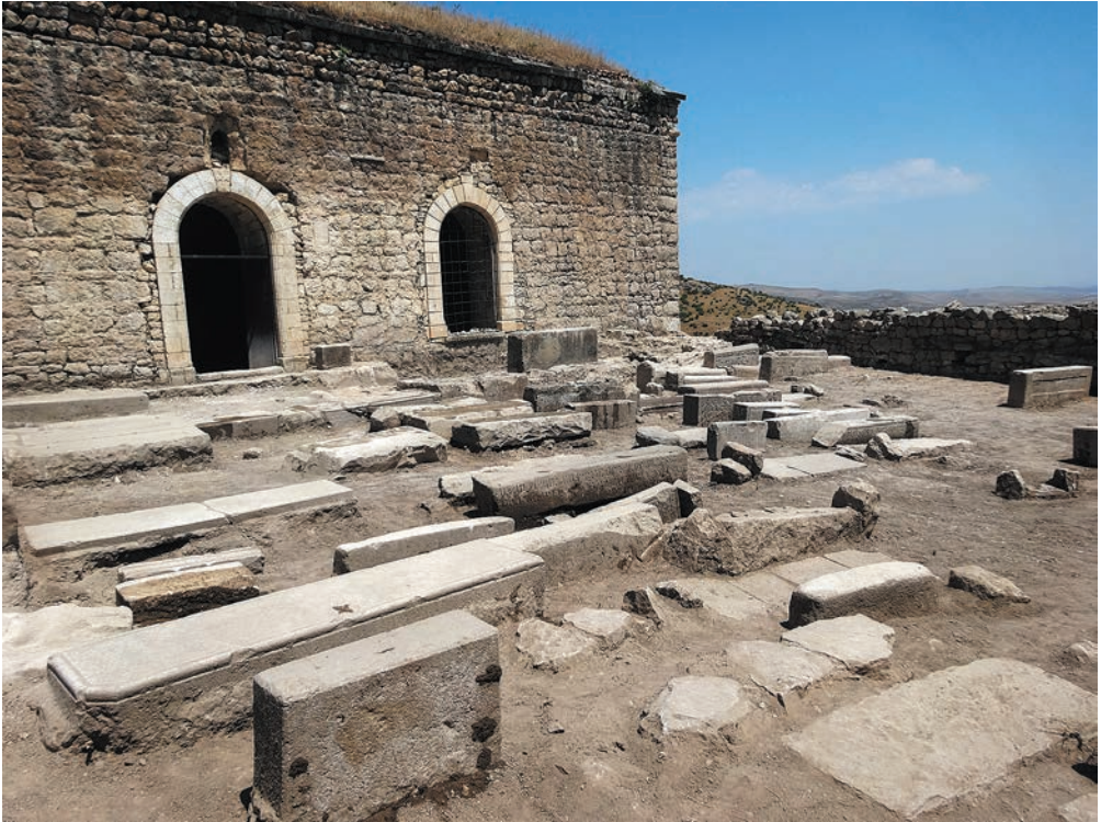
Նկ. 11. Հարավային փայանարակի ընդհանուր տեսքը պեղումներից հետո