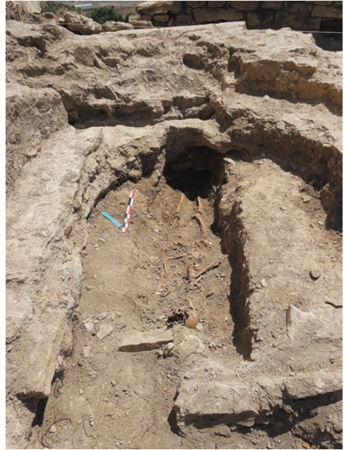
Նկ. 9. Եկեղեցուն հարավ-արևելքից կից շինության արսիդի փակ իրականացված թաղումը