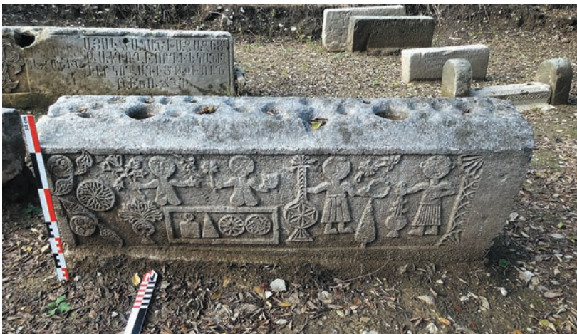
Նկ. 14-15. Տապանաքարեր հյուսիսային փայփանարակում