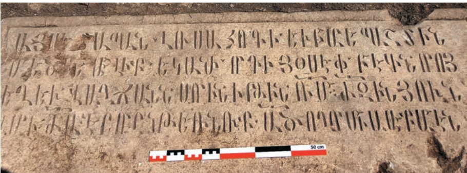
Նկ. 17-22. Նորահայր արձանագիր տապանաքարեր Սբ. Հովհաննես եկեղեցու հարավային և հյուսիսային տապանաքակերից