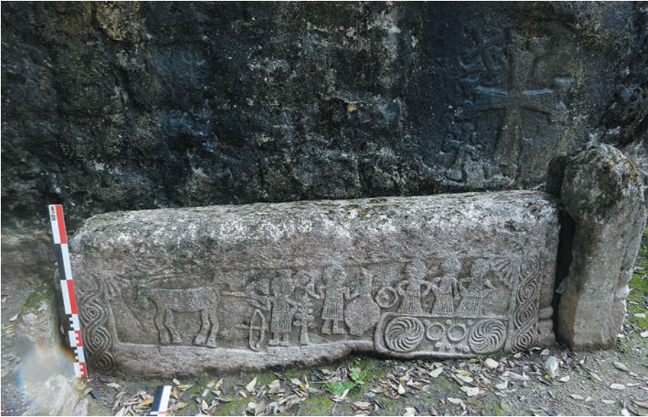
Նկ. 16. Տապանաքարեր հյուսիսային տապանաքակում