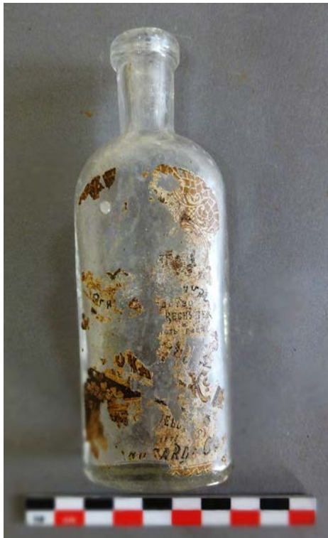
Նկ. 10. Պեղումներից հայտնաբերված օձանելիքի սրվակ