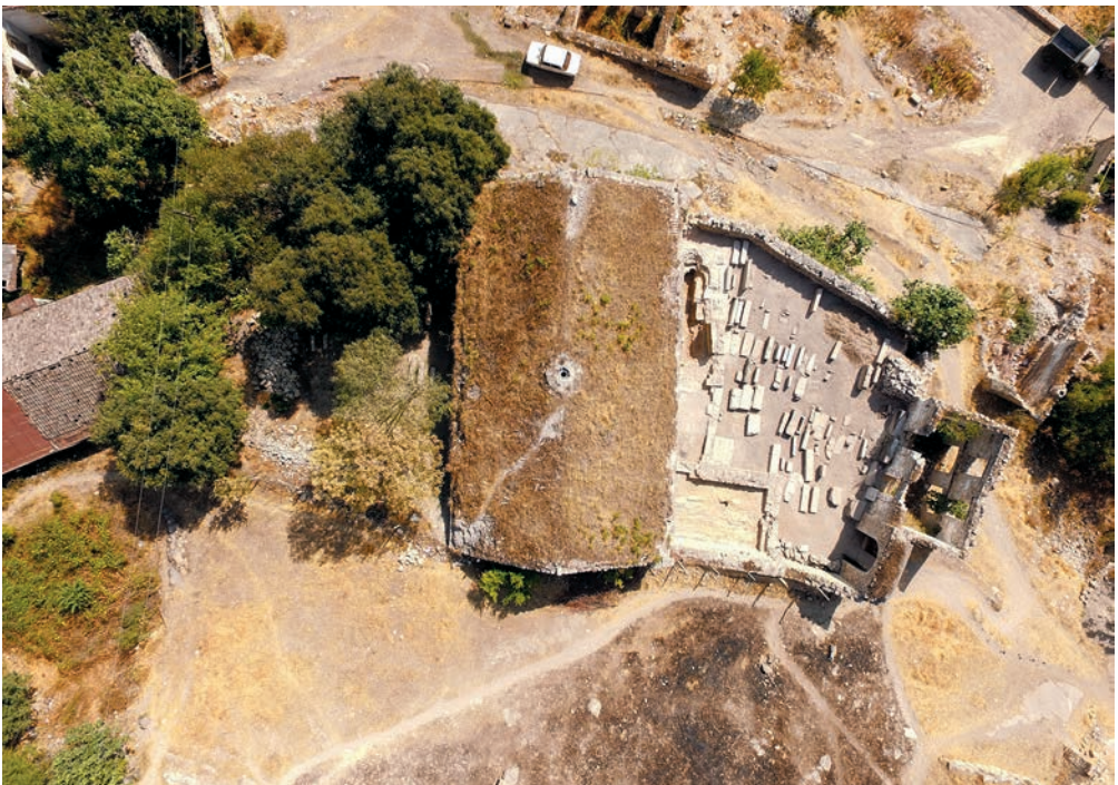
Նկ. 12. Հարավային փայանարակի օդայուսանկարը