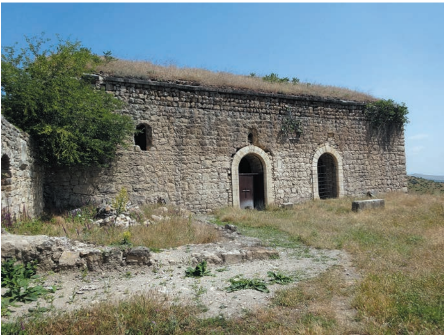
Նկ. 2. Սբ. Հովհաննես եկեղեցին և հարավ-արևմուտքից կից շինության հետքերը պեղումներից առաջ