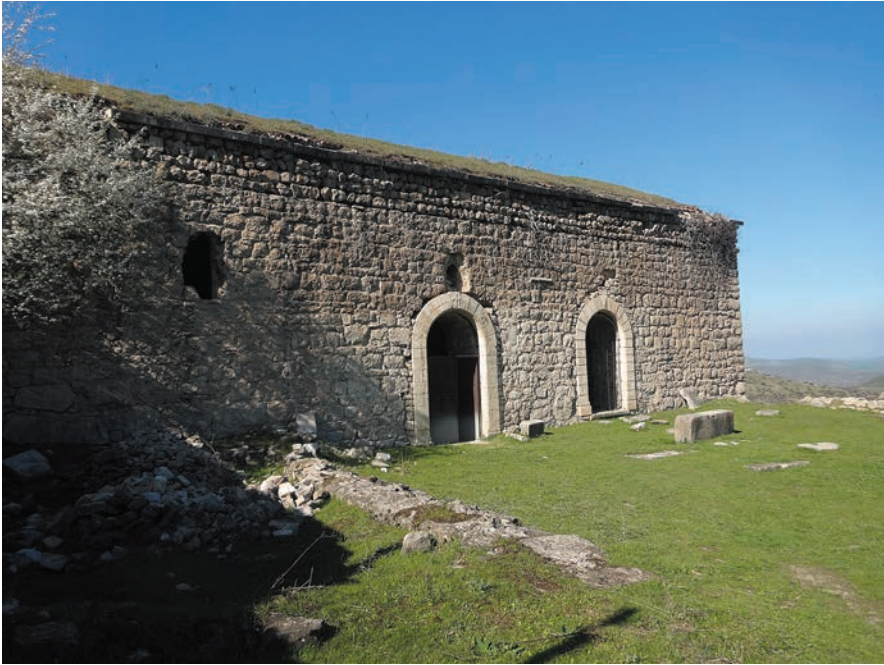
Նկ. 1. Սբ. Հովհաննես եկեղեցու ընդհանուր տեսքը հարավ-արևմուտքից

Տողի Սբ. Զովհաննես եկեղեցու հնագիտական հետազոտության հիմնական արդյունքները