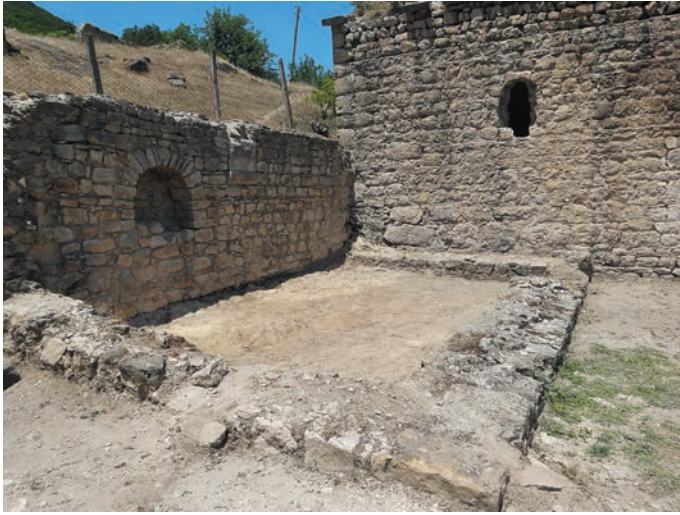
Նկ. 3. Եկեղեցուն հարավ-արևմուտքից կից շինության ընդհանուր տեսքը պեղումներից հետո