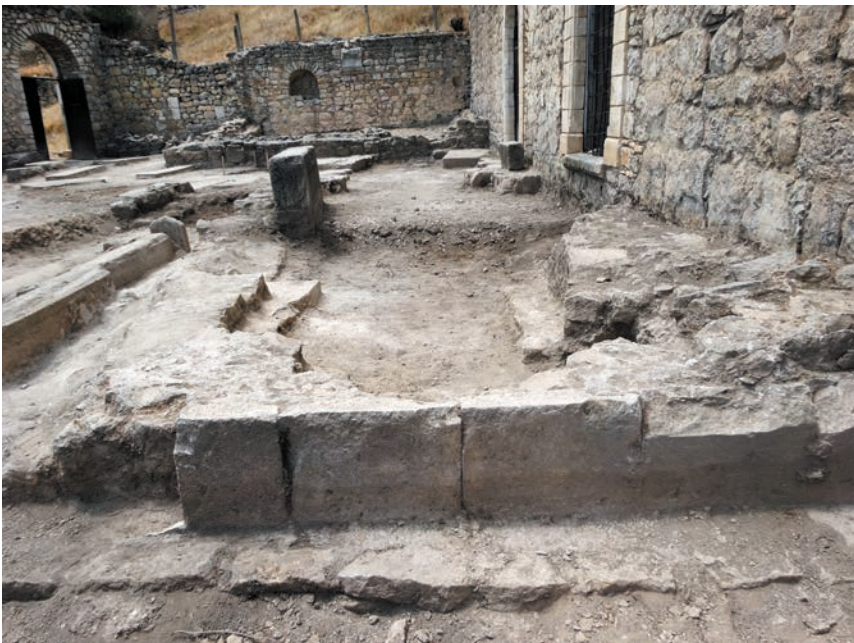
Նկ. 6-7. Եկեղեցուն հարավ-արևելքից կից շինության ընդհանուր տեսքը