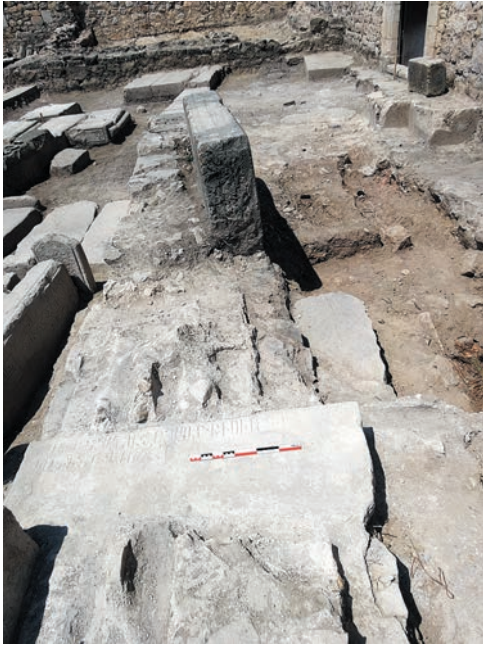
Նկ. 8. Թվակիր արձանագրությանը տապանաքար՝ հարավ-արևելյան շինության պարի մեջ