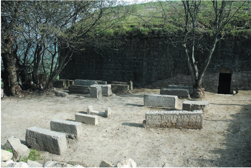
Նկ. 13. Հյուսիսային փայփանարակի ընդհանուր տեսքը մաքրումից հետո