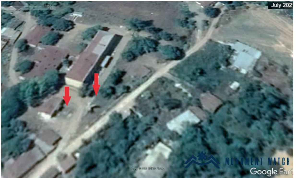
Նկ. 44 Հաղրութի շրջանի Մեծ Թաղեր գյուղում գտնվող ԽՍՀՄ ավիացիայի մարշալ Արմենակ Խանսիերյանցի կիսանդրին ոչնչացված: