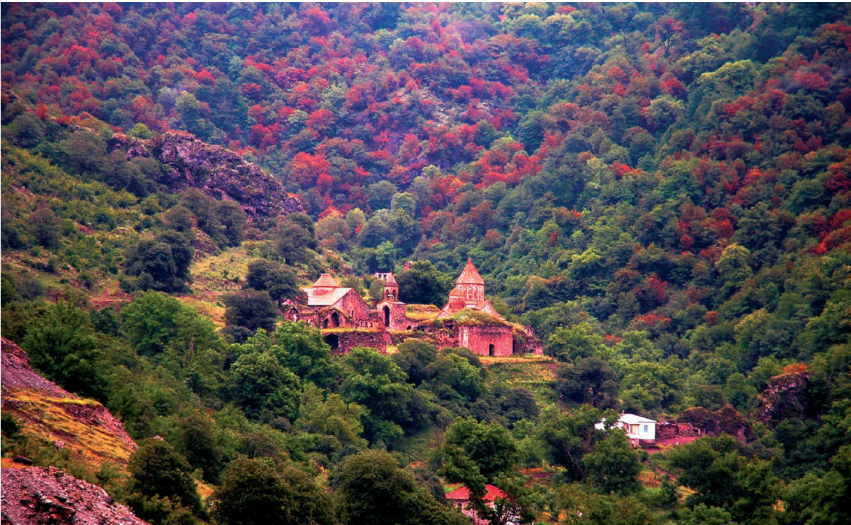
Նկ. 9 Դադիվանք: