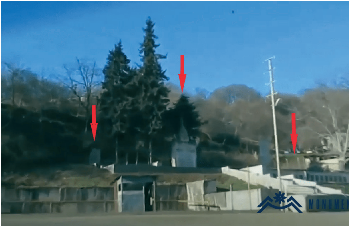
Նկ. 41 Հադրութի Ազոխ գյուղի Հայրենական Մեծ պատերազմի, Արցախյան առաջին պատերազմի և Հայոց ցեղասպանության զոհերի հիշատակին նվիրված հուշարձանների ավերումը: