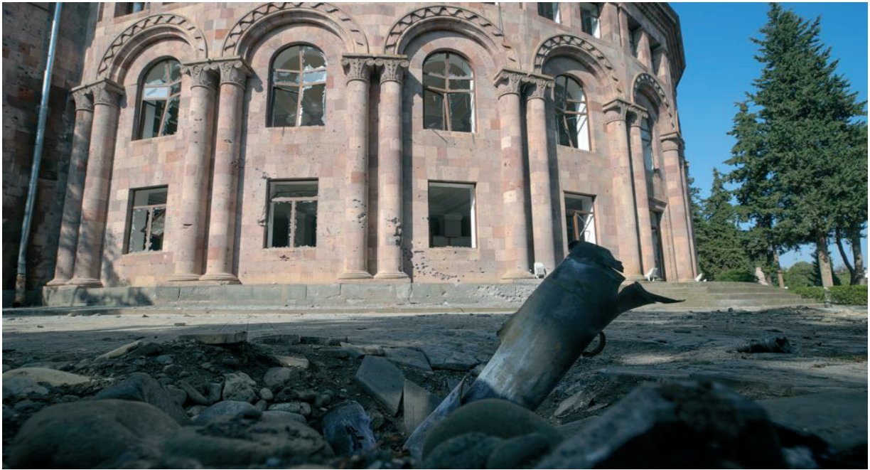
Նկ. 33 Մարտունի քաղաքի մշակույթի պալատը հրետակոծումից հետո: