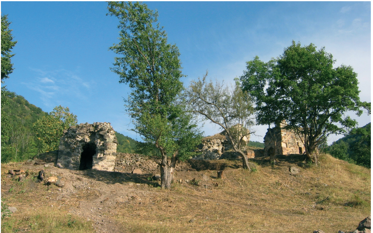
Նկ. 11 Հանդաբերդի վանք: