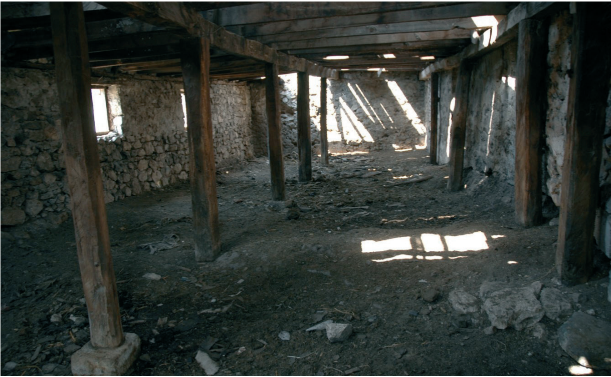
Նկ. 25 Չարեքտարի վանքը՝ վերածված գոմի: