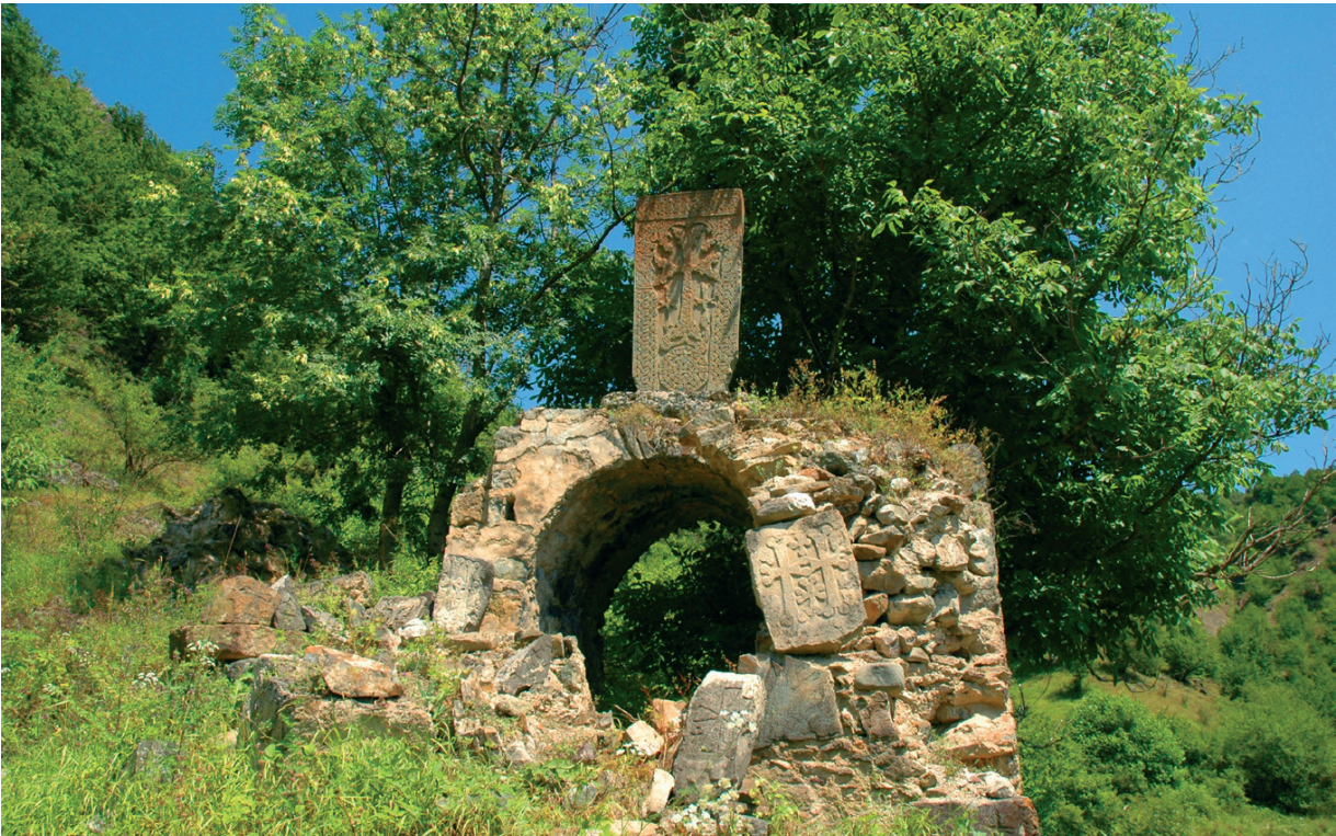
Նկ. 13 Չափնիի վանք, զանգակատուն: