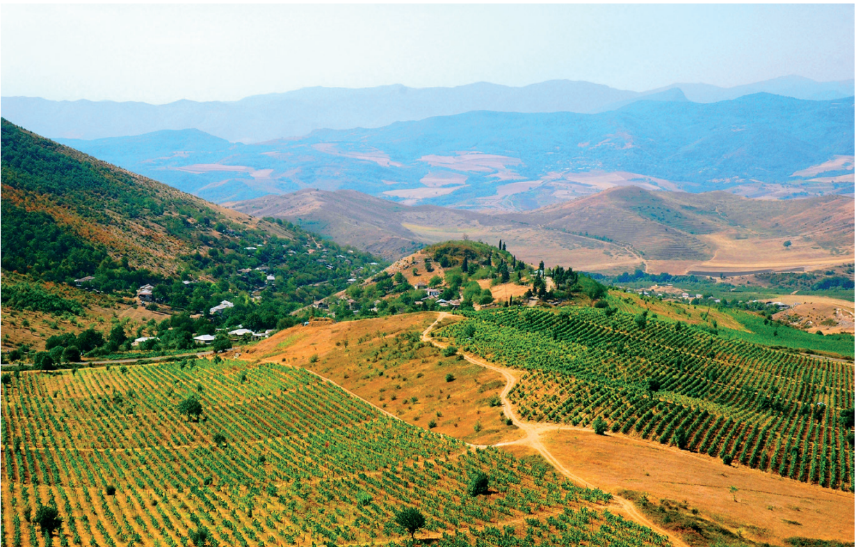
Նկ. 2 Ամարասի հովիտը: