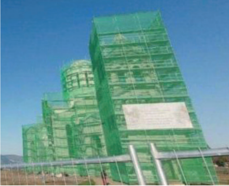
Նկ. 50 Շուշիի Սուրբ Ամենափրկիչ Ղազանչեցոց եկեղեցու սկզբնական կերպարի խեղաթյուրումը:

Ադրբեջանը՝ «շինարարական աշխատանքների» քողի տակ նպատակային վերացնում է ճանապարհի մոտ գտնվող հայկական պատմական բնակավայրերը, որոնք տարածաշրջանում հայերի հազարամյա գոյության ապացույցն են: Արբանյակային նկարների միջոցով հնարավոր եղավ փաստել Շուշիի պատմական գերեզմանոցի ոչնչացումը (նկ. 47): Ավերվել է Հադրութի շրջանի Մեծ Թաղեր գյուղի գերեզմանոցը (նկ. 48), Ասկերանի Շոշ համայնքի Սղնախի գերեզմանոցը (նկ. 49):