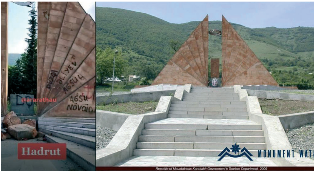
Նկ. 42 Հադրութի ազատամարտիկներին նվիրված հուշահամալիրի ավերումը: