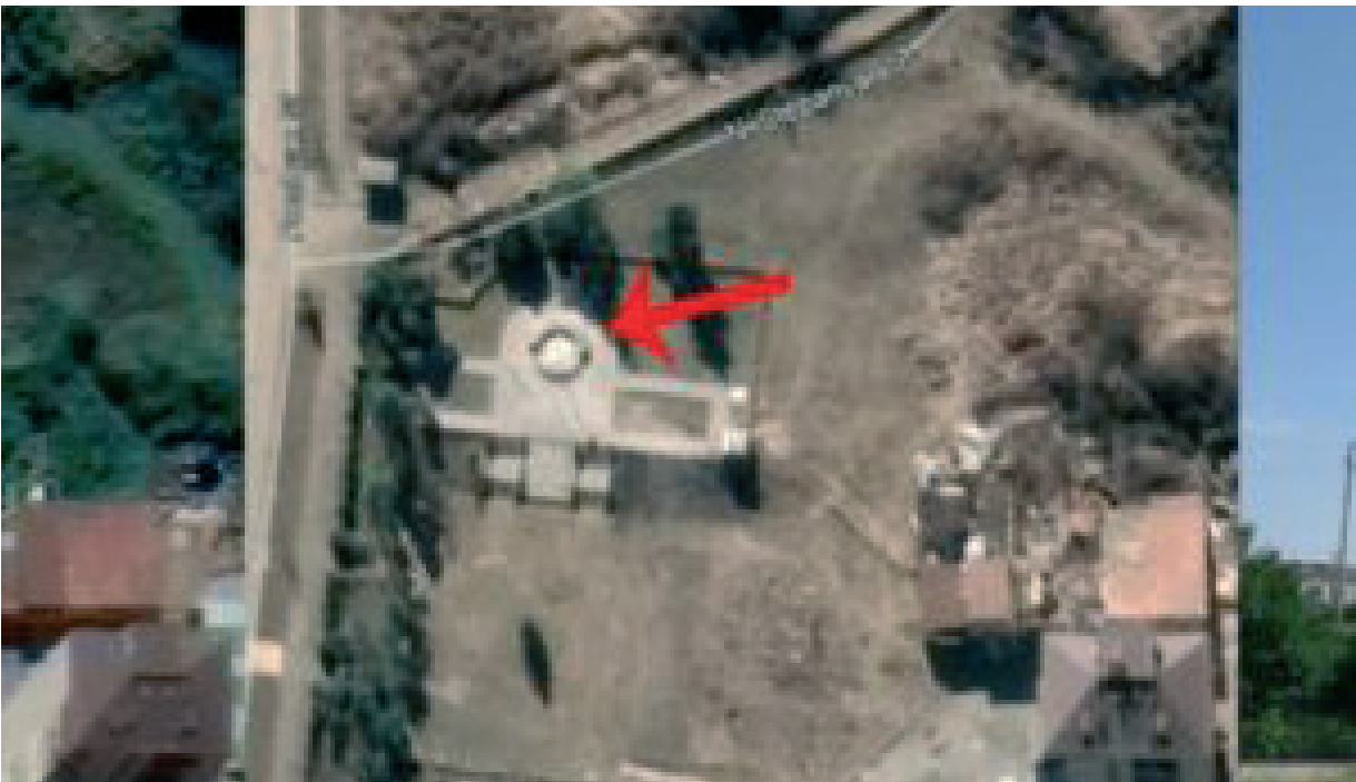
Նկ. 40 Շուշիում Հայոց ցեղասպանության զոհերի հիշատակին նվիրված հուշարձանի ավերումը: