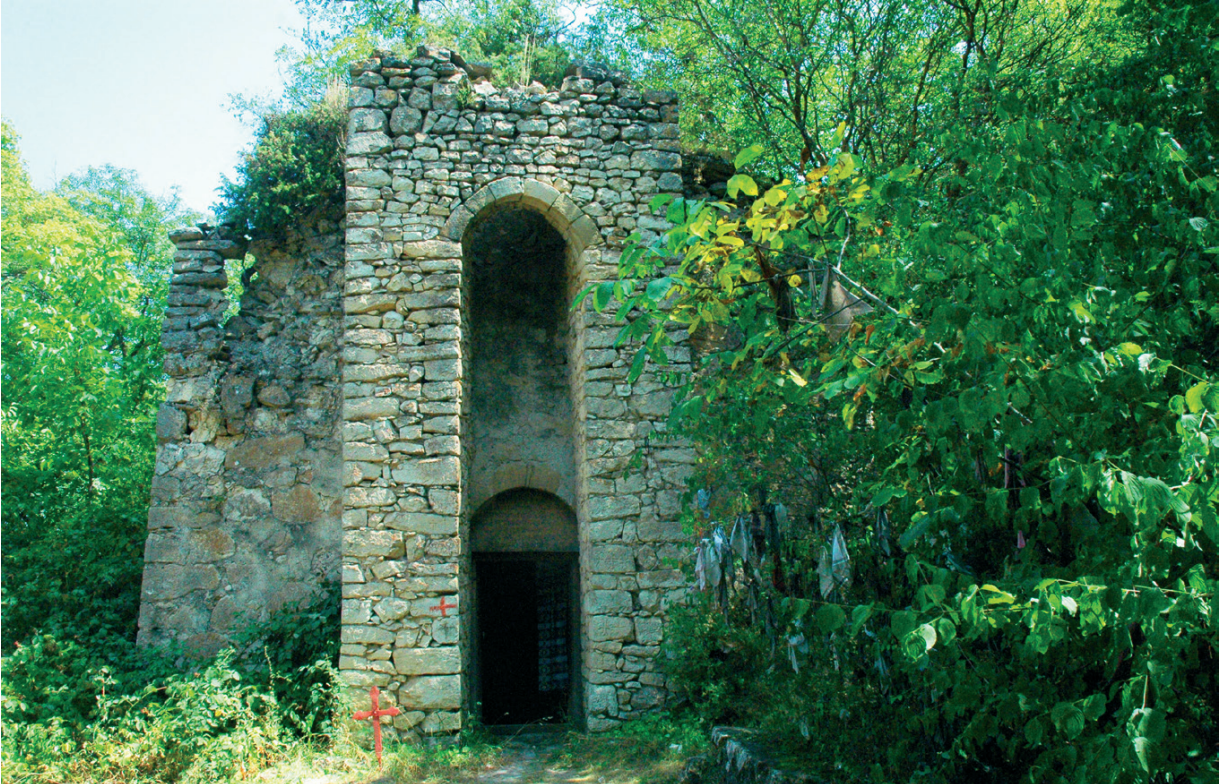
Նկ. 16 Հոռեկավանք: