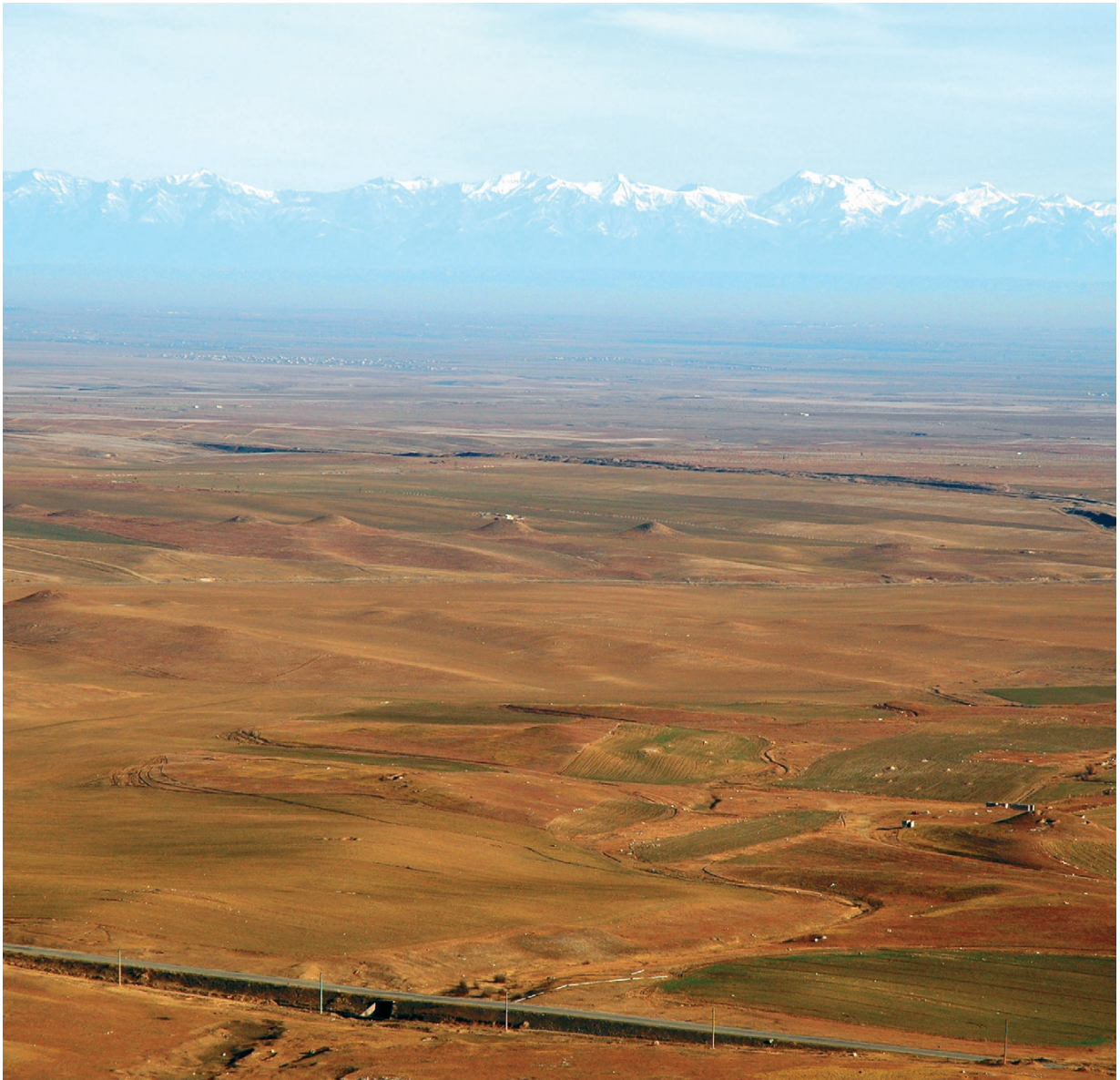
Նկ. 3 Արցախյան տափաստանը:

Երկու տարբեր աշխարհագրական ու բնա-կլիմայական միջավայրերը պայմանավորել են պատմա-մշակութային երկակի կերպարը՝ ամուր նստակյաց բնակչություն լեռնային գոտում և անընդհատ շարժումներ տափաստանում: