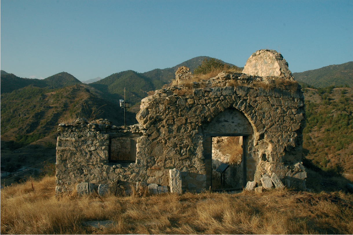
Նկ. 12 Չարեբրտարի վանք: