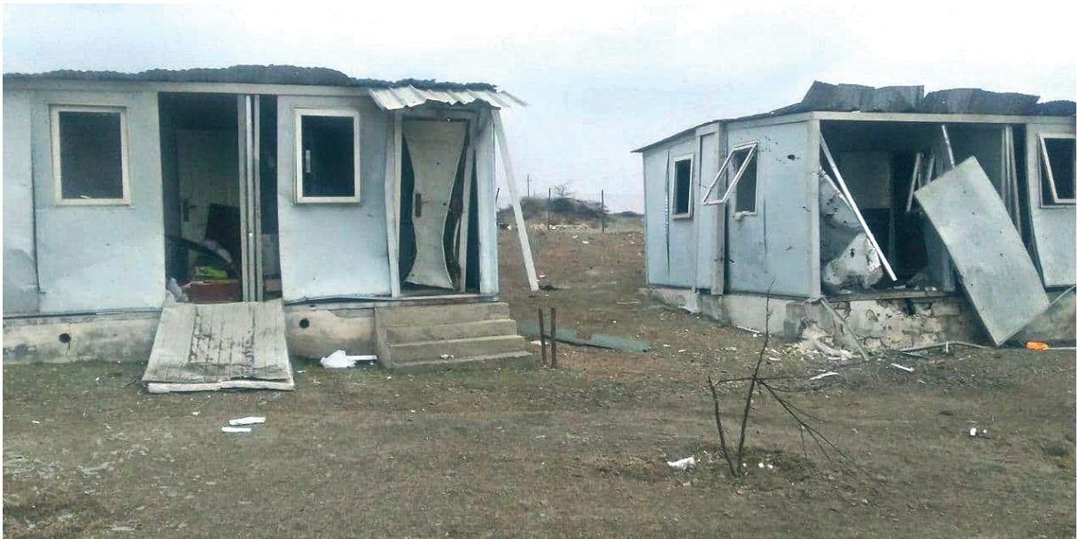
Նկ. 34 Տիգրանակերտի հնագիտական հանգրվանը հրետակոծումից հետո:

Համաձայն Արցախի ԿԳՄՍՆ-ի տրամադրած տվյալների՝ նոյեմբերի 9-ի եռակողմ պայմանագրի ստորագրումից հետո Ադրբեջանի վերահսկողության տակ են անցել՝