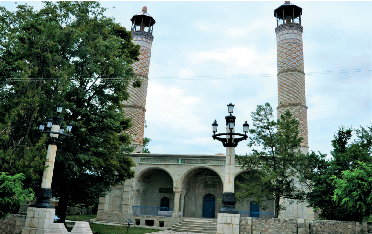
Նկ. 30 Շուշիի Գոհար աղայի մզկիթը վերականգնումից հետո:

Թանգարանային ու գրադարանային գործի զարգացման ոլորտում քայլեր են ձեռնարկվել նոր ցուցանմուշների ձեռքբերման, թանգարանային ու գրադարանային հավաքածուների համալրման, մատուցվող ծառայությունների որակի բարձրացման, շենքային, գույքային, նյութատեխնիկական պայմանների բարելավման ուղղությամբ: Հատկապես նշելի է նոր թանգարանների բացումը՝ Տիգրանակերտ (նկ. 31), Քաշաթաղ, Շուշի և այլն: Մշակութային ժառանգության պահպանման ոլորտում, միջազգային գործընթացների և համագործակցության մաս կազմելու նկատառումներից ելնելով, կազմակերպվել են թանգարանների միջազգային օրվան, «Թանգարանների գիշերվան», «Եվրոպական ժառանգության օրերին» և գրադարանավարի օրվան նվիրված ամենամյա միջոցառումներ: