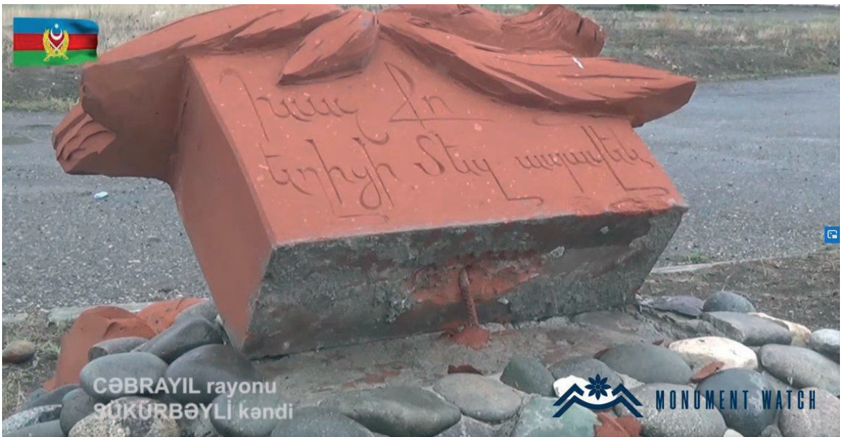
Նկ. 38 Շյուքյուրբեյլի գյուղում տուֆե խաչային հորինվածքով հուշարձանը նշնացված: