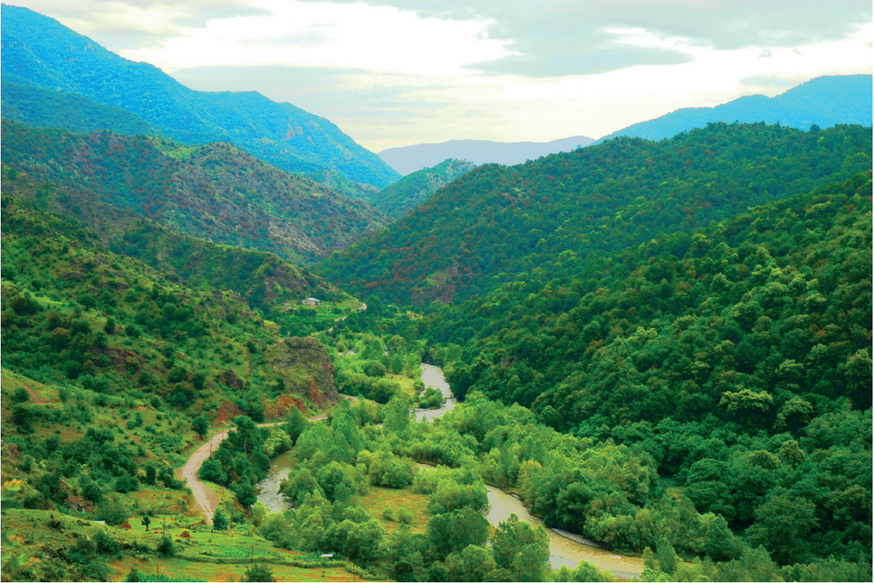
Նկ. 1 Թարթառի գեղատեղիքը: