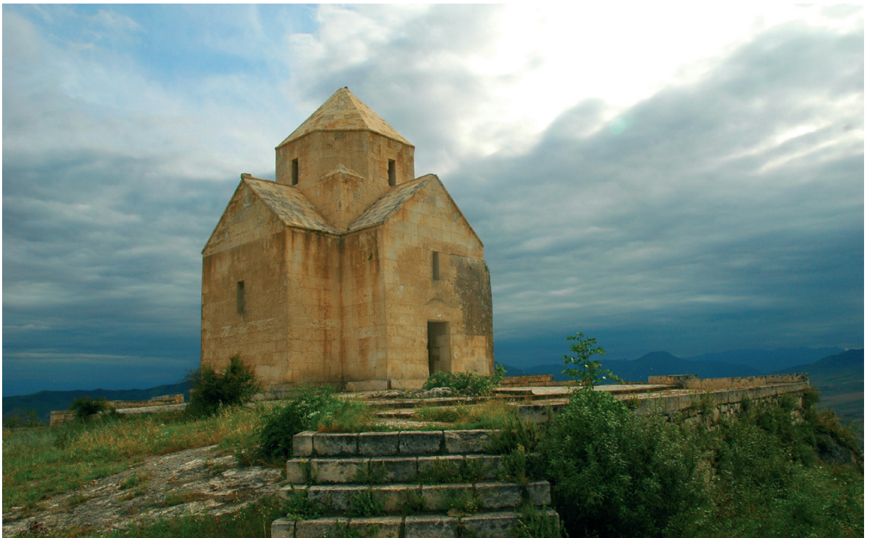
Նկ. 7 Վանքասար: