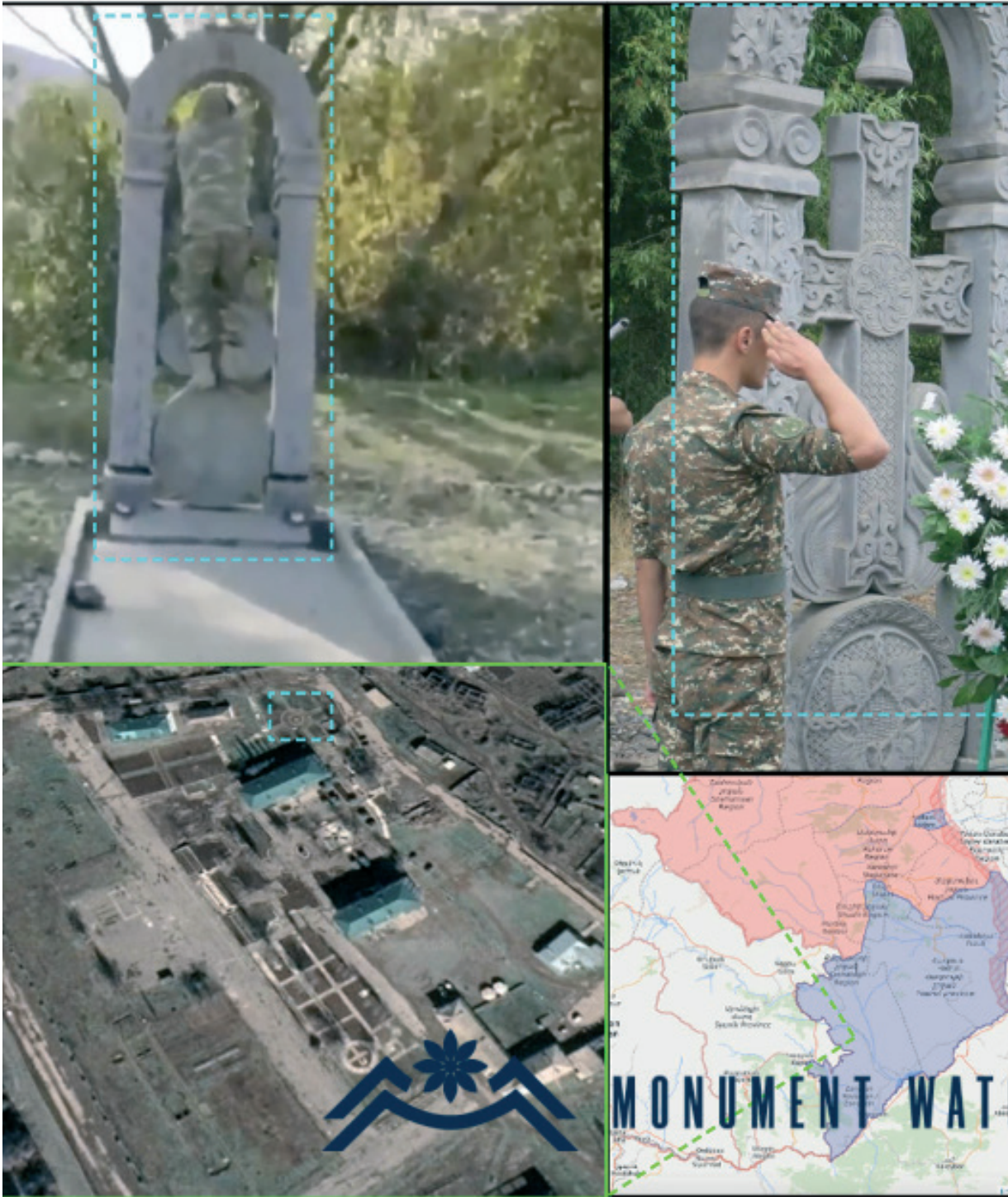
Նկ. 43 Որդւան քաղաքի (Կուրաթըր) Արցախյան առաջին ազատամարտին նվիրված խաչքարի ոչնչացումը: