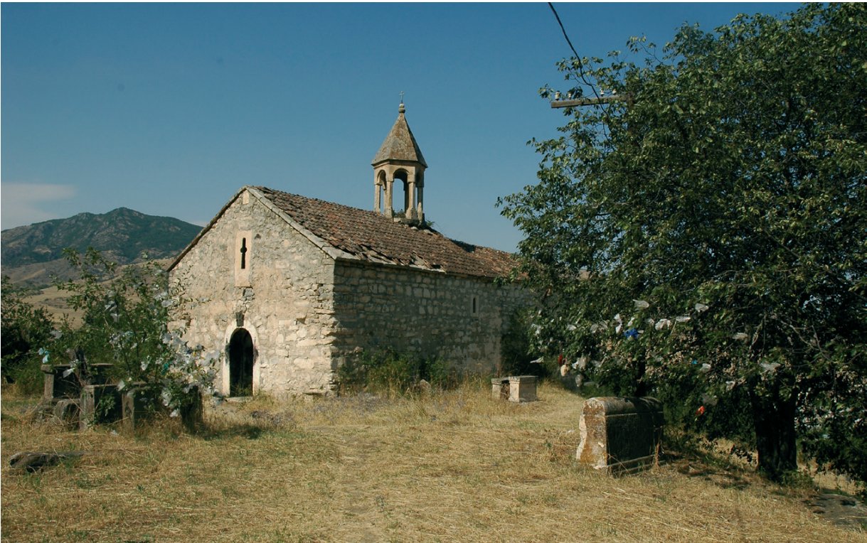
Նկ. 17 Սպիրտակ խաչ վանք: