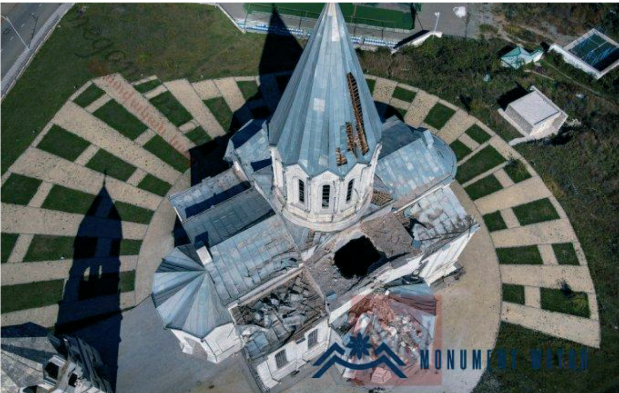
Նկ. 32 Շուշի քաղաքի Սուրբ Ամենափրկիչ Ղազանչեցոց եկեղեցին ունեցած 2020 թվականի հոկտեմբերի 8-ին երկու արկի արդյունքում:

Նշվածի ամենահայտնի օրինակը Շուշի քաղաքի Սուրբ Ամենափրկիչ Ղազանչեցոց եկեղեցու ունեցած ունի 2020 թվականի հոկտեմբերի 8-ին երկու արկ է պայթել (նկ. 32): Պատերազմի ընթացքում՝ ավելի վաղ, ունեցած էր նաև Շուշիի Մշակույթի և երիտասարդության կենտրոնը, որը վերանորոգումից հետո վերաբացվել էր 2017 թվականին: Պատերազմի ընթացքում հրետակոծվել է Մարտունի քաղաքի մշակույթի պալատը (նկ. 33): Հադրութ քաղաքի բնակիչները, ովքեր ստիպված են եղել լքել իրենց տները, փաստում են, որ այրվել է Հադրութի Ա. Մկրտչյանի անվան հայրենագիտական թանգարանը: 2020 թվականի նոյեմբերի 5-ին ունեցած էր Տիգրանակերտի հնագիտական հանգրվանը (նկ. 34):