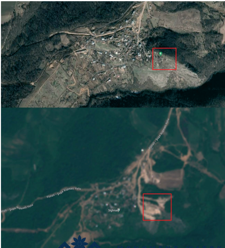
Նկ. 49 Ասկերանի Շոշ համայնքի Սղնախի գերեզմանոցի ավերումը: