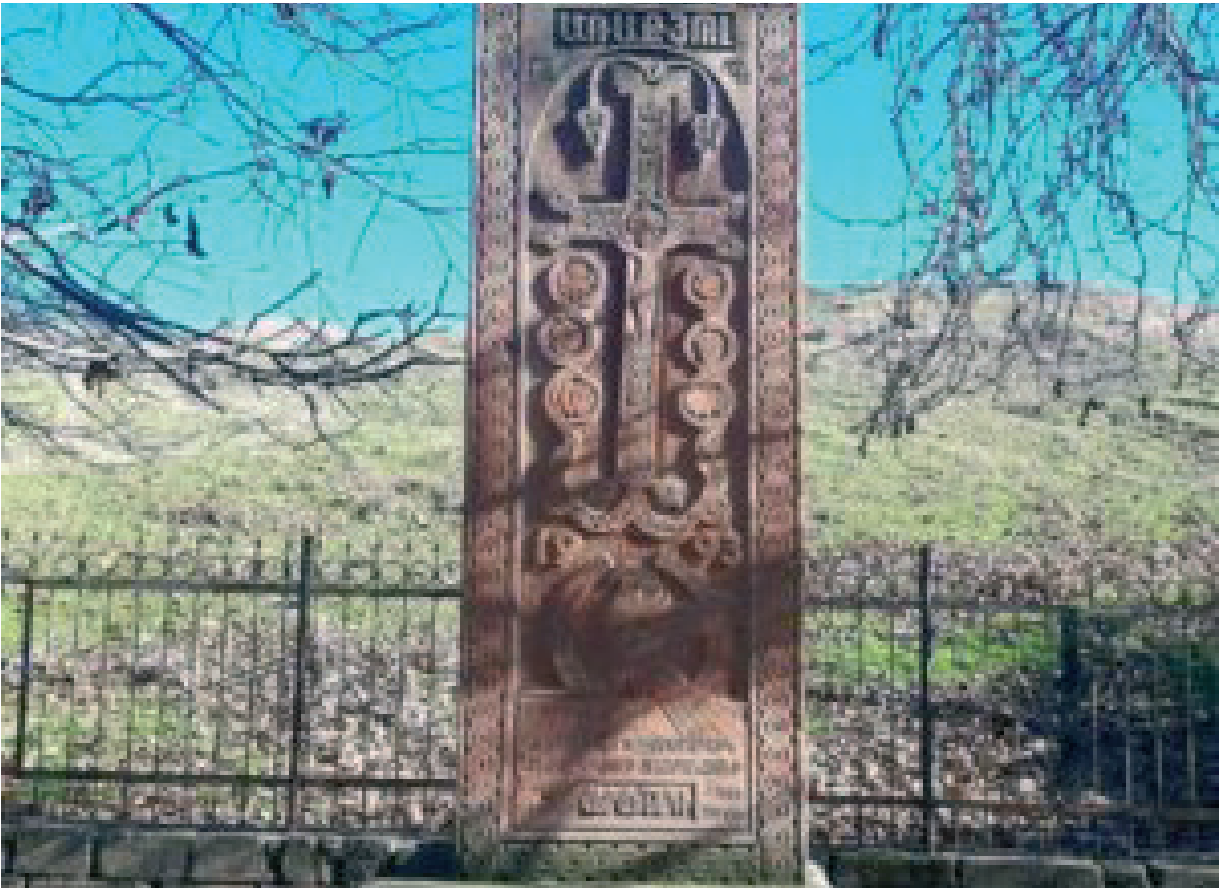
Նկ. 39 Հաղորութի Առաքել գյուղի խաչքարն այժմ չկա: