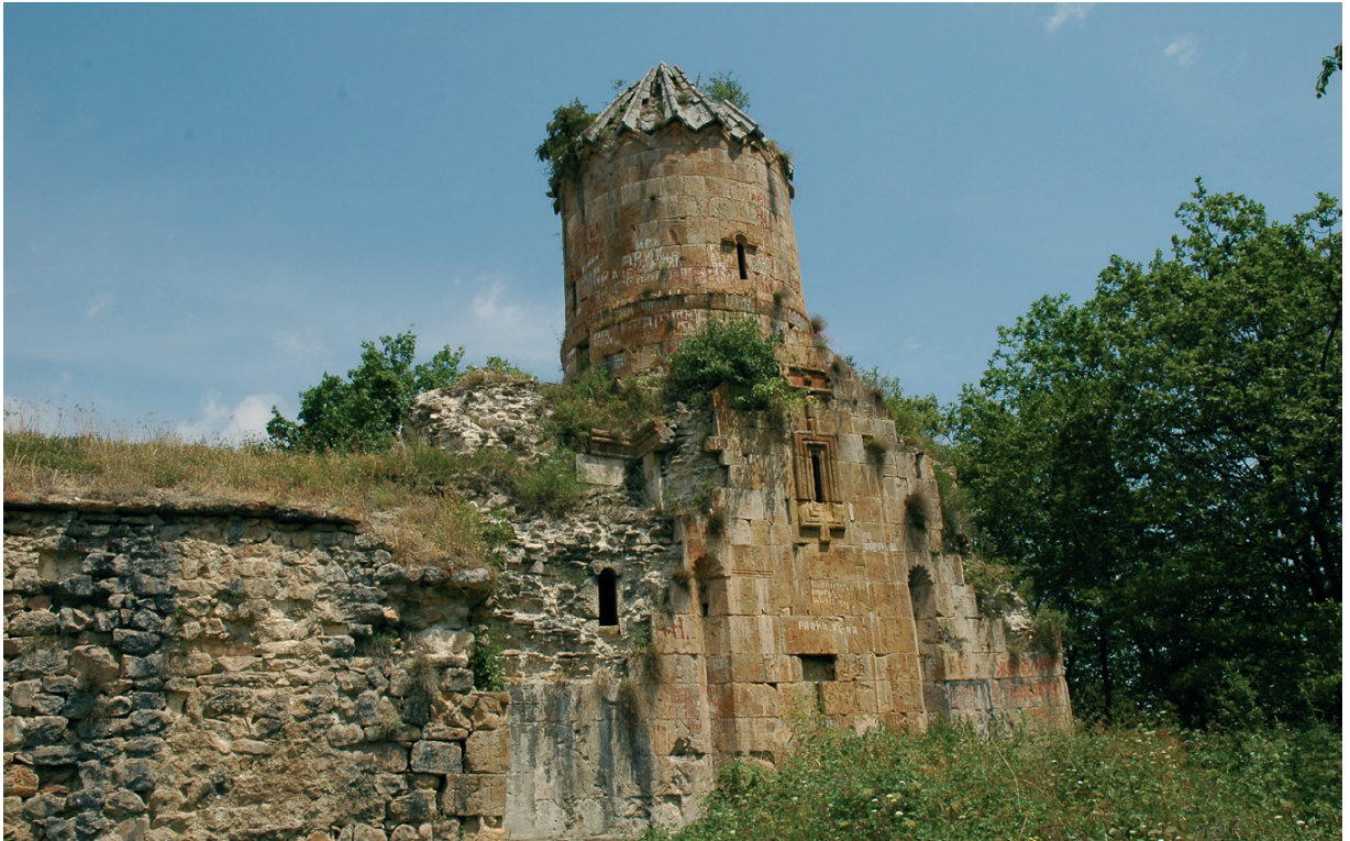
Նկ. 15 Գրչավանք: