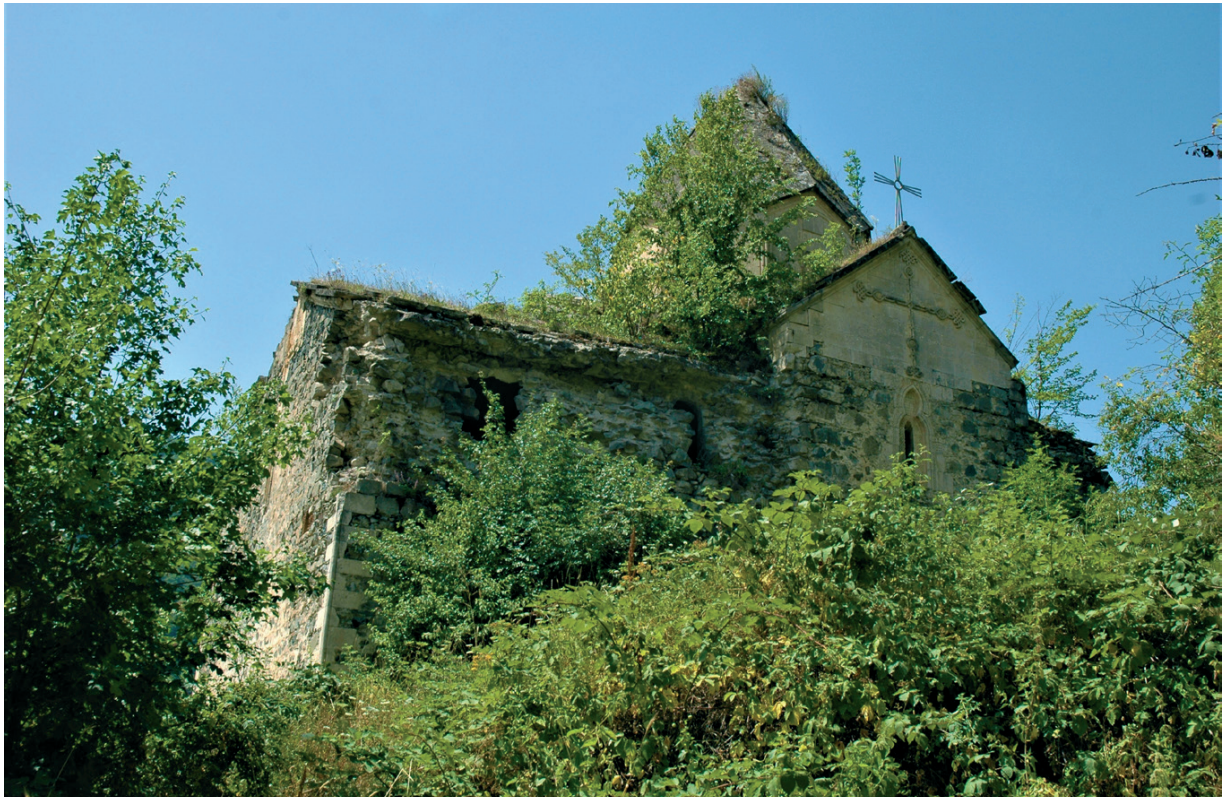
Նկ. 18 Երից մանկանց վանք: