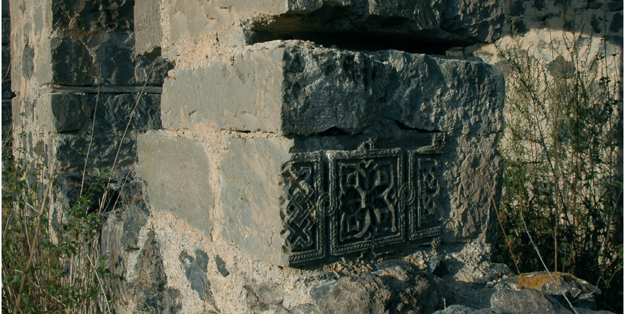
Նկ. 23 Ծարի սուրբ Սարգիս եկեղեցու բեկորատված քանդակազարդ քարերը Ծարի դպրոցի շենքում:

Բուն ադրբեջանական քաղաքականությունն ուներ գաղտնի՝ ոչ հրապարակային բաղկացուցիչ ևս, որի ավերիչ գործունեությունը հնարավոր եղավ վավերացնել ազատագրված շրջաններում: