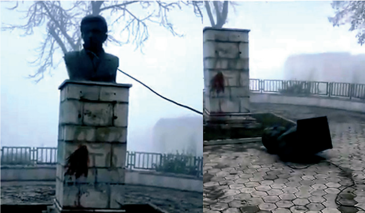
Նկ. 45 Շուշիում՝ ԽՍՀՄ պետական-քաղաքական գործիչ Հովհաննես (Իվան) Թևոսյանի կիսանդրին ոչնչացված:

Արցախի օկուպացված տարածքներում ադրբեջանցիներն առանձնակի վայրագություններ են կատարում Արցախյան ազատամարտին և դրա հերոսներին նվիրված հուշարձանների, հուշակոթողների և համալիրների նկատմամբ, օրինակ Շուշիում քանդվել է Հայոց ցեղասպանության զոհերի հիշատակին նվիրված հուշարձանը, որը տեղադրվել էր Արցախյան առաջին պատերազմից հետո և նվիրված էր նաև Հայրենական պատերազմի զոհերի հիշատակին (նկ. 40):