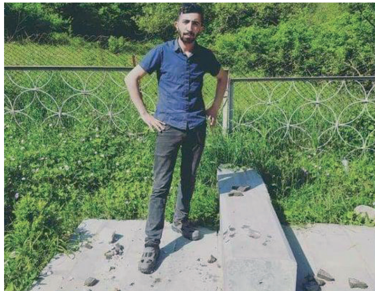
Նկ. 46 Հադրութի շրջանի Տումի գյուղի «Սիսեռ» աղբյուրի մոտ գտնվող հայ ազգային հերոս Թևան Ստեփանյանի կիսանդրին ավերված:

Հադրութի Ազոխ գյուղում ադրբեջանցիներն ավերել են Հայրենական Մեծ պատերազմի, Արցախյան առաջին պատերազմի և Հայոց ցեղասպանության զոհերի հիշատակին նվիրված հուշարձանները (նկ. 41), Հադրութի ազատամարտիկներին նվիրված հուշահամալիրը (նկ. 42), Որոտան քաղաքի (Կուրաթլու) Արցախյան առաջին ազատամարտին նվիրված խաչքարը (նկ. 43): Ոչնչացվել է Հադրութի շրջանի Մեծ Թաղեր գյուղում գտնվող ԽՍՀՄ ավիացիայի մարշալ Արմենակ Խանփերյանցի