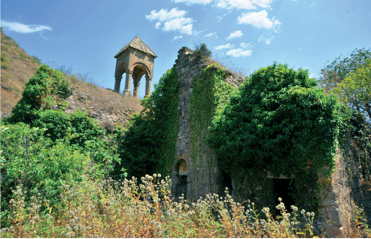
Նկ. 8 Եղիշա առաքյալի վանք: