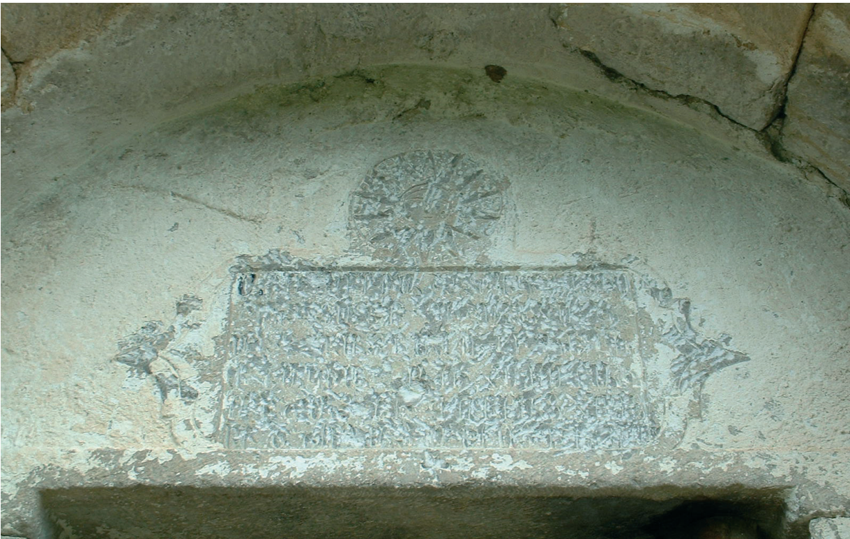
Նկ. 26 Ղայբալու գյուղի եկեղեցու արձանագրությունը՝ ջնջված: