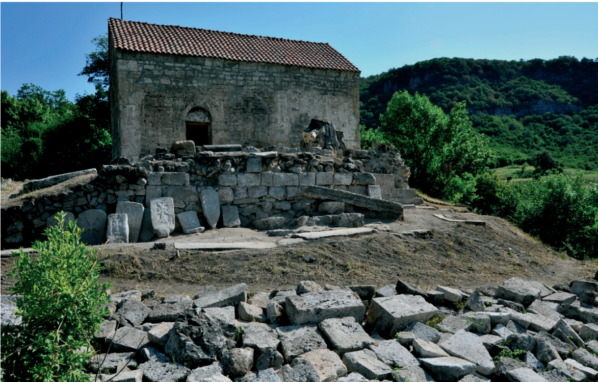
Նկ. 28 Վաճառի Սուրբ Սյրեփանոս վանք, ընդհանուր տեսքը պեղումներից հետո: