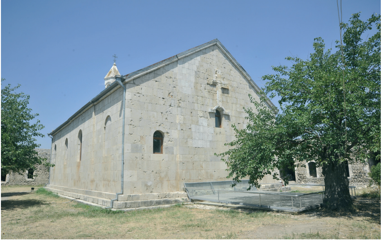
Նկ. 6 Անարասի վանք: