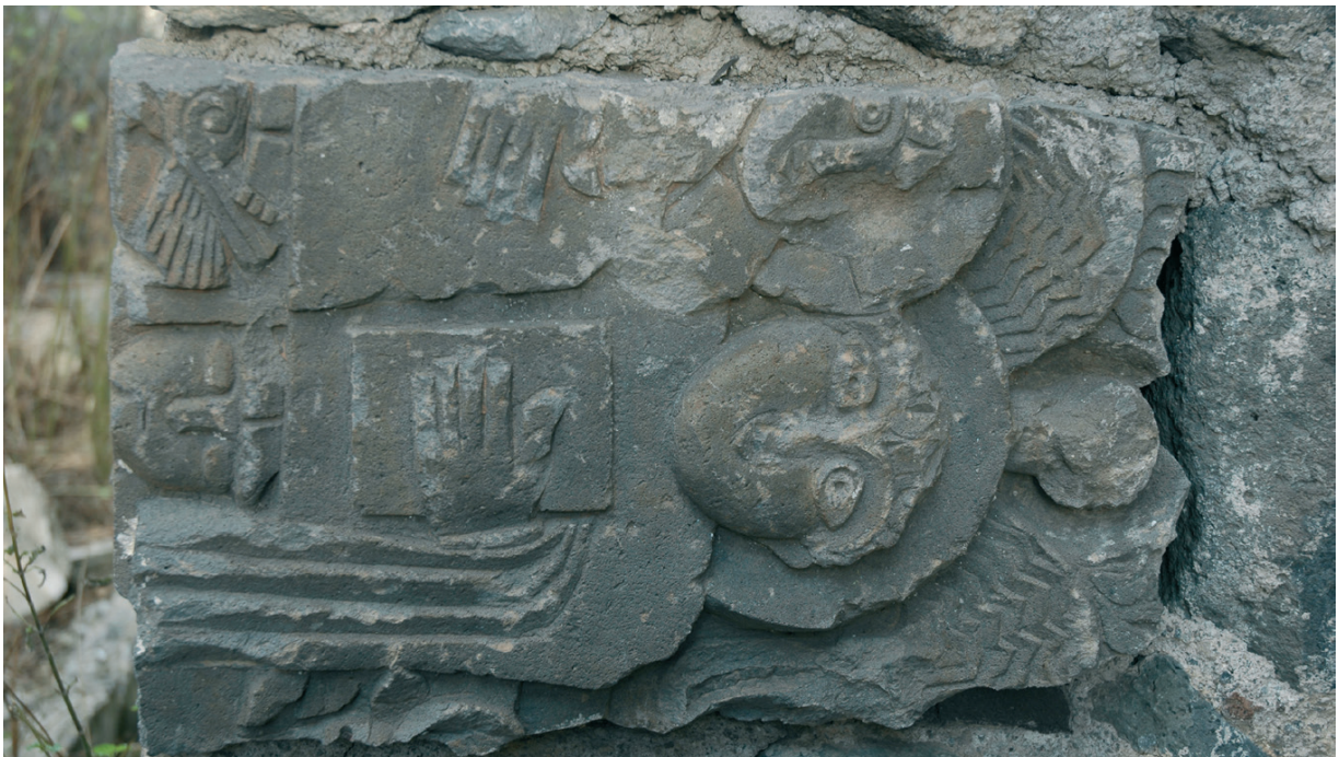
Նկ. 24 Ծարի սուրբ Սարգիս եկեղեցու բեկորատված քանդակազարդ քարերը Ծարի դպրոցի շենքում: