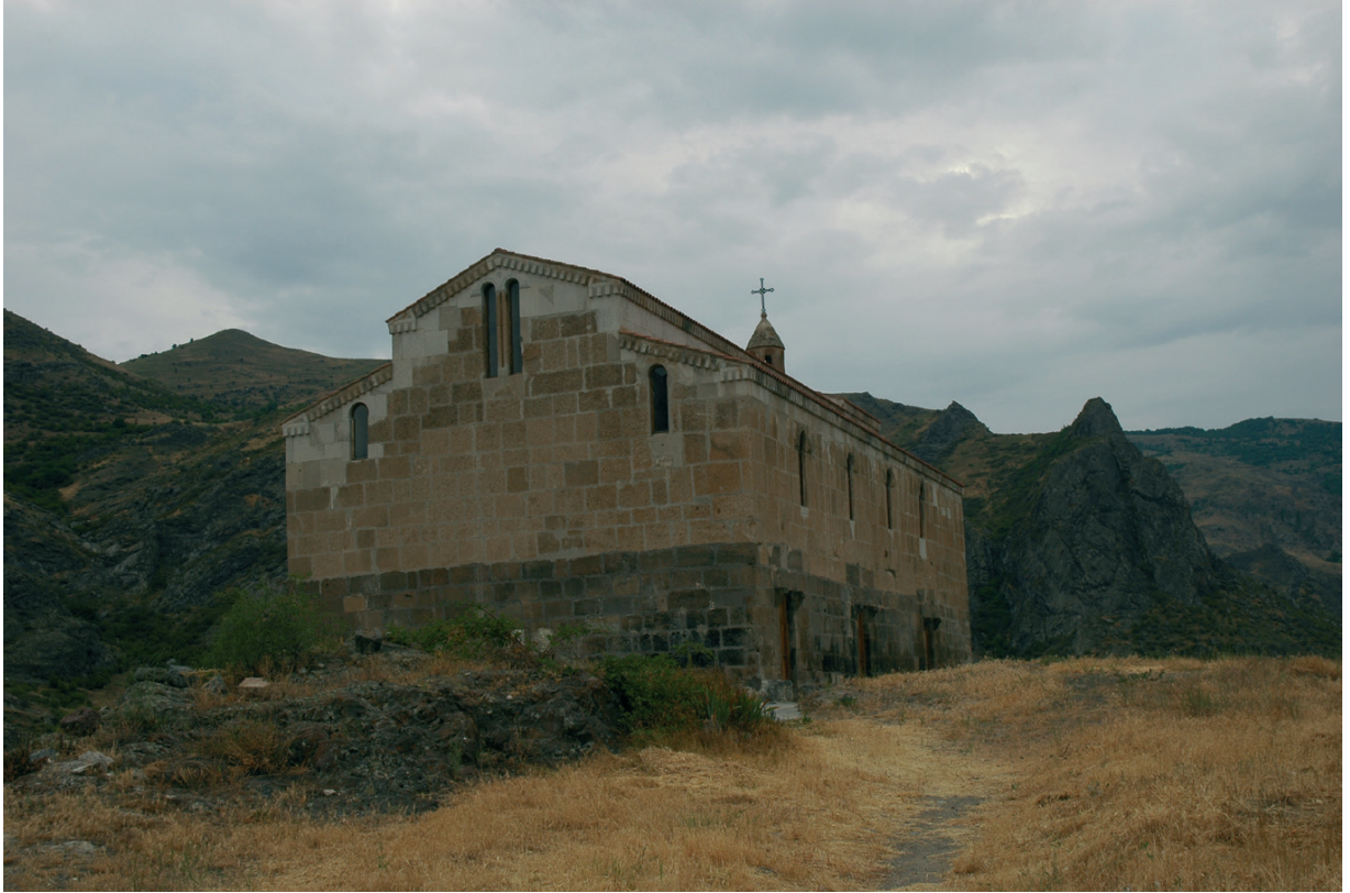
Նկ. 14 Ծիծեռնավանք: