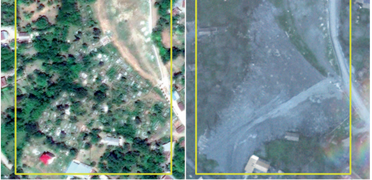
Նկ. 48 Հաղրութի շրջանի Մեծ Թաղեր գյուղի գերեզմանոցի ոչնչացումը: