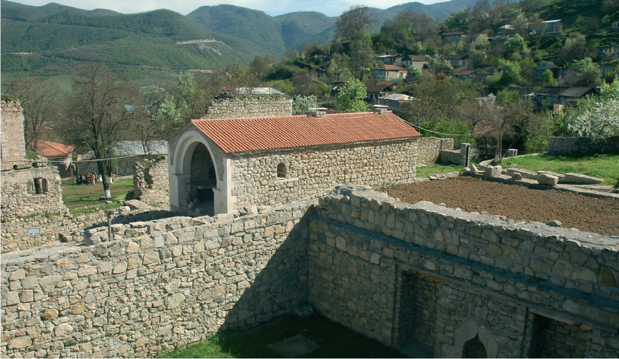
Նկ. 27 Տողի մելիքական ապարանքի ընդհանուր տեսքը պեղումներից և վերականգնումից հետո: