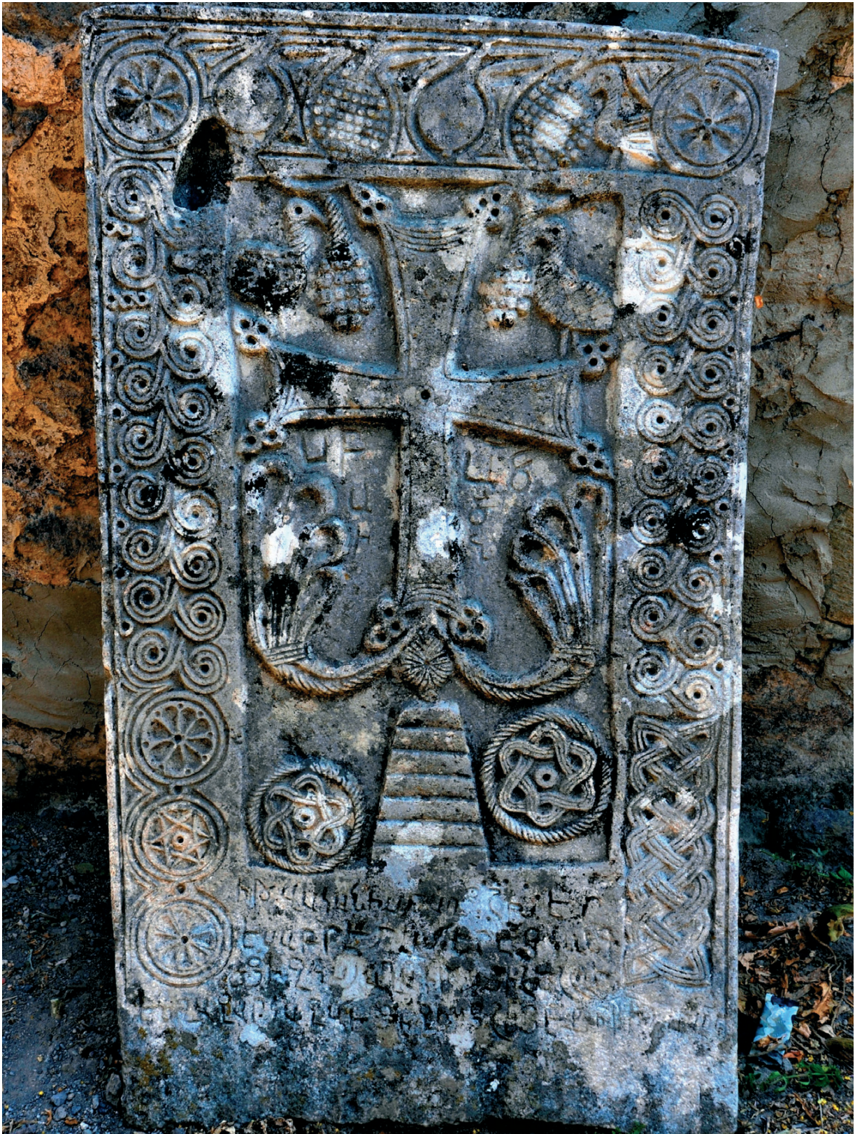
Նկ. 20 Ամարաս, խաչքար Սուրբ Աստվածածին, 1091 թվական, Ղազար կազմող: