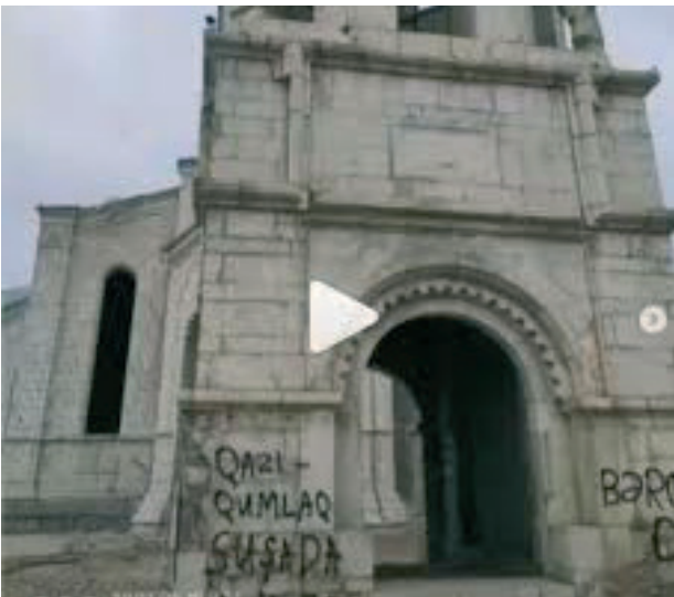
Նկ. 36 Շուշիի Սուրբ Ամենափրկիչ Ղազանչեցոց եկեղեցին՝ խոշտանգված:

Հրադադարի հայտարարումից ի վեր ոչնչացվել են Մեխակավանի (Ջերբախի) Ջորավար Սբ. Աստվածածին եկեղեցին (նկ. 37), նույն շրջանի Շյուքյուրբեյլի գյուղում տուֆե խաչային հորինվածքով հուշարձանը (նկ. 38), Հադրութի Առաքել գյուղի խաչքարը (նկ. 39):