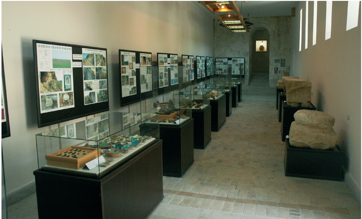
Նկ. 31 Տղարանակերտի հնագիտական թանգարանի ցուցասրահներից մեկը:

Կարելի է փաստել, որ Արցախի կրթա-մշակութային կյանքը դանդաղ քայլերով կայունանում էր և որոշակի հիմք էր ստեղծում զարգացման համար, ինչն ընդհատվեց 2020 թվականին սկսված պատերազմի արդյունքում: