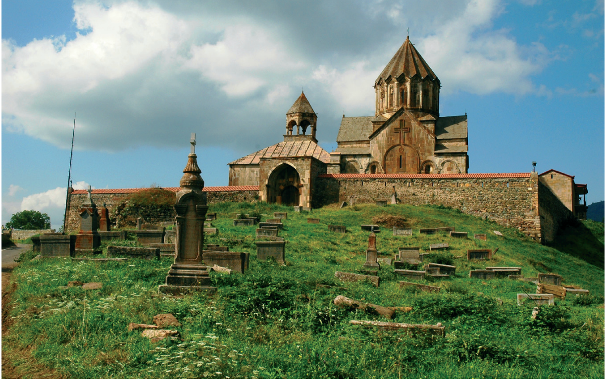
Նկ. 10 Գանձասարի վանք: