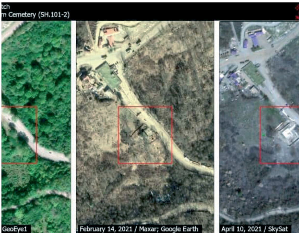
Նկ. 47 Շուշիի պատմական գերեզմանոցի ոչնչացումը:

կիսանդրին (նկ. 44), Շուշիում՝ ԽՍՀՄ պետական-քաղաքական գործիչ Հովհաննես (Իվան) Թևոսյանի կիսանդրին (նկ. 45), ավերվել է Հադրութի շրջանի Տումի գյուղի «Սիսեռ» աղբյուրի մոտ գտնվող հայ ազգային հերոս Թևան Ստեփանյանի կիսանդրին (նկ. 46): Վանդալիզմի գործողությունների է ենթարկվել Հայաստանի և Արցախի ազգային հերոս, սպարապետ Վազգեն Սարգսյանի արձանը: Ավերվել են Թալիշ, Քարին տակ, Մոխրենես, Զարդանաշեն, Ավետարանոց գյուղերի Արցախյան ազատամարտին նվիրված հուշակոթողները: