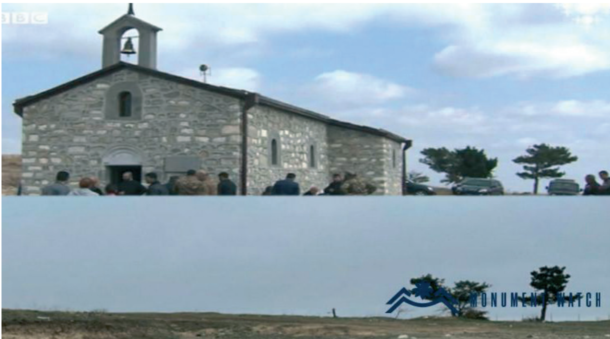
Նկ. 37 Մեխակավանի (Ջերբախի) Ջորավար Սբ. Աստվածածին եկեղեցին ամբողջովին ոչնչացված: