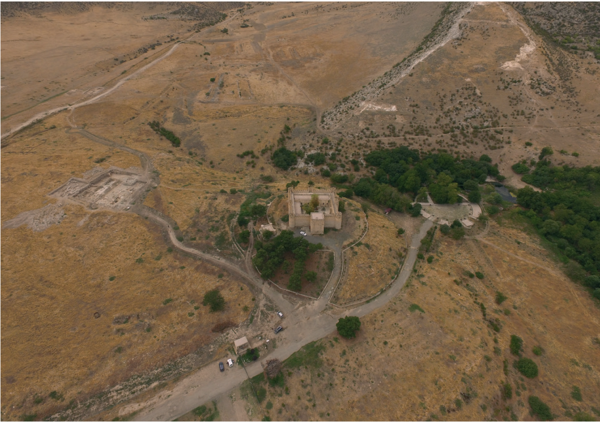
Նկ. 4 Արցախի Տիգրանակերտ, ընդհանուր տեսքը: