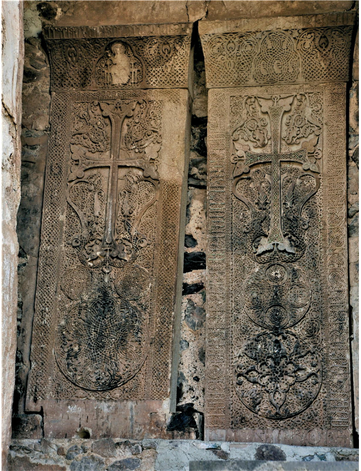
Նկ. 21 Դաղիվանք, խաչքարեր, 1283 թվական: