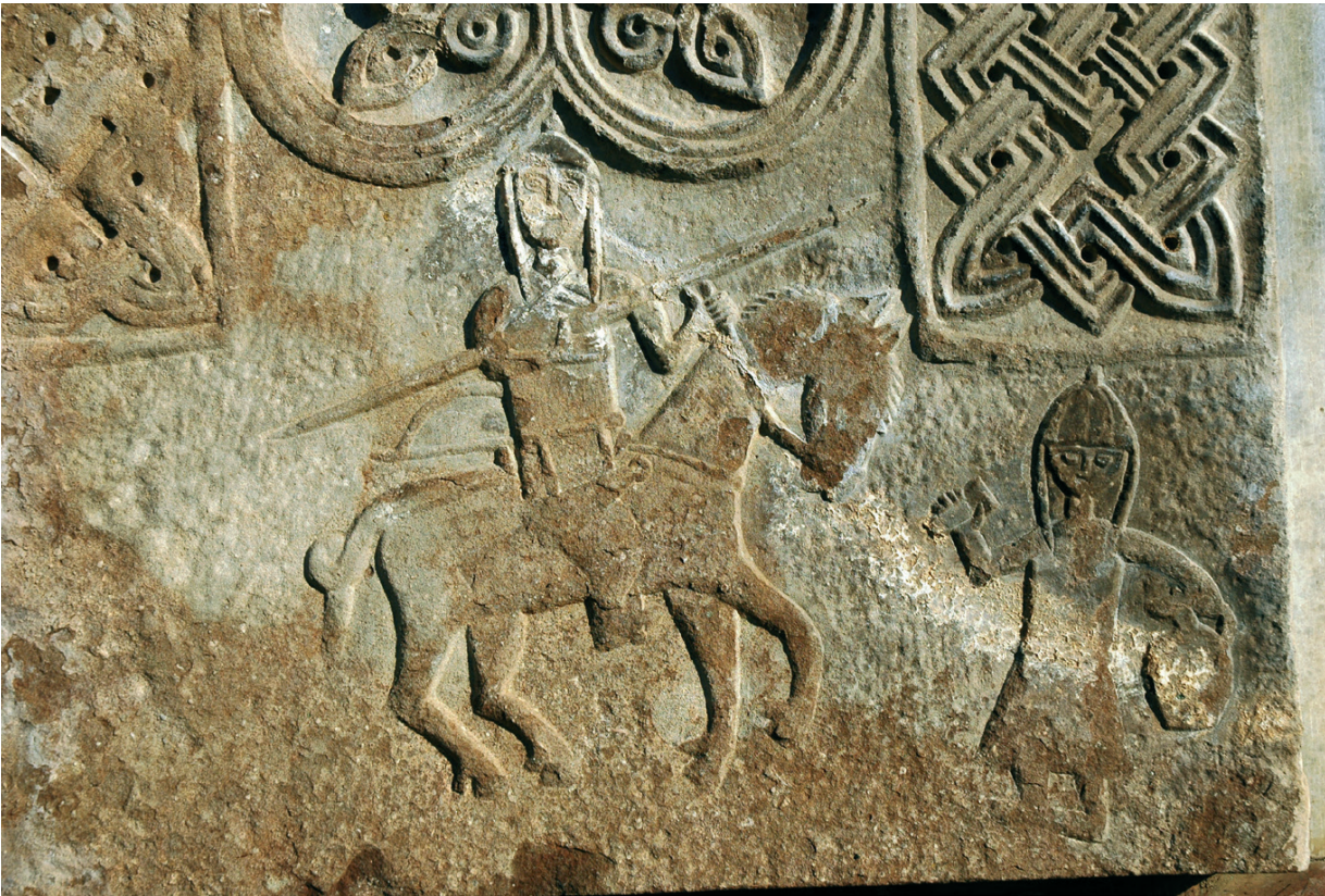
Նկ. 22 Պառավաձոր, խաչքարային պատկերաքանդակ, 12-րդ դարի վերջ:

Արցախի նյութական ժառանգության գերակշիռ մասն անշուշտ կազմում են քրիստոնեական հուշարձանները, որնցից մի քանի տասնյակը համաշխարհային գիտական և մշակութային հանրությանը քաջ հայտնի նշանային հուշարձաններն են՝ Ամարասի վանք (նկ. 6), Վանքասարի եկեղեցի (նկ. 7), Եղիշա առաքյալի վանք (նկ. 8), Դադիվանք (նկ. 9), Գանձասարի վանք (նկ. 10), Հանդաբերդի վանք (նկ. 11), Չարեքտարի վանք (նկ. 12), Չափնիի վանք (նկ. 13), Ծիծեռնավանք (նկ. 14), Կատարո վանք, Գտչավանք (նկ. 15), Հոռեկավանք (նկ. 16), Սպիտակ խաչ վանք (նկ. 17), Երից մանկանց վանք (նկ. 18), Խադարի վանք (նկ. 19), հազարավոր խաչքարեր (նկ. 20-22), տապանաքարեր և այլն: