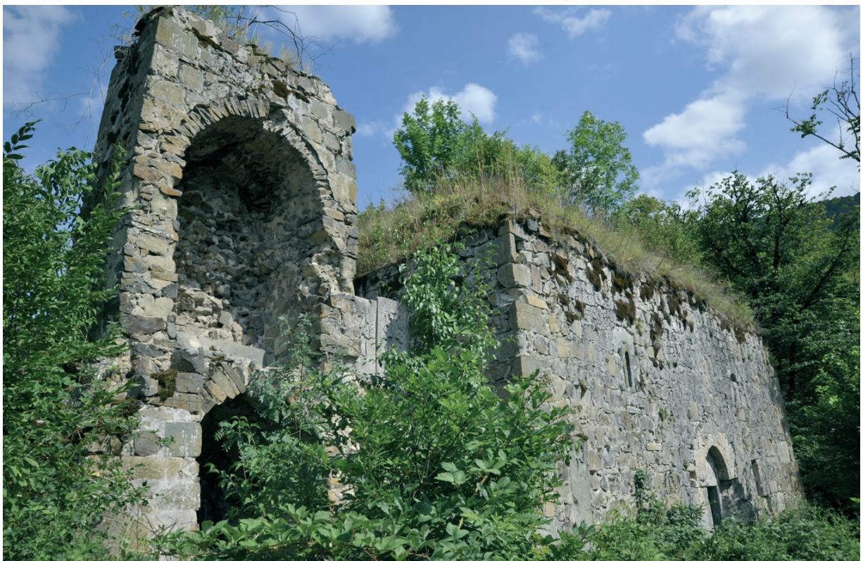
Նկ. 19 Խաղարի վանք: