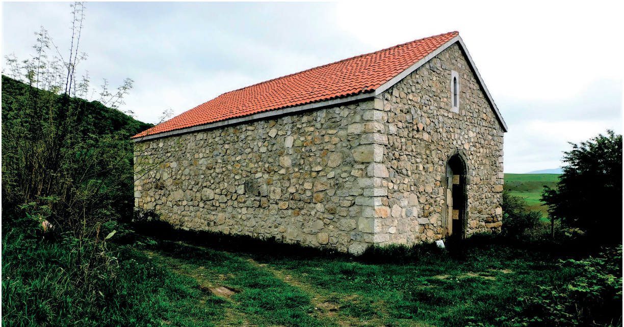
Նկ. 29 Փիրումաշենի եկեղեցի, ըդհանուր տեսքը վերականգնումից հետո:

Աշխատանքներ են տարվել Կարմրակուճ, Քարագլուխ, Ճանկաթաղ, Կարմիր գյուղ և այլ բնակավայրերի հուշարձաններում: Հադրութի շրջանի Քարագլուխ գյուղում կառուցվել է նոր եկեղեցի, մասամբ վերականգնվել է համայնքի հին եկեղեցին: Վերականգնման աշխատանքներ են իրականացվել Գտչավանքում, Դադիվանքում, Ամարասում, Պոկեսբերք վանքում, Կուսանաց վանքում, Փիրումաշեն եկեղեցում (նկ. 29), Դիզափայտի Կատարո վանքում: Ամբողջովին վերականգնվել է Շուշիի Գոհար աղայի մզկիթը (նկ. 30):