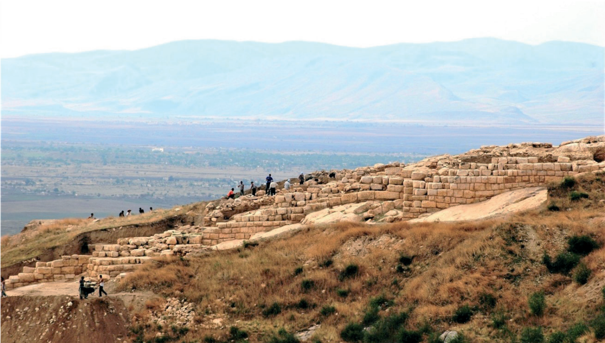
Նկ. 5 Արցախի Տիգրանակերտ, ամրացված թաղամաս, հարված հյուսիսային պարսպապատից: