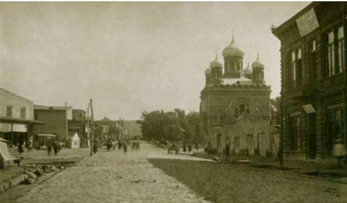
Սբ Աննա՝ Նիկողայան ռուսական եկեղեցին Բերդի, այժմ՝ Վ. Սարգսյանի փողոցում, 1920-ական թթ.