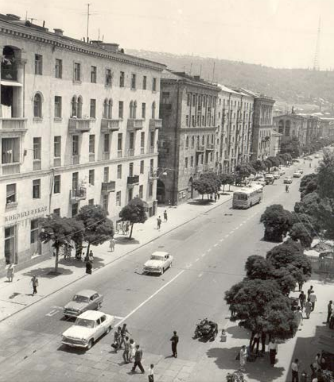
Տեսարան Թումանյան փողոցից, 1967 թ.