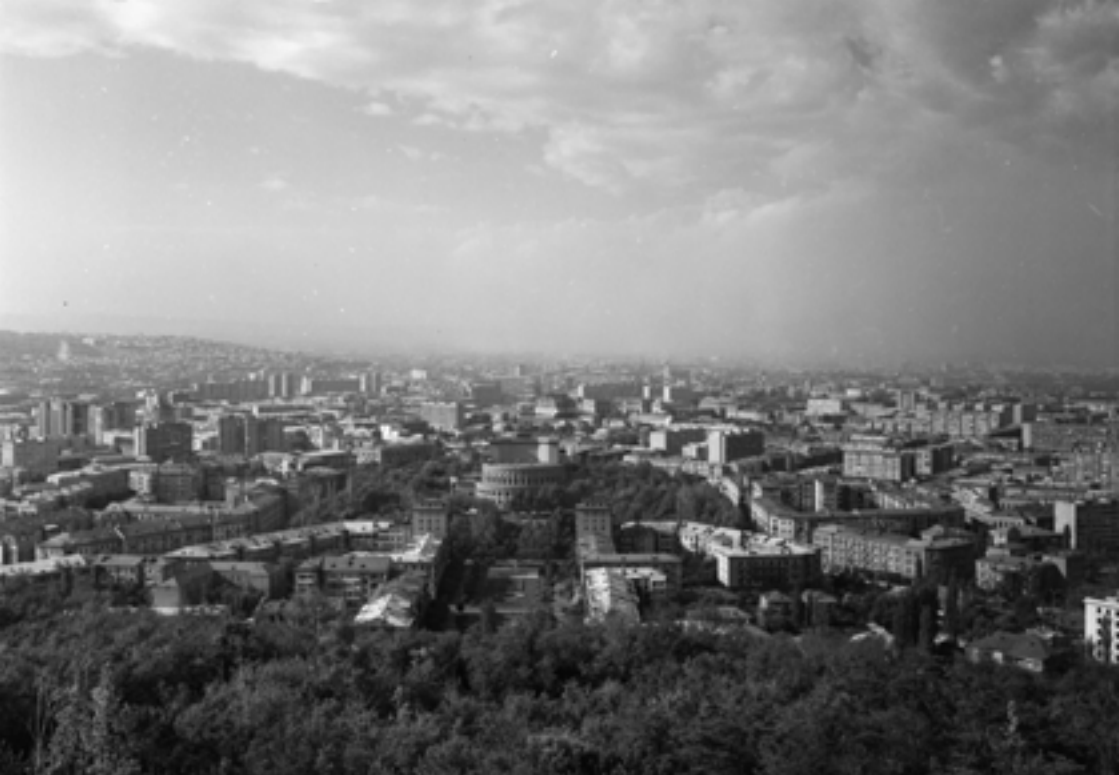
Երևանի ընդհանուր տեսարան, 1974 թ.