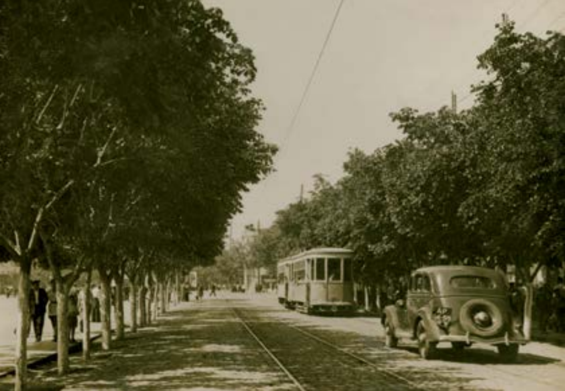
Արբյան փողոցի սկզբնամասը, 1921 թ.