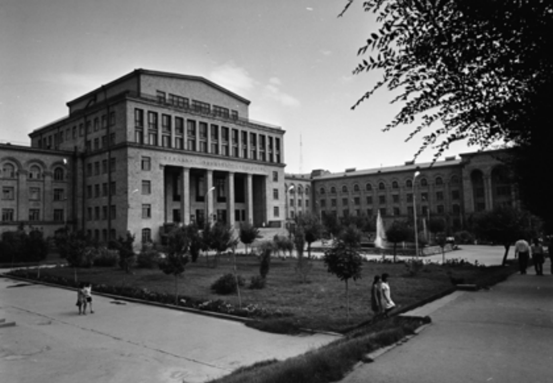
Երևանի պետական լսարանը, 1970 թ.