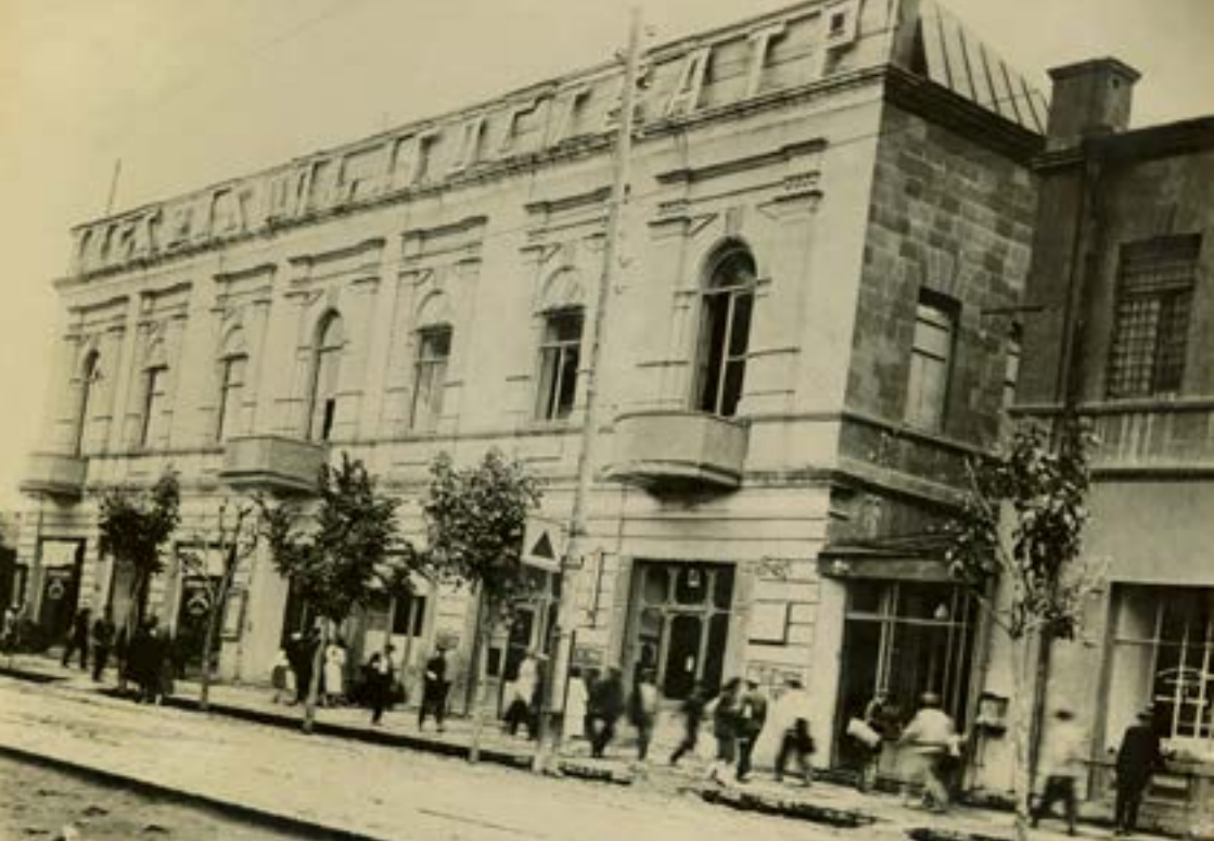
Պետ. քատրոնի շենքը, 1920 թ.

«Գրանդ Հոթել» հյուրանոցը Կրեպոստնայա, այժմ՝ Վ. Սարգսյանի փողոցում, 1920-ական թթ.