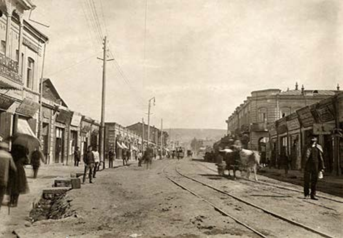
Աստաֆյան փողոցը, 1920 թ.