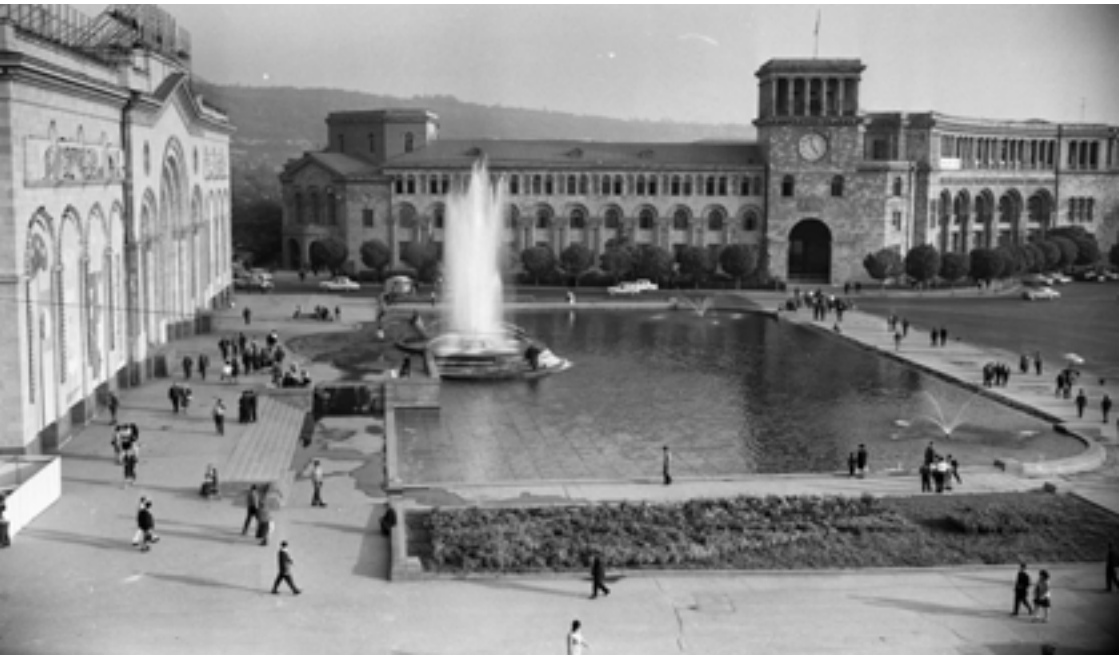
Երևանի Լենինի անվան հրապարակը, 1968 թ.