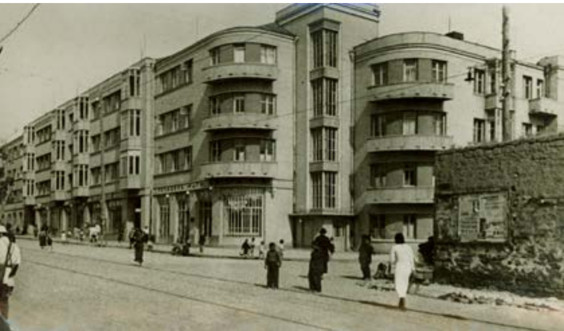
Ալավերդյան-Կնունյանց փողոցների խաչմերուկ, 1937 թ.