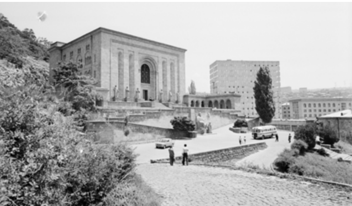
Մատենադարան, 1975 թ.