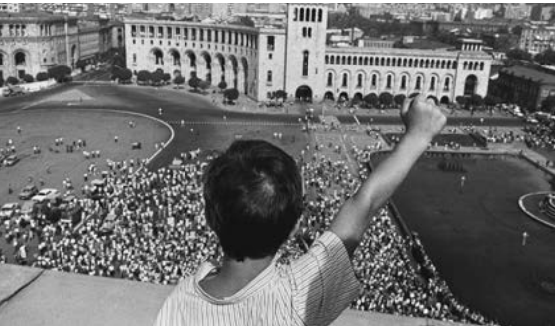
Կառավարության շենքին եռագույն դրոշի բարձրացման արարողություն