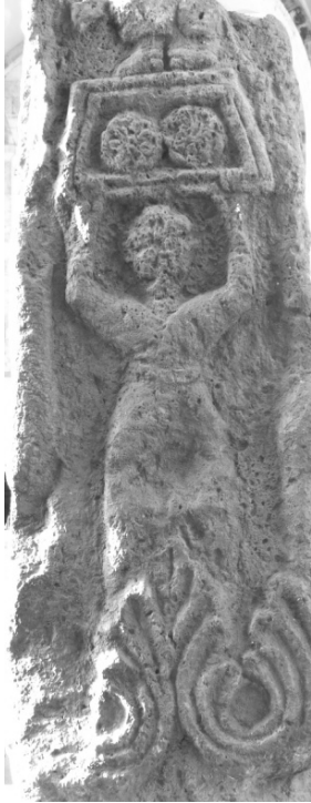
Նկ. 3. Կոթողի երրորդ նիստը

Այն, որ կոթողի երկրորդ կողին պատկերվածը ննջեցյալ է, հասկացվում է նրա ոտքերի ներքևում ականթատերևների մեջ բացված ծաղիկով, որի բոլորուն տեսքը նման է հավերժության խորհրդանշանին, ինչն ակնարկում է հանգուցյալի հարության և դրախտային հավիտենական կյանքին արժանանալու մասին: