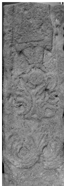
Նկ. 2. Կոթողի երկրորդ նիստը

Կոթողի երկրորդ նիստին, ըստ Բ. Առաքելյանի՝ «ներքևում քանդակված է նույնալիսի ականթատերն կենտրոնական փնջով, քիչ վերևում դարձյալ ականթատերներ փոքր ինչ այլ կերպավորումով, կենտրոնում ցողուն, վրան բացված ծաղիկը...: Վերևում կանգնած է մի ֆիգուրա en face, որից պահ-