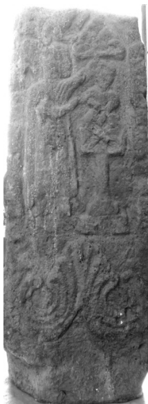
Նկ. 1. Աբրահամի զոհաբերությունը

Աբրահամը հագել է մինչեւ ոլոքները հասնող բաճկոն եւ ուսերին ձգել երկար, բիզանդական կոշուած տոգայ, որի վերին քղանցքները կախուած են ուսերից դեպի կուրծքը... Նորա գլխին եւս մի բան պիտի լինէր, որ եղծուած է, հաւանօրէն հրեշտակը, կամ Տիրոջ աջը, որ ցույց է տալիս ծառից կախուած խոյր: Խմբանկարի տակ սովորական ականթն է, եռատերեւ, կողերի տերեւների կէտը միւս երեսներին անցած» 1 :