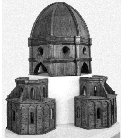
Նկ. 9. Սանտա Մարիա դել Ֆիորե եկեղեցու մանրակերտ*

Հնդհանրապես, փոքրիկ մոզեյների օրինակներ կան համաշխարային արվեստում: Քրիստինա Մարանչին որպես օրինակ նշում է Արևմտյան Մեքսիկայից հայտնաբերված և տան տեսք ունեցող մոզեյ, որը պահվում է Նյու Յորքի Մետրոպոլիտան թանգարում ու թվագրում է մ.թ.ա. 100 - մ.թ. 200 թթ. (նկ. 8) 21 : Եկեղեցու մանրակերտի հանդիպում ենք նաև իտալական արվեստում: Նշանավոր ճարտարապետ Ֆիլիպպո Բրունելեսկին ստեղծել է Սանտա Մարիա դել Ֆիորե եկեղեցու մոզեյը, որը պահվում է Ֆլորենցիայում: Այն պատրաստված է փայտից և թվագրվում է XV դարով (նկ. 9): Բյուզանդական արվեստում նույնպես հանդիպում ենք տաճարիկի օրի-