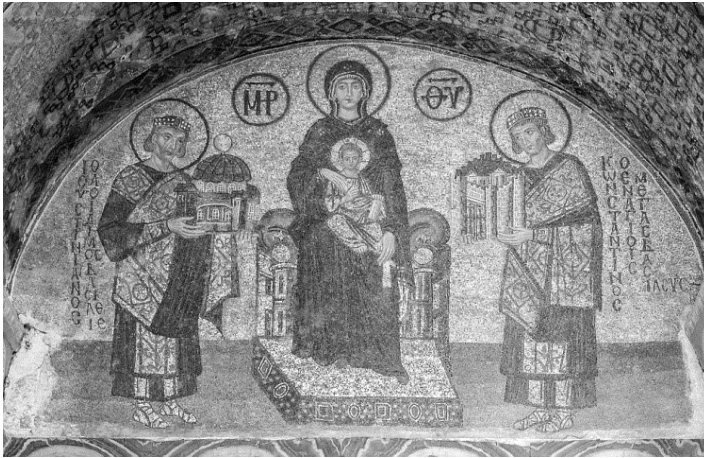
Նկ. 10. Խճանկար, Այա Սոֆիա տաճար**

նակների: Մասնավորապես, Սուրբ Սոֆիա եկեղեցու խճանկարում (նկ. 10) 22 : Այստեղ տիրամայրը մանկան հետ նստած է գահին: Մարիամի ձախ կողմում Կոնստանդին կայսրն է իր ծիսական հագուստով, և Մարիամին է ներկայացնում Կոստանդնուպոլիս քաղաքի