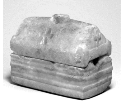
Նկ. 11. Սարկոֆագի տեսով մասանց պահարան (բյուզանդական արվեստ, 400-600 թթ.)***

եղած պատմական նյութի և տաճարիկների օրինակների ուսումնասիրությունը, նրանցում եղած խորշերի առկայությունը, մետաղե դռնակների համար արված անցքերը, համաշխարհային արվեստում փոքրիկ մոզեյների առկայությունը, բյուզանդական արվեստում մասունքների համար պահպան հանդիսացող սարկոֆագների գոյությունը որոշակի հիմք են