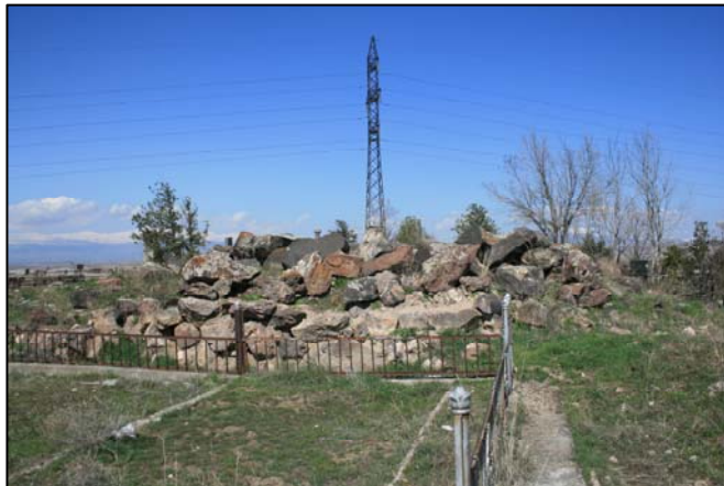
Նկ. 4. Մերձավան 1

Պեղումներ. Աշտարակատիպ շինությունների առաջին պեղումները կարելի է համարել Ե. Բայբուրտյանի կողմից ներկայիս Երևան քաղաքի Մուխաննաթ թափա հնավայրի «բոլորածև սրբարանը»: Այն բնակավայրից հեռու է, զբաղեցրել է բլրի գագաթը և պահպանված լուսանկարում ու հատակագծում նման է մեր խնդրո առարկա շինություններին 37 : Սակայն թվագրությամբ ավելի վաղ՝ Ք.ա. 3000 թվականին է վերաբերում Մոխրաբլուր հնավայրում հայտնաբերված տաճարը՝ բաղկացած տաճարական քարաշեն աշտարակից (տուֆ և բազալտ քարերով) և նրան կից գտնվող ոչ