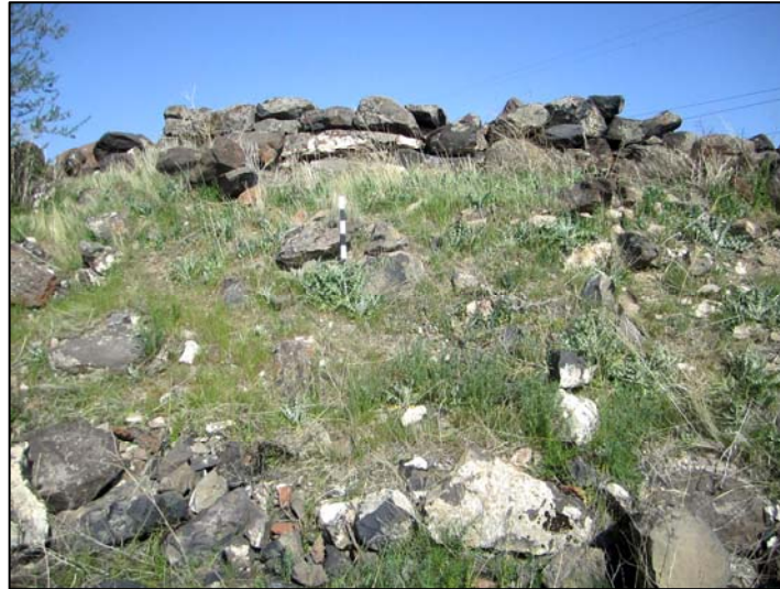
Նկ. 2. Ուլատիտիկ