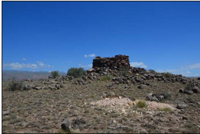
Նկ. 3. Աղավնատուն 1 «Օյոտզ», լուսանկարը՝ Լ. Մկրտչյան