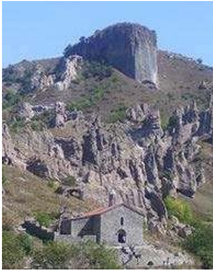
Գորիս-Կյորես գյուղ. Ս. Հովհաննես եկեղեցի (1776 թ.)