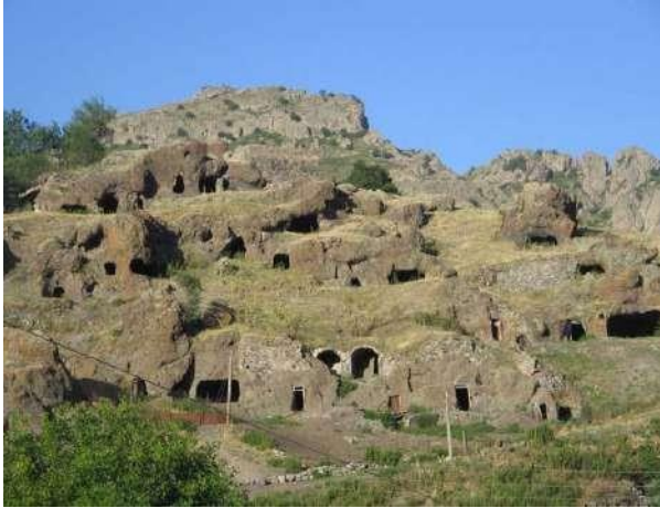
Հին Գորիս-Վերին Շեն գյուղի Չոր թաղամասը

Հաբանդ-Չագեձոր գավառի հինավուրց գյուղերից մեկին հերթական անգամ բաժին ընկած այդ դառն ճակատագիրն աղետաբեր եղավ նրա համար: Անպաշտպան ժողովուրդն այս արհավիրքի դեմ պայքարելու ոչ մի միջոց չունեւր. անկարող էր հակահարված տալ թշնամու գերակշիռ բանակին: Այս աղետից հետո երբեմնի բազմամարդ 1 ու նշանավոր գյուղը տնական ժամանակով կորցրեց իր վաղեմի փայլը և վերածվեց ավերակ գյուղատեղիի: Այդ են փաստում