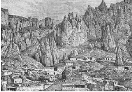
Գորիս-Կյորես գյուղի համայնապատկերը. XIX դարասկիզբ: Նեղ. Է. Ռեկյու.