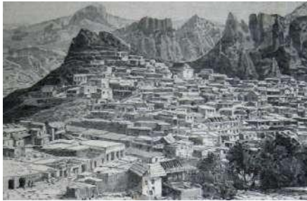
Գորիս-Կյորես գյուղի համայնապատկերը. 1890 թ.: Նեղ. ֆրանսիացի ազգագրագետ Բ. Շանթթ

Վերոբերյալ դեպքերի վավերականությունը հավաստվում է տեղագիր-հեղինակների հիշատակումներով 2 : Այսպես, 1841 թ.