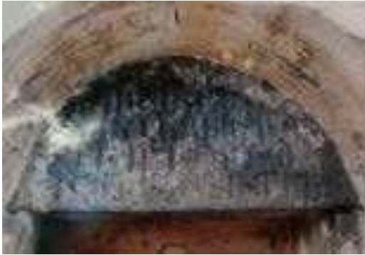
Ս. Հովհաննես Եկեղեցու շինարարական արձանագրությունը

«ՏԵՍԱՆԱԿ ԵՆԵԿԵՂԵՑԻՄ ՊՍՂՈՐԻ ՈՐԴԻ ՍԵԼԻՔ/ՈՂՆԱԽՆ: ԹՎԼԻՆ ՈՄԻԵ (1776)» 1 :