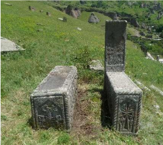
Մեծ Մելիք-Օհանի (ձախից) և նրա որդու՝ Բաղրի տապանաքարերը «Մելիքների» դամբարան մատուռից ներքև

ԱԿՑՈՒՑ 1 : Հայտնի է, որ շատ դեպքերում արձանագրություններում կիրառվել են բարբառային ձևեր ունեցող մի շարք անուններ ու բառեր: Նկատվում են նաև գրչության որոշ օրինաչափ շեղումներ և հնչունային հապավումներ: Մյուսնիքում, մասնավորապես Գորիսի բարբառում, նման բառ ու բառաձև չկա, ուստի, որքանով կարող ենք դատել արձանագրության բովանդակությունից, իբրև գուտ նախնական վարկած, կարելի է ենթադրել, որ ԳԱԿՑՈՒՐՑ ձևը կանգնեցրի (բրբ. կանգնեցրեցի ) բայաձևերի սխալ գործածության հետևանք է: