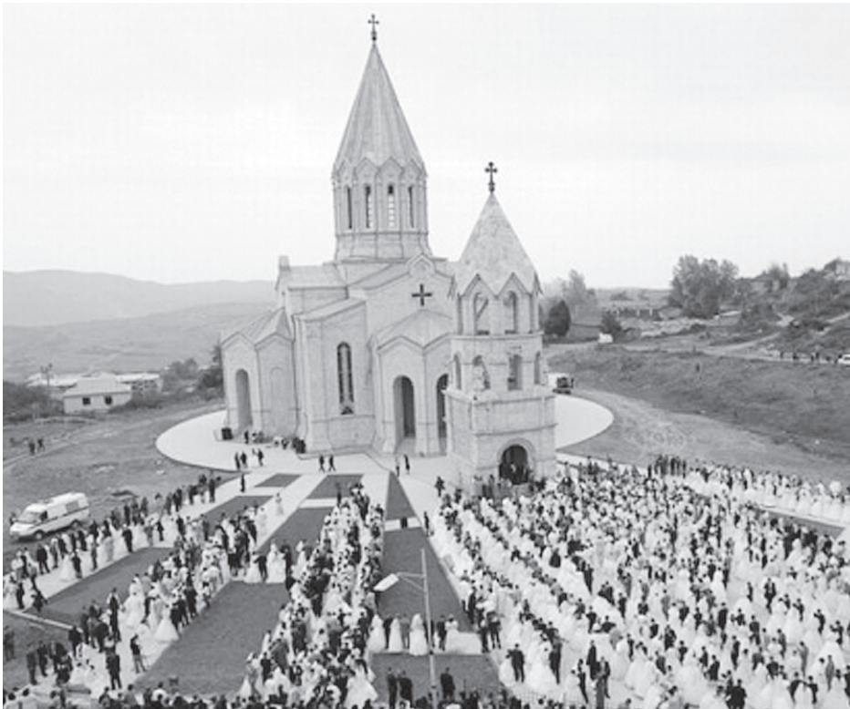
Вінчання у церкві в м. Шуша за участі 700 пар