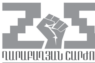
Емблема 25-річчя Карабахського руху

«Пора!» – з цієї команди Арсен починав свій день, який майже всуціль присвячував боротьбі з німеччю й подоланню самого себе. Розбите тіло затято опиралося пробудженню, важкі повіки ніяк не хотіли розлипатися, та сила волі щораз перемагала.