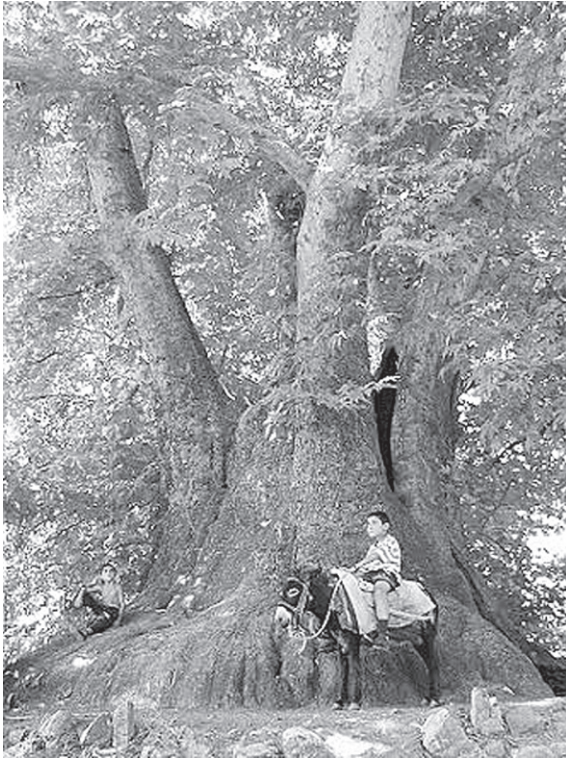
2000 – літній платан

– Аршак-даї*, мерщій кидай усе – азери в село увірвалися... Усі наші подалися геть, одні ми лишилися!..