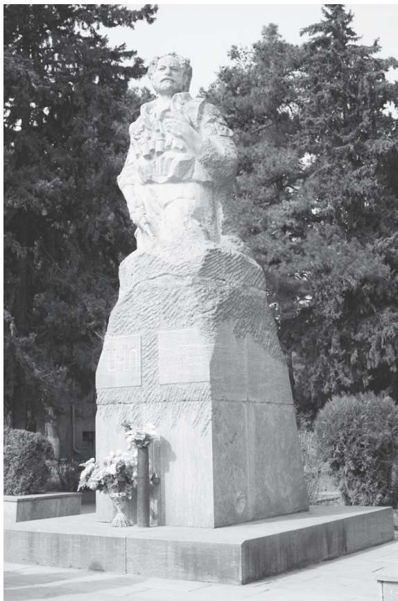
Пам'ятник легендарному герою війни Монте Мелконяну