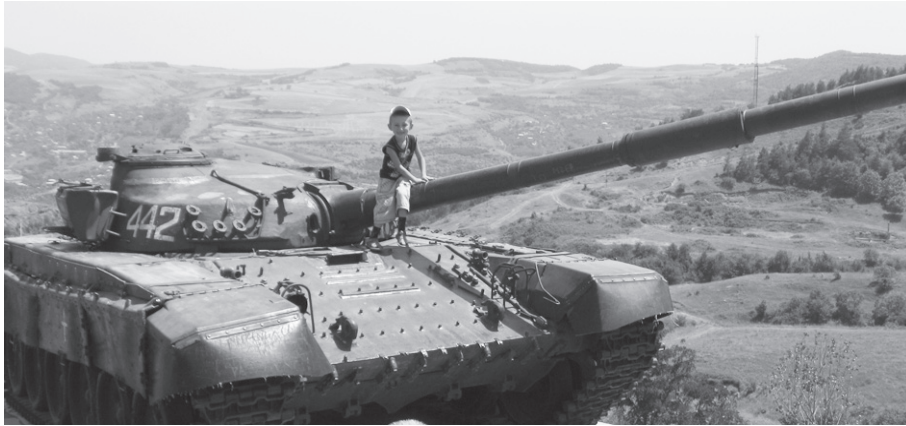
Війна закінчилась. Хлопчик на танку-пам'ятнику