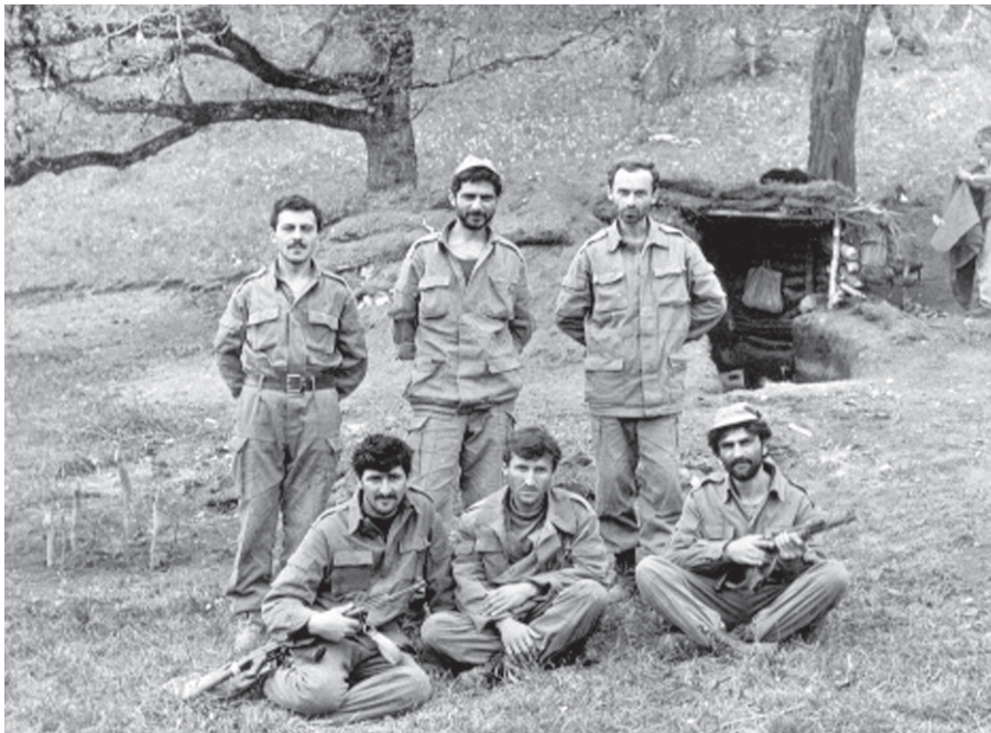
На гірській варті

У глибоких зморшках, що порізали кожен сантиметр смаглявого обличчя цього врівноваженого і ввічливого воєначальника, вгадувалися сліди драматичних і героїчних подій, безпосереднім учасником яких він був. І тому його слова вселяли особливу довіру.