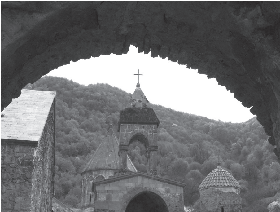
Старовинний монастир Дадиванк