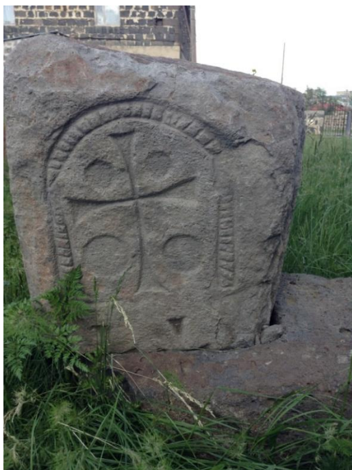
Նկար 3. Խաչքար (IX-X դդ.)