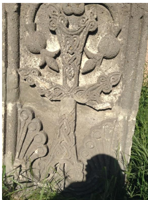
Նկար 4. Խաչքար (XI-XII դդ.)