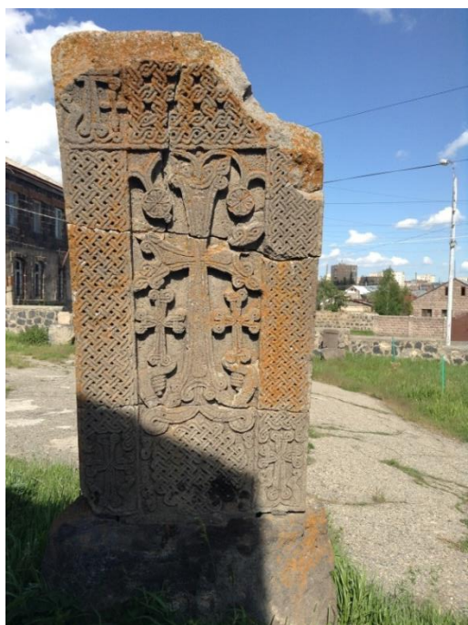
Նկար 5. Խաչքար (XII-XIV դդ.)