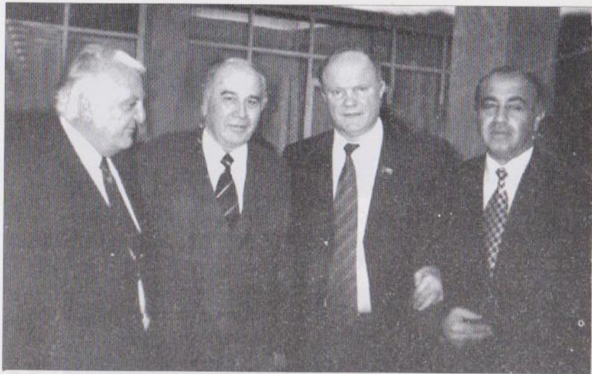
Աջից՝ ՀԿԿ Գլխավորի ֆաղկոմի առաջին ֆարսուղար Յու. Մանուկյանի, ՌԴ կոմկուսի նախագահ Գ.Ջյուզանովի, ՀԿԿ առաջին ֆարսուղար Ռ. Թովմասյանի հետ