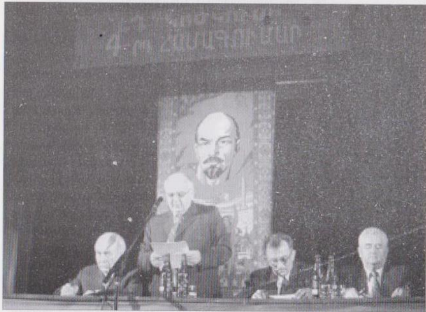
ԼՂ կոնկուսի 4-րդ համագումարի բացումը