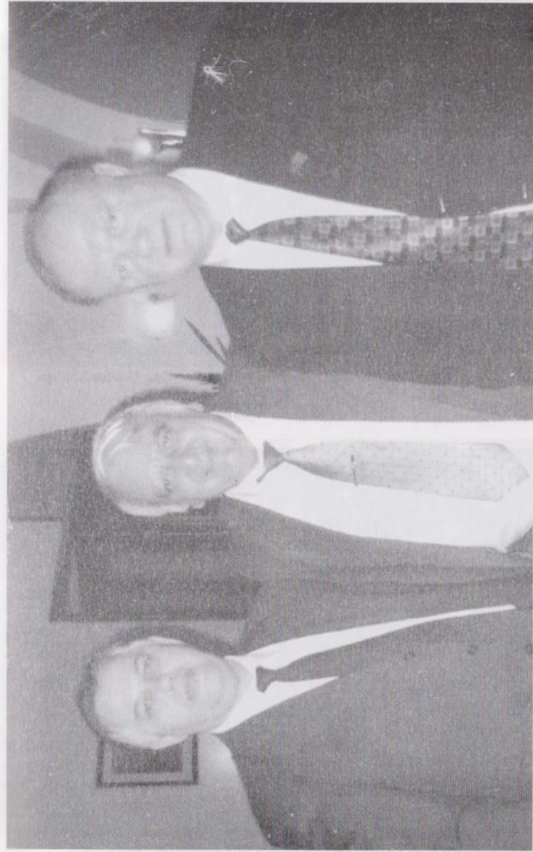
Աջից՝ Ռ.Ղ. կոմկուսի առաջին ֆուրսողար Գ. Չլուզանովի եւ ձախից՝ Ուկրաինայի կոմկուսի առաջին ֆուրսողար Դ. Միսնինցիյի հետ: