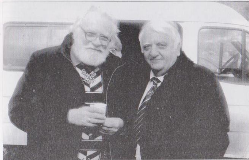
Արցախի անճնվեր բարեկամ, ռուս հանրահայտ գրող, հրատարակախոս Ա. Նույկինի հետ