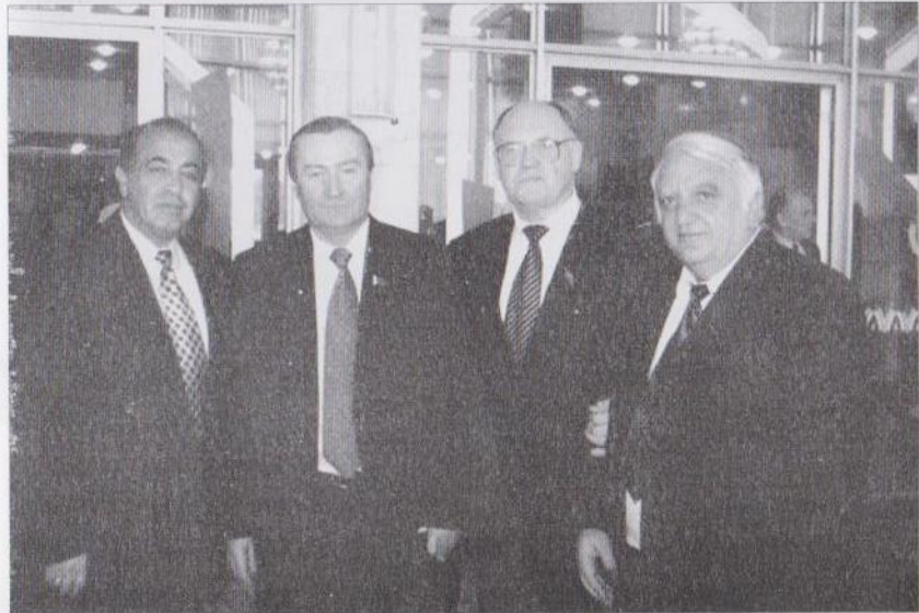
ՌԴ ղեկավարման մի խումբ ղազաճաճաճորճերի հետ