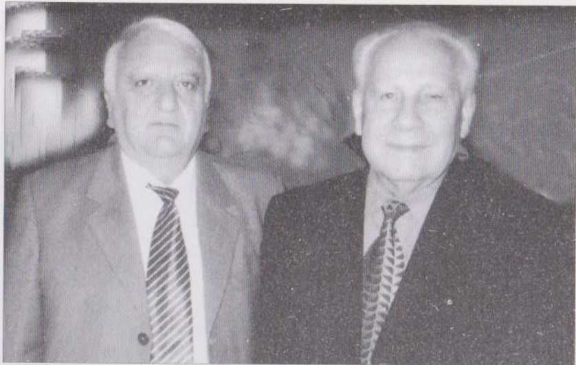
ԽՍՀՄ Գերագույն Խորհրդի նախագահ Ա. Լուկյանովի հետ