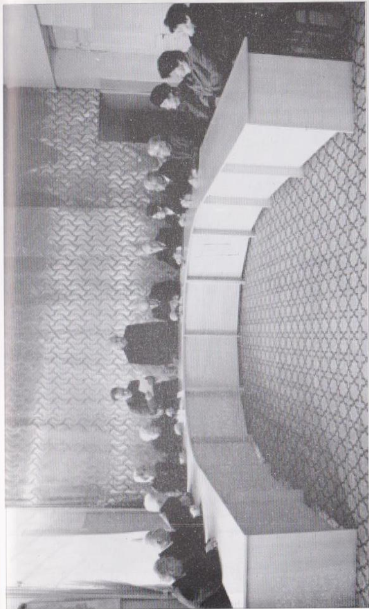
Մեկնել վարումը վերադառնալու համար