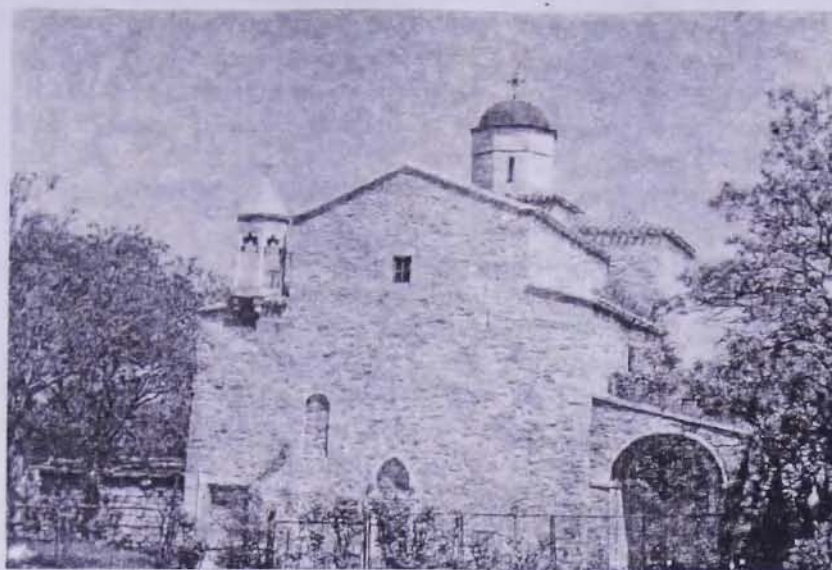
Церковь архангелов Габриэла и Микаэла в Феодосии