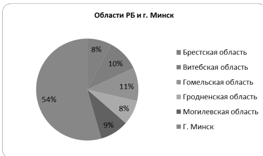
Рисунок 2. Число студентов по регионам и г. Минску (тыс. человек) за 2017/18 уч. год [2].

При анализе количества студентов по регионам и г. Минску (Рисунок 2) первое место занимает г. Минск (154,6 тыс. студентов), второе – Гомельская Область (30 тыс. студентов), последнее место принадлежит Брестской области, на долю которой приходится 21,8 тыс. студентов. В Минске обучается больше половины студентов всей республики [2].