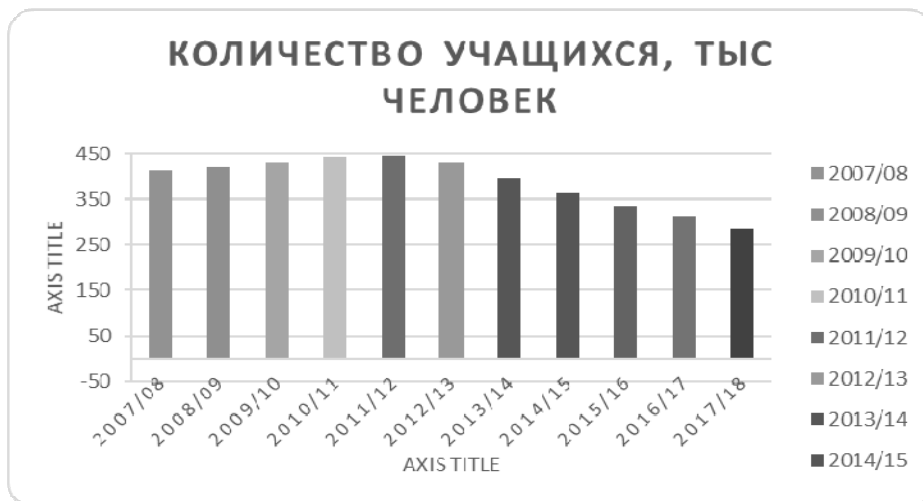
Рисунок 1. Количество студентов, тыс. человек

ной). Как видно на рисунке 1 количество учащихся с 2007/08 учебного года постепенно росло, но с 2011/12 учебного года началось снижение количества студентов, и на данный период снизилось в 1,6 раза [3].