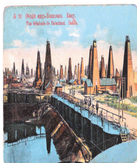
Открытка. «Общий вид Балаганов, Баку»

Из суждения о незаинтересованности царских властей в поджоге нефтяных вышек выводится второе суждение о причастности армянского фактора: “Тем не менее именно “Дашнакцутюн” оказался одним из проводников Запада по реализации ставившихся задач для ослабления России. А в качестве начального шага для обострения ситуации в нефтяном Баку дашнаки использовали межнациональный фактор. Именно от этого следует отталкиваться при оценке того, что произошло в Баку в августе-сентябре 1905 г.” Следствием этого представляются армяно-татарские столкновения и поджоги нефтяных вышек в двадцатых числах в Баку.