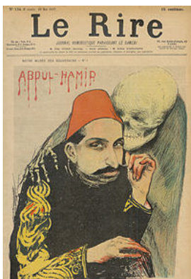
Карикатура на султана Абдул Гамида II, «Le Rire», 29 мая, Париж, 1897