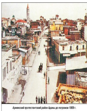
Армянский протестантский район Аданы до погромов 1909 г.

Точно так же привлекает внимание расхождение в оценке количества аданских жертв. Гюрюн отмечает: “Джемаль паша считает, что в событиях в Адане погибло 17000 армян и 1850 му-