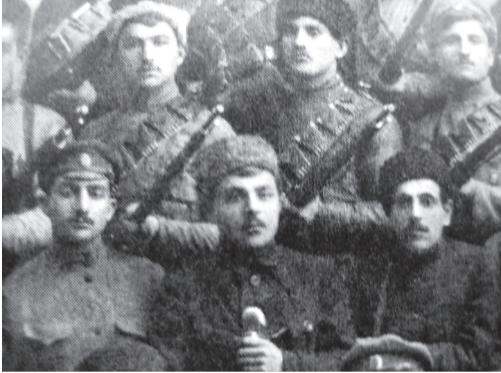
Կենտրոնում՝ Եղիշե Պահլավունի