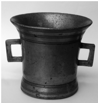
հավանգ - սանդ