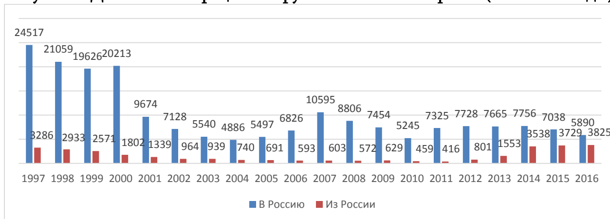
Рисунок 1. Динамика миграции из Грузии в Россию и обратно (1997–2016 годы).