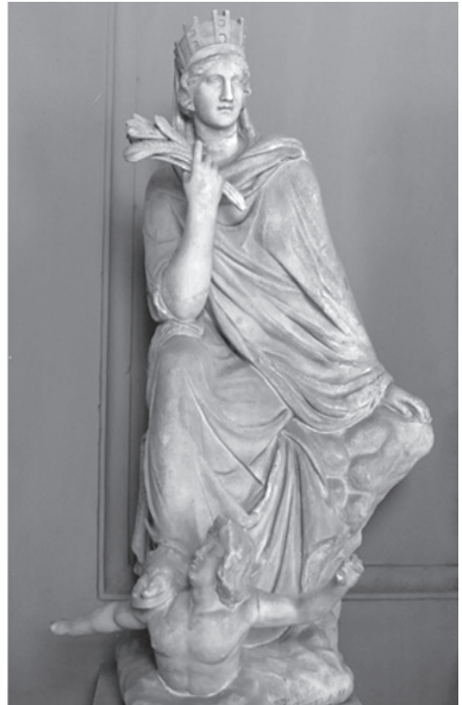
11. Անտիոքի քաղաքամայր Անտիոքիա-Տյուխե դիցուիին քաղաքի 4 աշտարակները ներկայացնող թագով, ձեռքին ցորենի հասկեր: Օրոնտես գետի անձնավորումը մերկ տղամադու այլաբանությամբ նրա ոտքերի տակ, մ.թ.ա. 3 դ., Էվտիխիդի մարմարյա արձան, կրկնօրինակ, Հռոմ, Վատիկան: