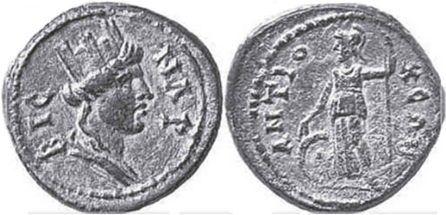
6. Բրոնզե մանրադրամի դիմերեսին Անտիոքի «քաղաքամայր դիցուհի Տյուխեն է Աթենասի կերպարով» հունարեն արձանագրություններով, գտնված ներկայիս Թուրքիայի տարածքից, որի դարձերեսին Հաղթանակի աստվածուհին է: