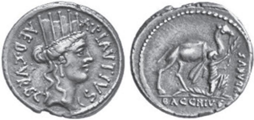
5. «Պլավտիոսի դեմարը» Կիբելե Մայր աստվածուհու պատկերով, պահվում է Նյու Յորքում: