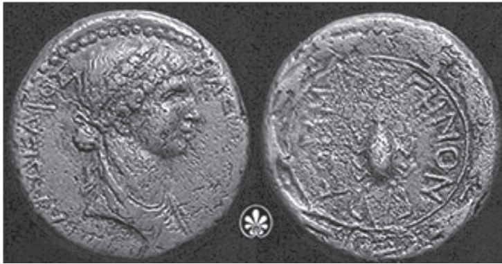
8. Իոթափեթ թագուհու՝ Անտիոքոս IV-ի կնոջ մանրադրամ, պղինձ, մ.թ.ա. 1 դ.: