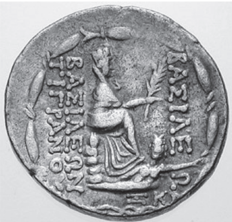
12. Տիգրան Մեծի մանրադրամը, մ.թ.ա. 95-55 թթ., դիմերեսին Տիգրանի դիմապատկերը, դարձերեսին Անտիոքի «քաղաքամայր դիցուիին» հայտնի քանդակից կրկնօրինակմամբ: