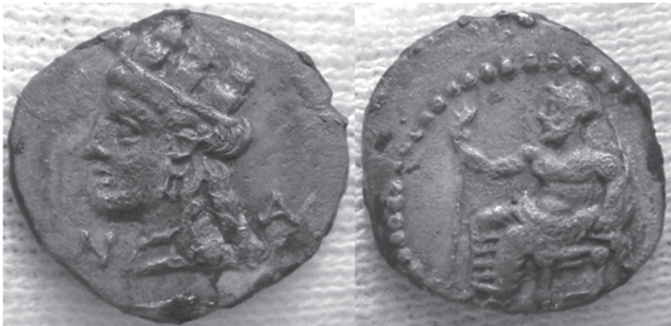
3. Բրոնզե դրամը գտնվել է հունական Նագիդոս քաղաքից, Կիլիկիայի տարածքից մ.թ.ա. 380-360թթ.: Ղրամի առջևի երեսին պատկերված է Տյուխեն հունական դիմագծերով պսակված եռամաս աշտարակածև թագով, իսկ դարձերեսին աստվածների հայրը Չևսը նման Ֆիդիասի ստեղծած քանդակին գահին բազմած և ձեռքին արծիվ: