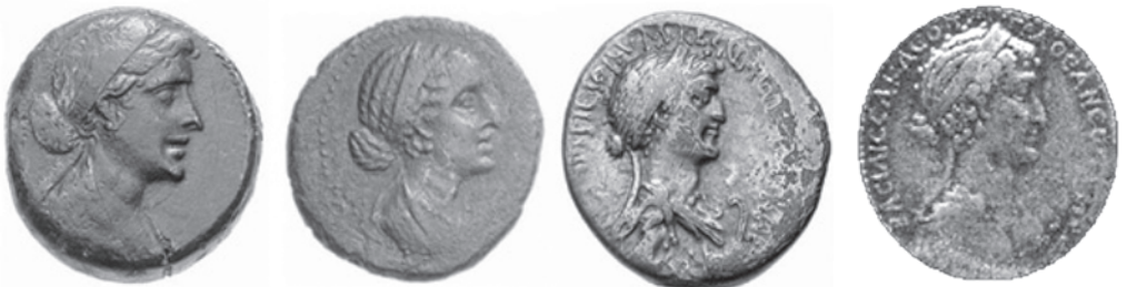
7. Կլեոպատրայի պղնձե և արծաթե մանրադրամները գտնված հելլենիստական Արտաշատից և Մակեդոնիայի տարածքից, մ.թ.ա. 32-31 թթ.: