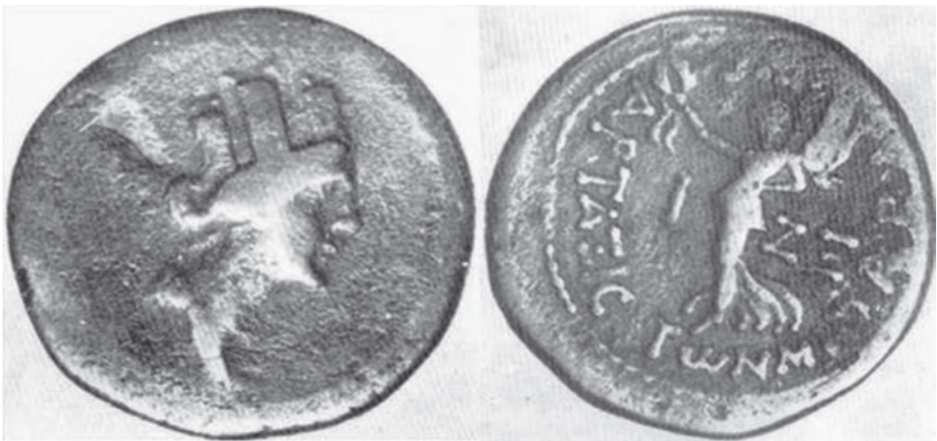
4. Արտաշատ մայրաքաղաքից գտնված «Արտաշատ-քաղաքամայր դիցուհու» պղնձից քաղկոսը, մ.թ.ա. 2դ., որի դարձերեսին ներկայացված է Հաղթանակի Վիկտորյա աստվածուհին: