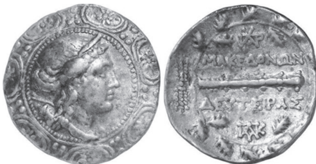
10. Մակեդոնյան արծաթյա մանրադրամ «քաղաքամայր դիցուհու» պատկերագրությամբ, մ.թ.ա. 2 դ.: