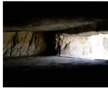
Ուրարտական ժայռափոր դամբարաններ