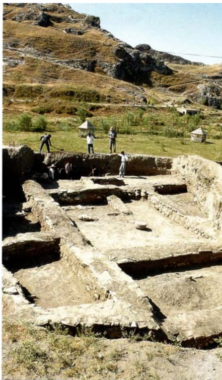
Պալատական նկարչի տունը

Տուշպա մայրաքաղաքը, եթե ոչ ի սկզբանե, ապա ուրարտական պետության գոյության ինչ-որ մի շրջանից սկսեց վայելել նաև ներքին ինքնավարություն: Դրա վկայությունն է,