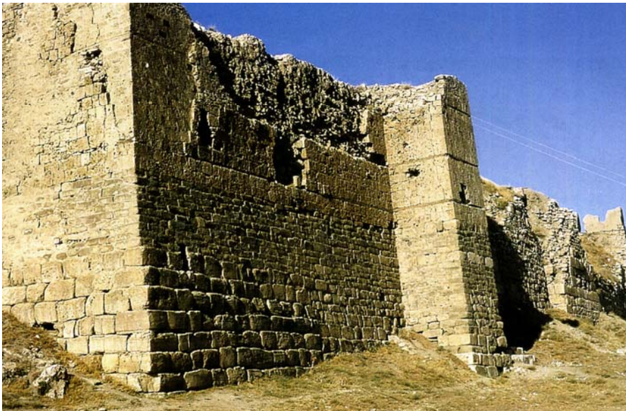
Վանի միջնաբերդի պարիսպները

Վանի արքաների իշխանությունը լեռնաշխարհում հիմնվում էր ծայրագավառները կենտրոնին կապող ճանապարհների մոտ կառուցված քաղաքների վրա: Դրանցից որոշները արքայանիստ էին՝ խոշոր պալատով, տաճարներով, բնակելի հարկաբաժիններով, հյուրասրահներով, որոնք երբեմն հիշեցնում էին հետագայի արեմենյան սյունազարդ ապադանաները, արհեստանոցներով, գինու հսկայական մառաններով և շտեմարաններով: Քաղաքներն ունեին բնակելի թաղամասեր, ջրամատակարարման ու ջրահեռացման համակարգ և այլն: