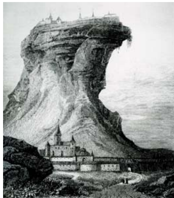
Այսպես էր պատկերացնում Վանը ֆրանսիացի նկարիչ Ժակ-Հիպոլիտ Վանդերբուրխը (XIX դ. սկիզբ, գրավյուր) 4

Իսկ քարածայրի՝ դեպի արեգակը դարձած կողմը, որտեղ այժմ և ոչ մի զիծ կարող է մարդ գծել երկաթով այսպիսի կարծր քարի մեջ զանազան տաճարներ, սենյակներ, ննջարաններ, գանձարաններ և երկար վիհեր՝ հայտնի չէ ինչ բանի համար, հրաշակերտեց: Իսկ քարածայրի բոլոր երեսը հարթելով, ինչպես գրչով հարթում են մեղրամուրը, վրան շատ գրեր գրել սովեց, որոնց տեսքը միայն բոլորին զարմացնում է և ոչ միայն այստեղ, այլև Հայոց աշխարհում, շատ տեղերում արձաններ կանգնեցրեց, և նույն գրերով իր մասին ինչ-որ հիշատակ հրամայեց գրել և շատ տեղերում նույն գրով սահմաններ էր հաստատում» 3 :