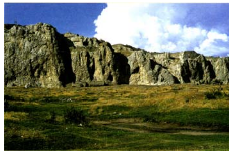
Վանա ժայռը և միջնաբերդի պարիսպները