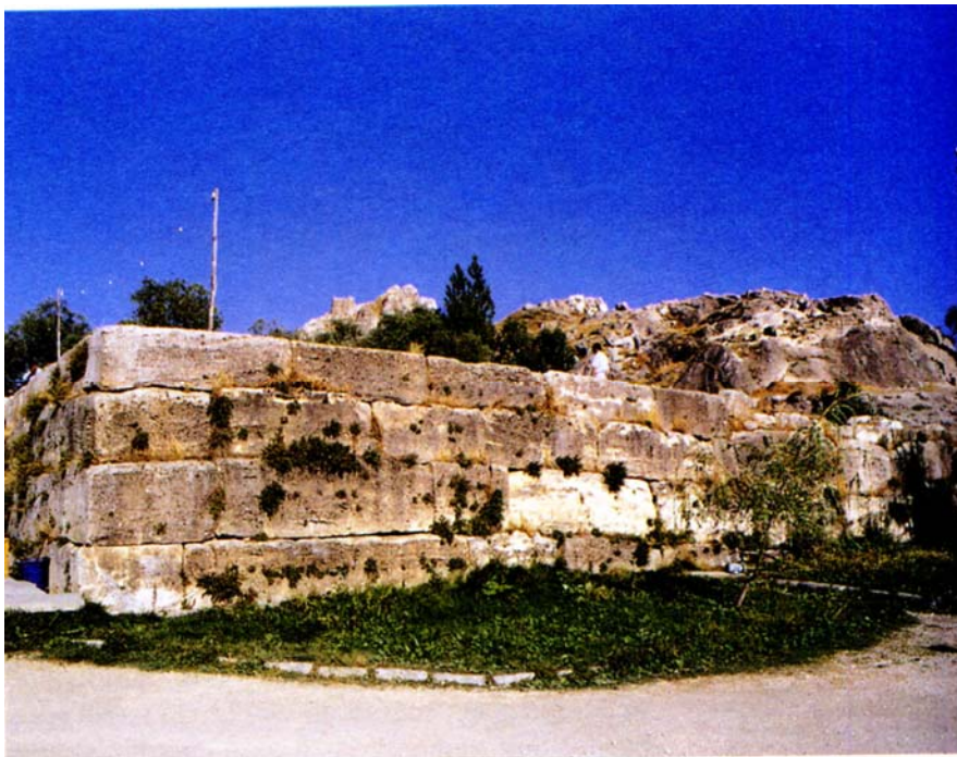
Սարգուրի I-ի կառուցած շինությունը

«Տուրուշպա քաղաքում». սա Վան քաղաքի մասին առաջին հիշատակությունն է ասորեստանյան սեպագիր աղբյուրներում իր հնագույն անվանաձևով, որից և հին հունարեն Թոսպիտիս ու Թոսպիա (Θωσπίτις, Θωσπία) և հին հայերեն Տոսպ կամ Տոգբ անունները: