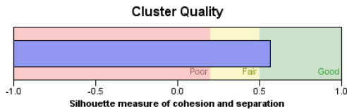
Գծապատկեր 3.3 Քլաստերավորման արդյունքներ 2015թ.

Ինչպես երևում է գծապատկեր 3.3-ից, Սիլուետի չափոցոչիչը մեծ է 0.5-ից, ինչը ցույց է տալիս քլաստերավորման բարձր որակ: Նույն նկարից պարզ է դառնում նաև, որ երկրների ընտրանքը բաժանվել է 3 քլաստերների, որոնցից 1-ինը ներառում է դիտարկվող երկրների 25 տոկոսը, երկրորդն ու 3-րդը՝ համապատասխանաբար 50 տոկոսը և 25 տոկոսը: