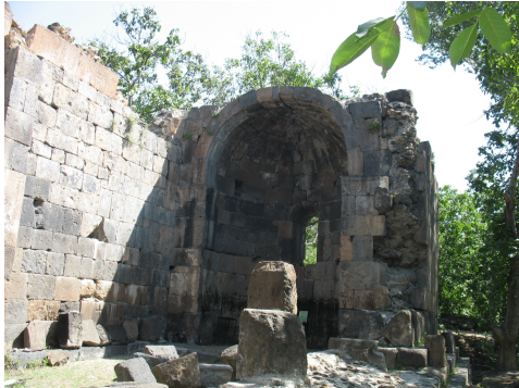
Ավանի Ս. Աստվածածին եկեղեցին

Այսօր էլ Ավան գյուղում կանգուն է, ցավալիորեն կիսավեր վիճակում, ավելի քան հազար վեց հարյուր տարիների անցուդարձերի կնիքը հպարտորեն կրող Ս. Աստվածածին եկեղեցին: Այն ունի վաղմիջնադարյան հայկական եկեղեցաշինությանը բնորոշ միանավ բազիլիկի ձև՝ ուղղանկյուն հատակագծով: