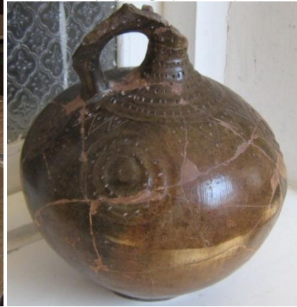
Նկ. 12 Դարչնագույն միականթ սափոր