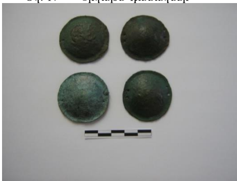
Նկ. 19 Զրահակոճակներ