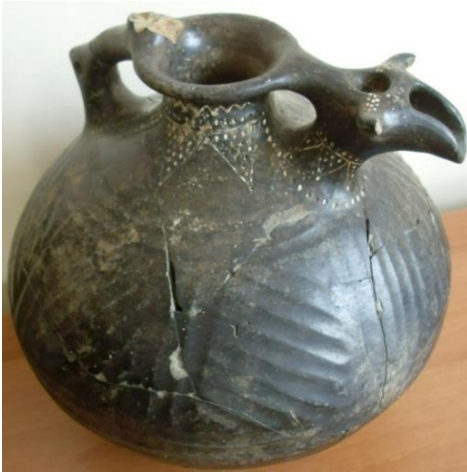
Նկ. 9 Յլագլուխ ծորակափոր անոթ