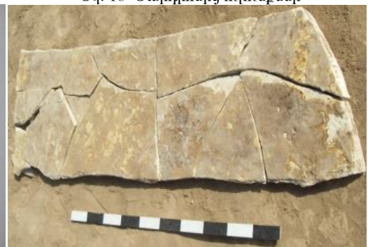
Նկ. 20 Թերթաբարից սալ