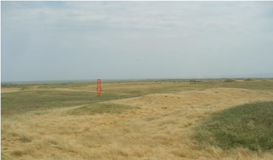
Նկ. 1 Դամբարանաբլուրը մինչև պեղումները