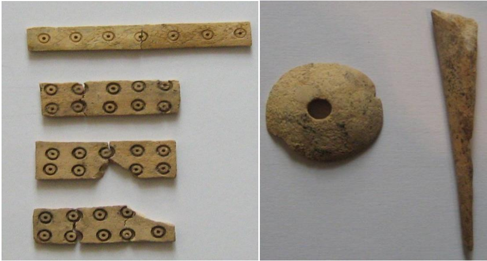
Նկ. 16 Ոսկրն ներդիրներ, իլիկի գլուխ, հերուն