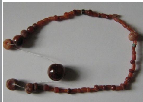
Նկ. 18 Սարդիոնից ուլունքներ