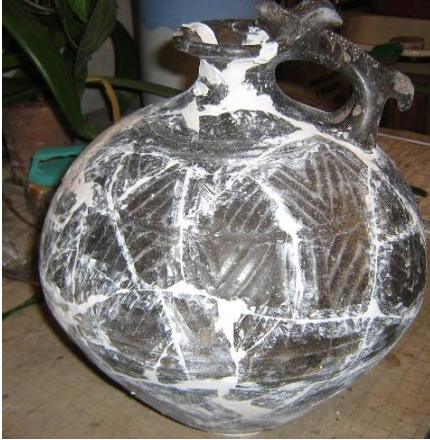
Նկ. 11 Խոյաբանդակ կանթով սափոր