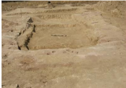
Նկ. 3 Դամբանախցի տեսք