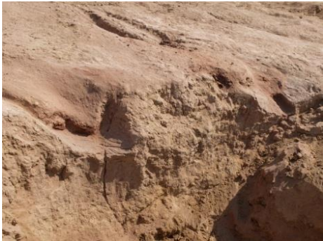
Նկ. 2 Գերանների հետքերը