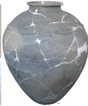
Նկ. 14 կճուճ