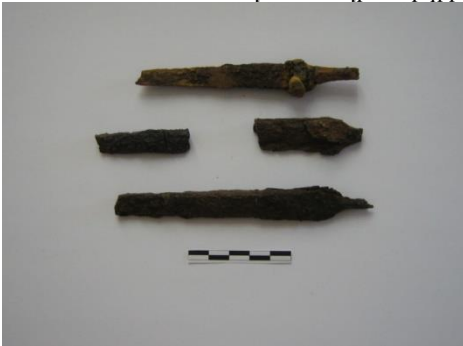
Նկ. 17 Երկաթն դանակներ