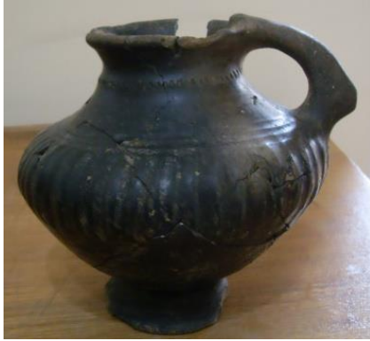
Նկ. 13 Միականթ գավաթ