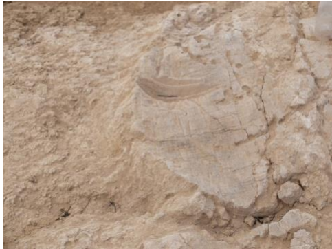
Նկ. 4 Խսիրի դաջվածք կավի վրա