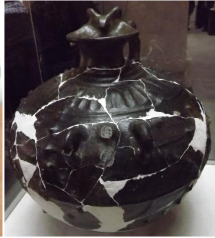
Նկ. 10 Խոյաբանդակ շուրթով սափոր