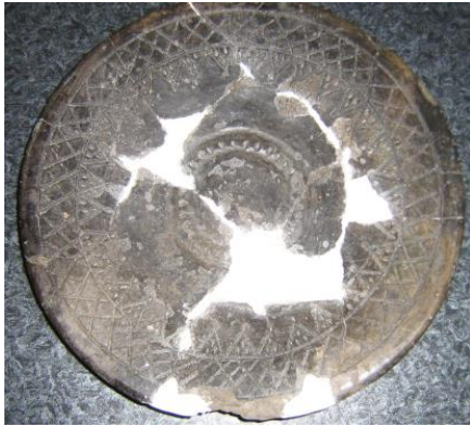
Նկ. 14 Ափսն կենաց ծառի պատկերով