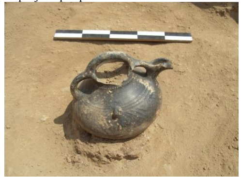
Նկ. 8 «Թեյնիկատիպ» անոթ