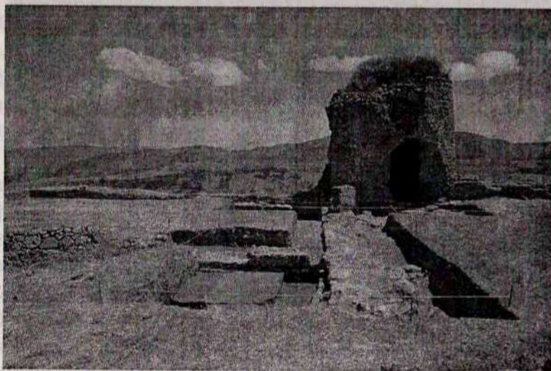
Նկ. 3. Շոշվա սղնախը. պեղված հատվածի ընդհանուր տեսքը:

հեռու են ավարտից (նկ. 3), բայց արդեն տվել են լուրջ տվյալներ, որոնք վկայում են, որ պարսպապատերից ներս գտնվող այս հատվածը բնակեցված է եղել գոնե մ.թ.ա. I հազարամյակի սկզբից: