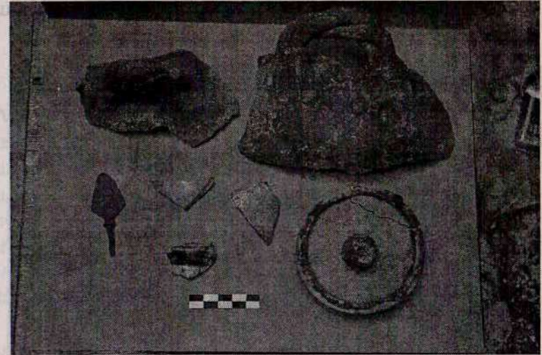
Նկ. 2. Իրեր՝ գտնված Կարկառ ամրոցի հարթակի պեղումներից, 12-14-րդ դդ.:

զոր հանեալ էին յառաջագոյն ի նմանէ ազգն թուրքաց և վրաց»: 2