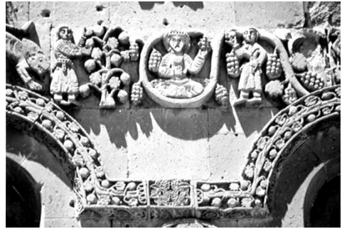
Նկ. 2 Հնձան, մանրամաս Աղթամարի սր. Խաչ տաճարի որթագալարի գոտուց (ըստ Օրբելու, 1968):