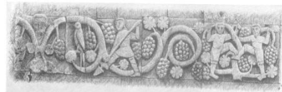
Fig. 1. Մանրամաս, Վայոց ձորի Խաչ տաճար (Հ-Կ)