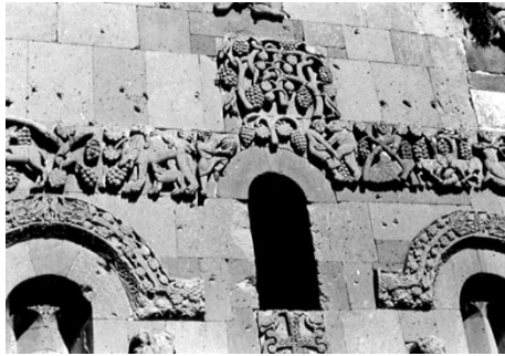
Նկ. 1 Մանրամաս Աղթամարի սր. Խաչ տաճարի որթագալարի գոտուց, 10-րդ դ.: