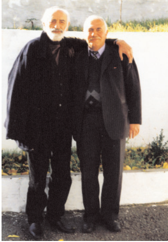
Ռազմիկ Պերրոսյանը Սոս Սարգսյանի հետ