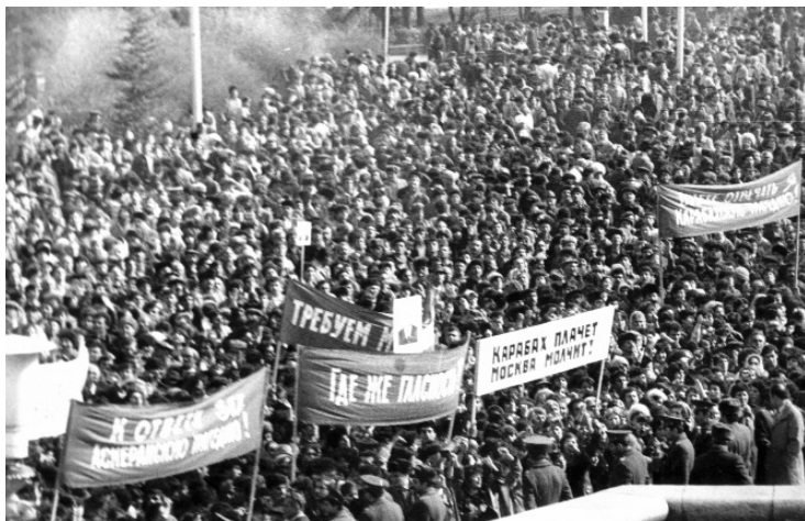
Արդար պահանջ՝ ոչ մի նստանց...