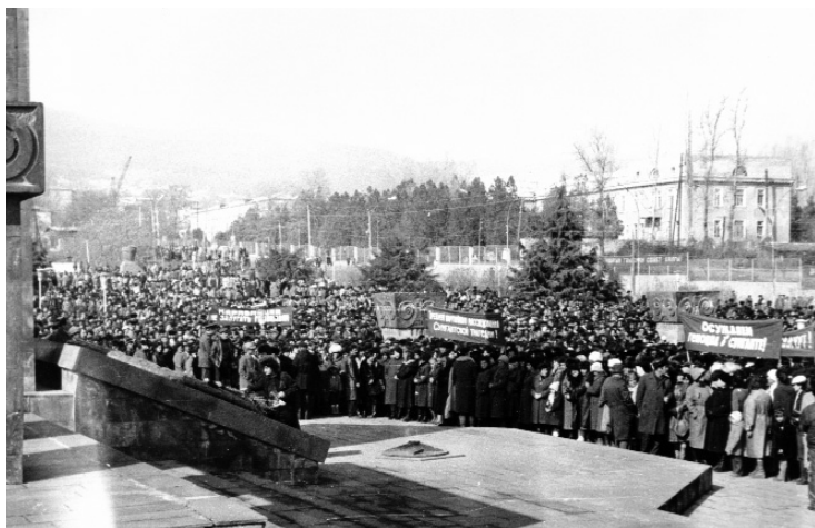
Հիշարանն արդարոց՝ օրհնությանը եղիցի...