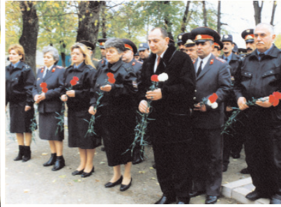
Ռազմիկ Պերրոսյանը, Ռաշիդ Պերրոսյանը եւ Բակո Սահակյանը Հաղթանակի փոնի և Շուշիի ազատագրման օրվա առթիվ ժաղիկներ են դնում ԼՂՀ Ոստիկա- նության Արցախյան ազատա- մարտում զոհված աշխատակիցների հիշարակին կանգնեցված հուշ- արձան-խաչքարի պարվանդանին: