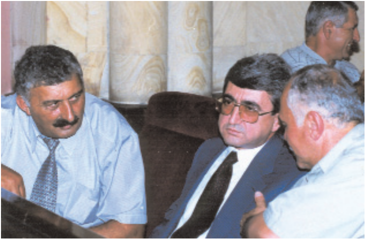
Ռոլես Աղաջանյան, Սերժ Սարգսյան, Ռազմիկ Պերրոսյան: