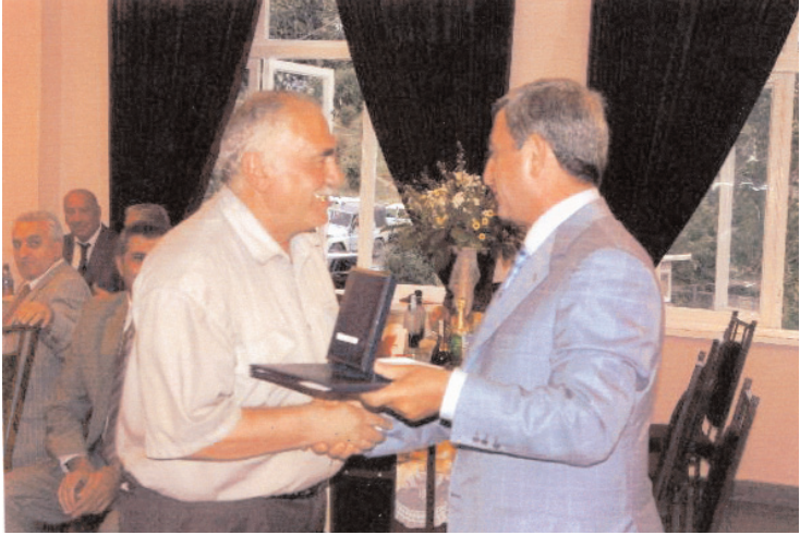
Սերժ Սարգսյանը պարգևատրում է Ռազմիկ Պերրոսյանին: