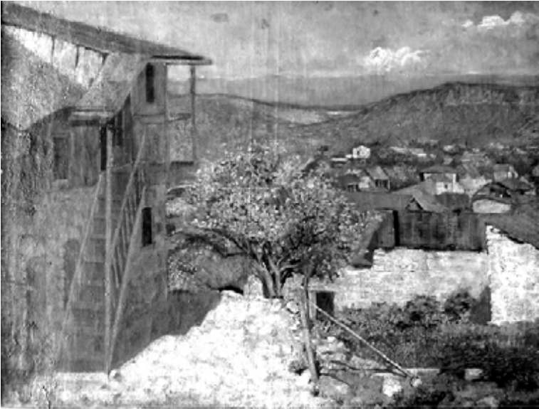
Նկար 1. Տեսարան Շուշիում

Ստեփան Աղաջանյանը այն հիանալի հայ վարպետների շարքում է, որոնց ստեղծագործական բարձր նվաճումները հայ կերպարվեստը ներգրավեցին Նոր ժամանակի համաեվրոպական գեղարվեստական ընթացքի մեջ: Այս գեղանկարչի ժառանգությունը նշանավորվում է գաղափարաբովանդակային հարուստ լուծումներով և գեղարվեստական լեզվի ամբողջականությամբ: Աղաջանյանը ինչպես նաև մի շարք այլ վարպետներ հետևեց այսպես կոչված ավանդական ռեալիստական գեղանկարչության սկզբունքներին, աշխատելով հիմնականում որպես դիմանկարիչ: