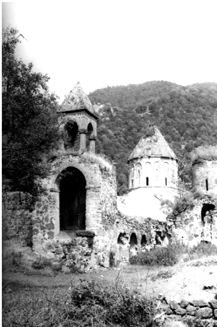
Նկար 3. Դադիվանքն արևմուտքից

ԼՂՀ Մարտունու շրջանի Վաղուհաս գյուղի մոտ, անտառածածկ լեռան վրա կառուցված խաթրավանքը հիմնադրվել է վաղ միջնադա-