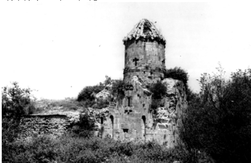
Նկար 5. Գտջավանքը հարավից

Ժանր պայմաններում անգամ վանքն 5-րդ դարից անընդմեջ գործող դպրոցով շարունակել է մնալ որպես կրոնական և մշակութային կենտրոն, 15-16-րդ դդ. այստեղ բազմաթիվ ձեռագրեր են գրվել և ընդօրինակվել: 17-րդ դ. երրորդ քառորդում Գանձասարի Պետրոս կաթողիկոսը վերակառուցել է Ամարասի վանքը, կառուցել պարիսպները, խցերը, տնտեսական շինությունները: Արևելյան Հայաստանը Ռուսաստանին միացնելուց հետո Ամարասի վանքը, որն ուներ բավական ուժեղ պաշտպանական համակարգ, օգտագործվել է որպես ամրոց, իսկ 1832-1847 թթ. եղել է ռուս-պարսկական սահմանի մաքսատունը: 1858 թ. Գրիգորիսի գերեզմանի վրա նոր՝ եռանավ բազիլիկ եկեղեցի է կառուցվել, իսկ 1898 թ. շուշեցի ճարտարապետ Մ. Տեր-Իսրայելյանցը պատրաստել է Գրիգորիսի տապանաքարը: