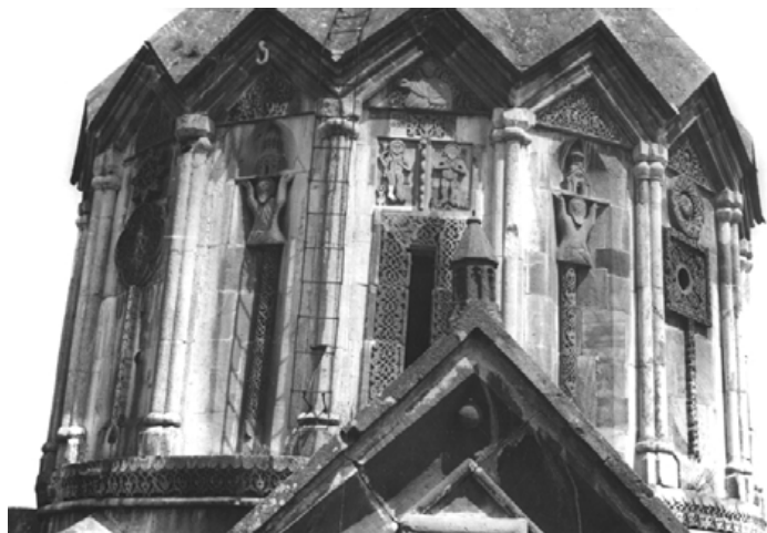
Նկար 1. Գանձասարի վանքի Ա.Դովհաննես Մկրտիչ եկեղեցու գմբեթը

Արցախը, ինչպես և պատմական Հայաստանի առանց բացառության մյուս բոլոր նահանգները, չափազանց հարուստ է պատմության և մշակույթի տարբեր դարաշրջանների հուշարձաններով: Մի քանի հազարի է հասնում պաշտամունքային, աշխարհիկ, մեմորիալ ճարտարապետական կառույցների թիվը, որոնք թվագրվում են 4-րդ դարից մինչև 19-րդ դարը: Արցախի ճարտարապետությունը վաղ միջնադարից սկսած զարգացել է այն ընդհանուր օրինաչափությունների հիման վրա, որոնք բնորոշ են եղել ողջ հայկական շինարարական արվեստի համար: