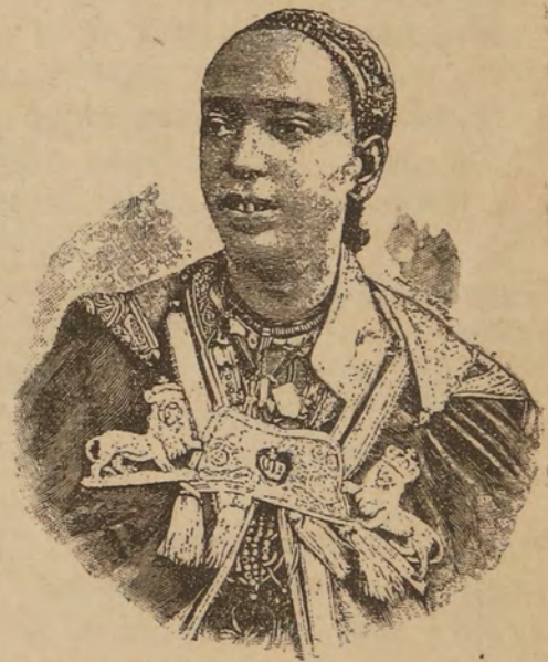
Менеликъ II, Царь царей Эѳіопіи и его супруга Таиту.