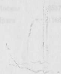
ТАБЛИЦА 2. ЧИСЛЕННОСТЬ НАСЕЛЕНИЯ ПО СТРАНАМ СЭВ