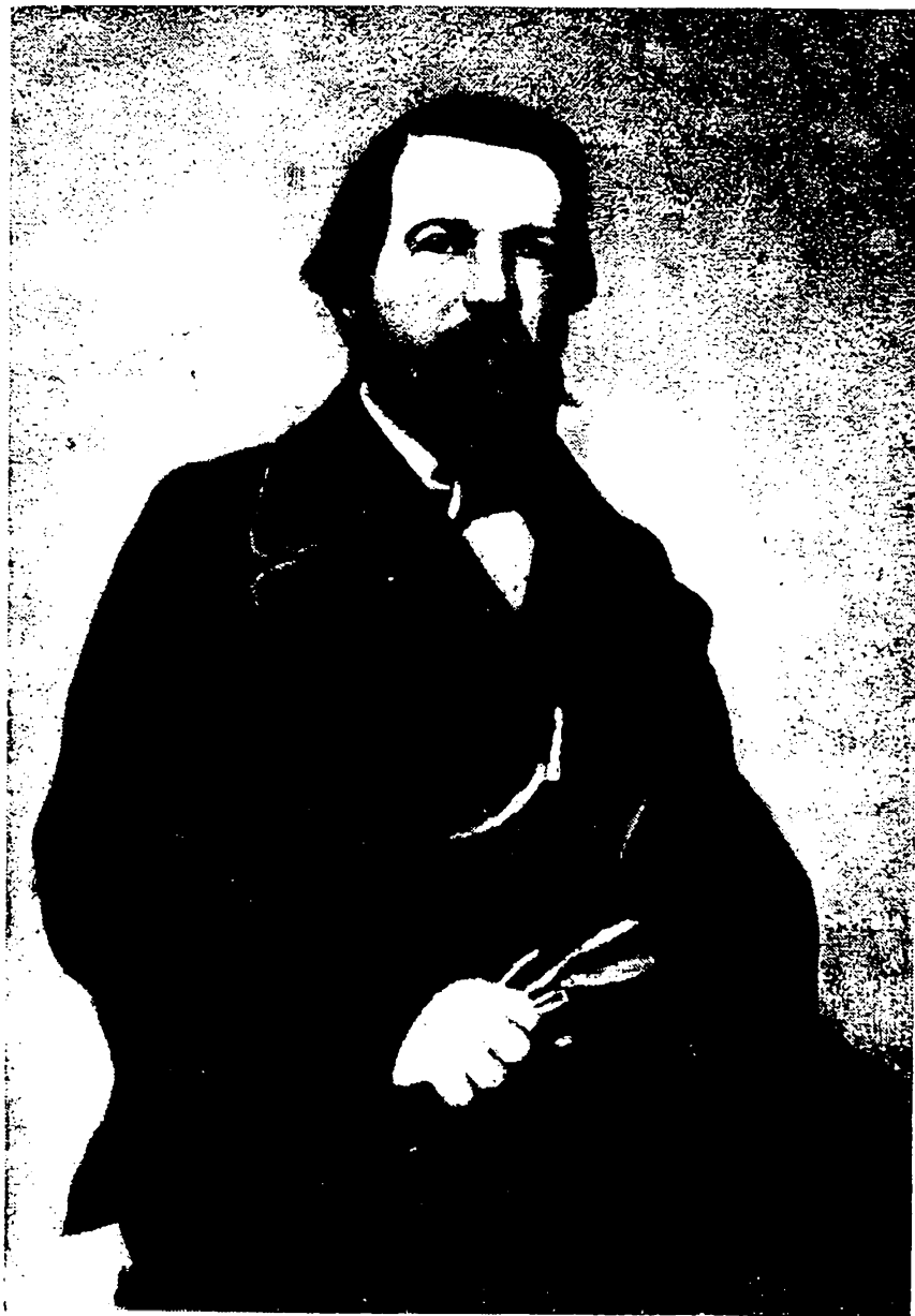
Фридрих Энгельс 1820 1895