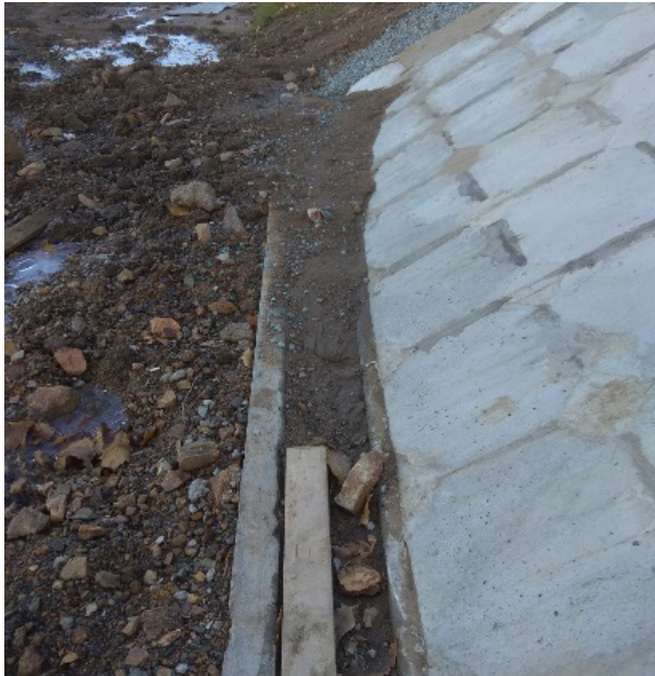
Загрязнение водоотводных лотков на мосту через р. Ключ на ПК3+12,105