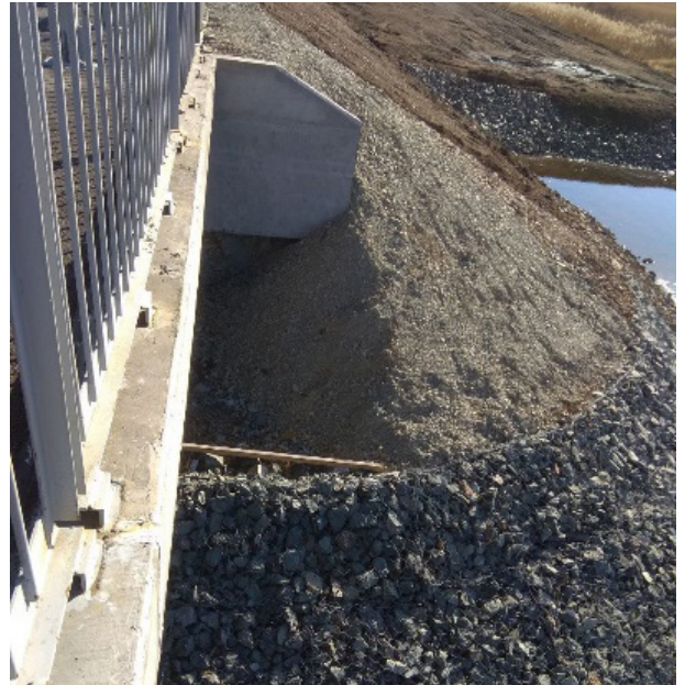
Разрушение конусов на мосту через р. Ключ на ПК3+12,105