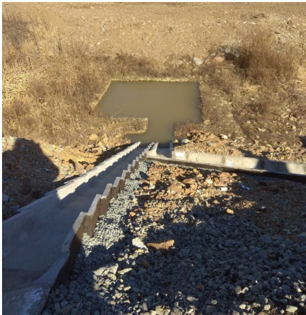
Скопление воды в испарителе путепровода на ПК129+36,59