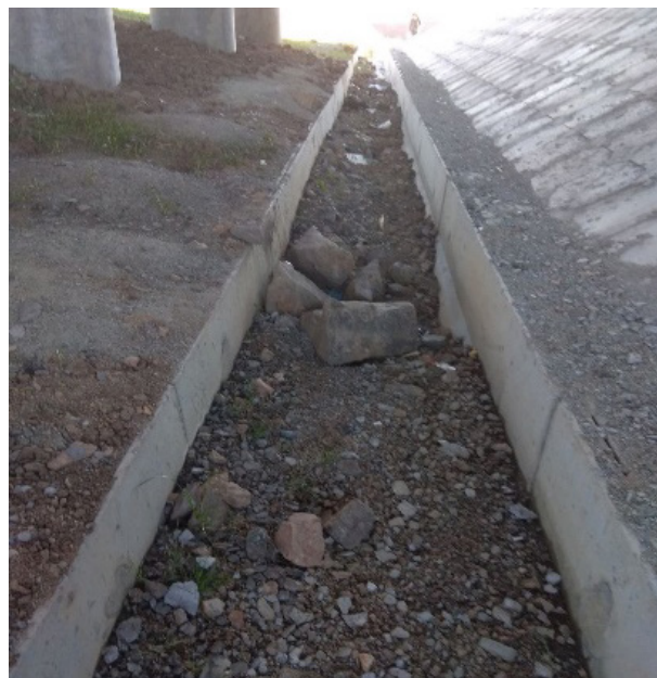
Загрязнение водоотводных лотков путепровода на транспортной развязке № 1