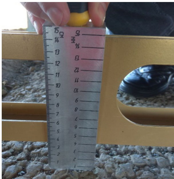
Завышение обочины на 3,5 см на транспортной развязке № 1

Так, в ходе осмотра Объекта-1 инспекторами Счетной палаты Российской Федерации установлены следующие недостатки: завышение обочин на отдельных участках построенной дороги; загрязнение водоотводных лотков практически всех искусственных сооружений; необеспеченный водоотвод отдельных искусственных сооружений; разрушение откосов конусов ряда мостовых сооружений.