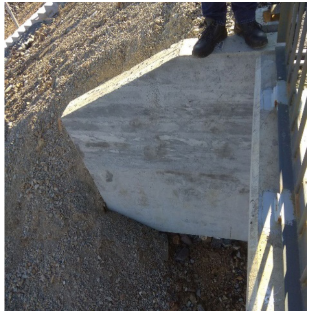
Разрушение конуса на мосту через р. Шкотовка на ПК72+54,915

В ходе контрольного мероприятия указанные недостатки содержания Объекта-1 подрядной организацией устранены.