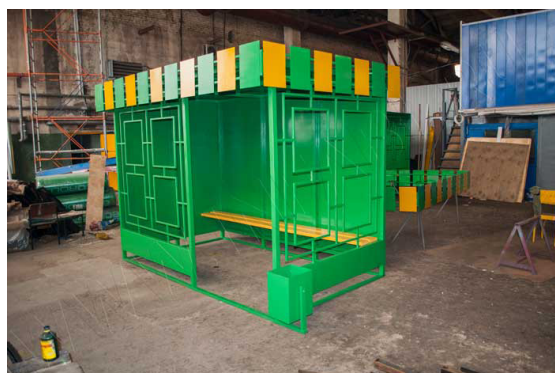
Рис. 1 Остановочный павильон ОМ-7, предусмотренный локальным сметным расчетом

В ходе визуального осмотра выявлено, что установленные остановочные павильоны по внешнему виду и комплектации не соответствуют требованиям к остановочным павильонам модели ОМ-7, предусмотренным вышеуказанным муниципальным контрактом, а также локальным сметным расчетом. Фактически установленные остановочные павильоны выполнены из профилированных труб и профилированного железа, скамьей и урной не укомплектованы (Рис. 2).