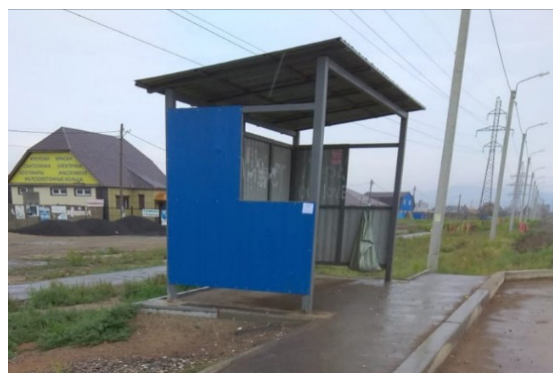
Рис. 2 Фактически установленные остановочные павильоны