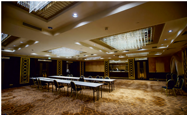
Помещения для организаторов и персонала