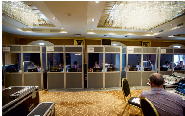
Центр управления переводами