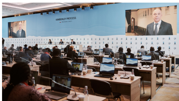
Проведение пленарного заседания КП

Кроме того, сроки аренды помещений по сравнению с требованиями ТЗ были сокращены (за счет ускорения демонтажных работ), не возникло необходимости во внутренней застройке и дооборудовании помещений отеля «St. Regis Москва Никольская».