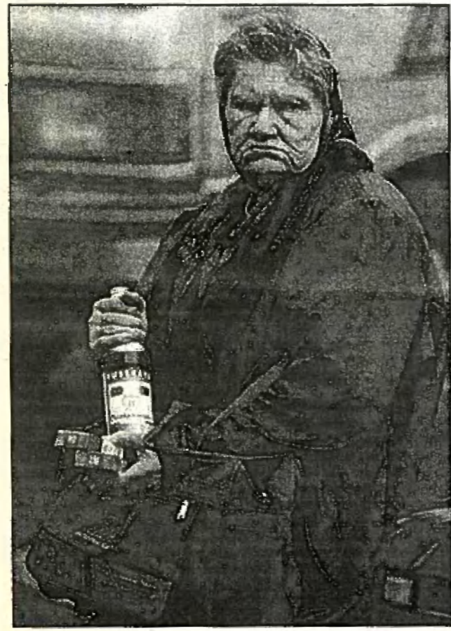
Многие безработные и пенсионеры, чтобы выжить, вынуждены заниматься перепродажей водки и сигарет

Очевидно, что при такой загрузке Думы внутриполитическими делами и ее обострившемся конфликтом с президентом до конца весенне-летней сессии вопрос о договоре с Украиной рассмотрен так и не будет. Слово московских коммунистов, в том числе таких ответственных товарищей, как Геннадий Селезнев и Зюганов, обещавших ратификацию, оказалось слишком легковесным. У Селезнева и Зюганова осталась лишь идея, чтобы выполнить обещание. Вряд ли успеют — времени слишком мало, да и желания, очевидно, нет.