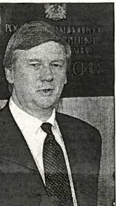
Чубайсу, ведущему переговоры с МВФ, как никогда нужна поддержка правительства

Однако большинство законов труднопроходимо — и не столько потому, что депутаты не любят Ельцина и Кириенко. Ни один из предложенных проектов не вызовет восторга у избирателей, поскольку весь так называемый антикризисный пакет сводится к усилению фискального бремени — росту налоговой нагрузки как на предприятия, так и на население, а также ужесточению наказаний за несоблюдение платежной дисциплины. К примеру, предлагается ввести 5—7-процентный налог с продаж (подобная поправка существовала в СССР в 1991 г. при премьер-министре Валентине Павлове). Двукратно повысится НДС на детские товары и продукты питания. Ставки подоходного налога несколько уменьшаются — но при этом ликвидируются все льготы по его введению, и ничуть не снижаются издержки на фонд зарплат.